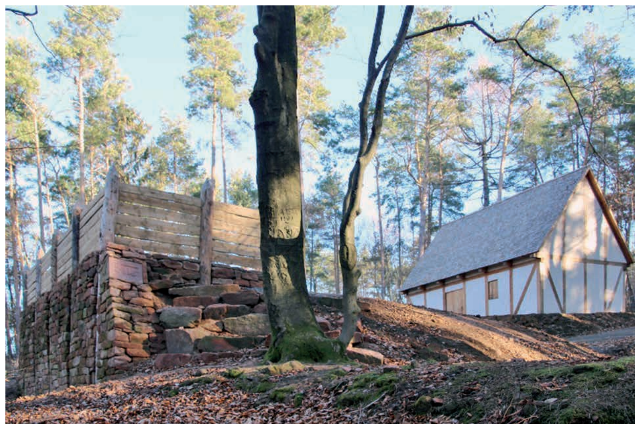
Rekonstruktion der Pfostenschlitzmauer und des Gebäudes aus der mittleren Eisenzeit auf der Altenburg.

Die Altenburg liegt etwa 2,5 km entfernt. Folgen Sie dem Markierungszeichen „Ringwall Altenburg“. Es wird festes Schuhwerk empfohlen und körperliche Belastbarkeit vorausgesetzt, da ein Höhenunterschied von 150 Metern zu überwinden ist.