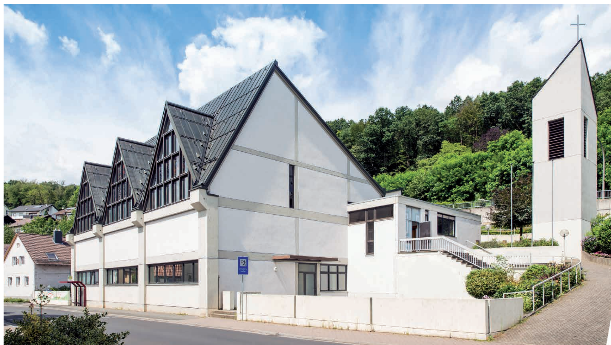
An der Hauptstraße steht die St.-Barbara-Kirche von 1976 mit dem Pfarrzentrum, wo eine Kindertagesstätte untergebracht ist.