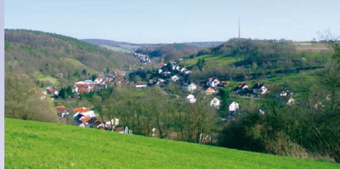
Panoramablick in den Leidersbachgrund

Zwei Wanderungen erwarten Sie in und um den Leidersbachgrund, der seit dem 19. Jahrhundert von der Heimschneiderei und der Kleiderfabrikation geprägt wird.