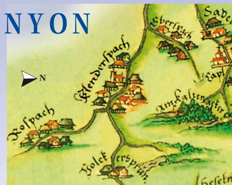
Die Ortsteile Ebersbach, Leidersbach, Roßbach und Volktersbrunn in der Übersicht auf der Spessartkarte des Nürnbergers Paul Pfinzing von 1594

Weglängen: ● Leidersbach-Ebersbach 8 km ● Roßbach-Volkersbrunn 12 km Startpunkt Schleife Leidersbach: Marienplatz Startpunkt Schleife Roßbach: Wanderparkplatz Eschenack