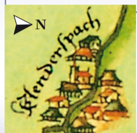
Leidersbach erscheint auf der Panzinkingkarte als »Klenderspach« mit dem damals einzigen Kirchengebäude im Tal.