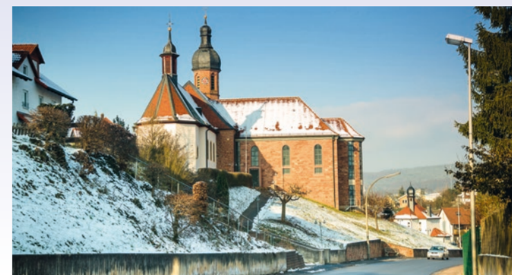
Die mehrmals erweiterte Laurentiuskirche in Roßbach