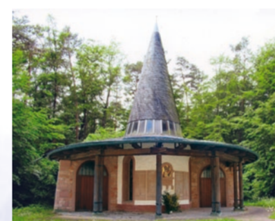
Die »Heimkehrer-Kapelle« bei Roßbach

Das bedeutendste Gebäude in Roßbach ist die Kirche, die 1668 erstmals erwähnt und mehrfach erweitert wurde. Hier kann man eine wunderschöne Madonna bestaunen, die vermutlich aus der ehemaligen Mutterpfarre in Kleinwallstadt hierher gekommen ist.