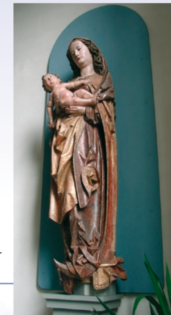
Die Madonna in der Roßbacher Kirche