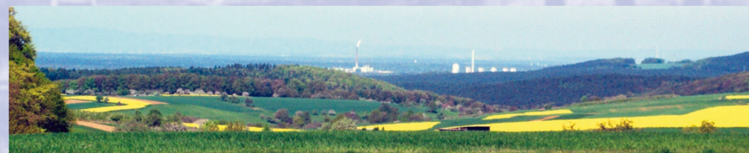
Vom Höhenweg bei Volktersbrunn reicht der Blick weit in Richtung Rhein-Main und Odenwald.