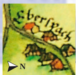
Spessartkarte von Paul Pfinzing mit »Eberspach« am Krebsbach gelegen.