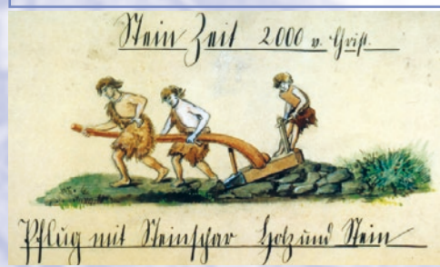
Die Menge der bei Ebersbach geborgenen Funde aus der Jungsteinzeit animierten das Museum zu Aschaffenburg um 1900 zu einer Serie von Abbildungen zu diesem Thema. Mit Fell bekleidet den steinigen Boden beackernd - so stellte man sich damals die Menschen der Jungsteinzeit vor.

Ebersbach unterscheidet sich von den übrigen Leidersbacher Ortsteilen durch die Menge der vorgeschichtlichen Funde, die vor über 100 Jahren hier gesammelt wurden. Seit der Steinzeit war diese Gemarkung besiedelt. Neben Lesefunden in Form von Steinbeilen und Äxten ist der oberhalb Ebersbachs gelegene Ringwall Altenburg ein weiterer Hinweis für die Erschließung der Region in prähistorischer Zeit.