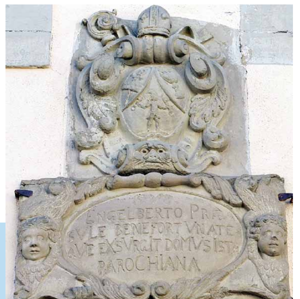
Das Pfarrhaus mit der Bauinschrift des Abtes Engelbert Schöffner. Die Jahreszahl im Chronogramm ergibt 1738, das Jahr des Baubeginns.

Er war verantwortlich für den Bau des Turmobergeschosses in Gaukönigshofen sowie für den Bursariatsbau (Amtssitz des Klosterverwalters = Bursarius) im Kloster Bronnbach.