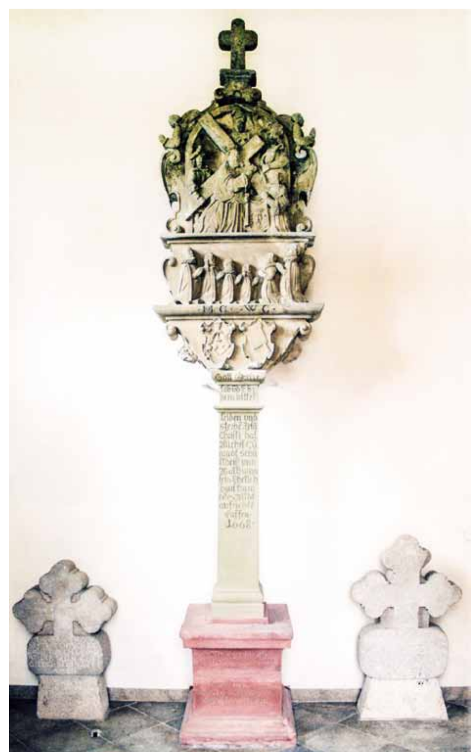
Pestsäule der Familie Konrad von 1638 mit den beiden Grabkreuzen

Wir sind nun mitten im 30jährigen Krieg (1618-1648). Nach der Besetzung des Landes durch die Schweden und ihrer Vertreibung zieht mit den Soldaten die Pestseuche durch die Dörfer.