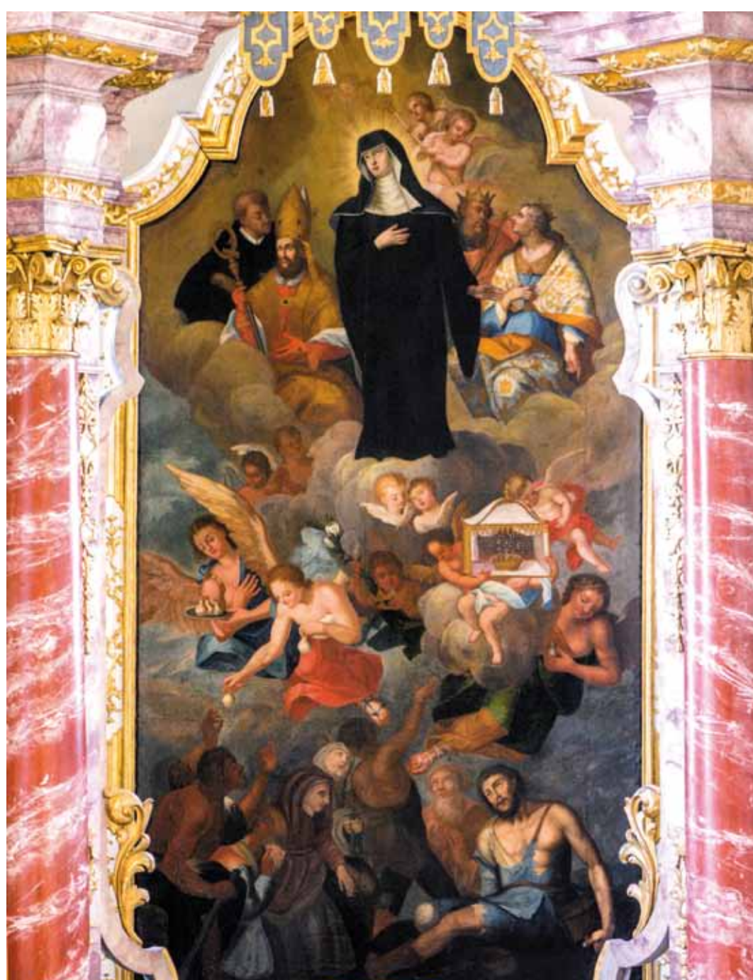
Hauptaltarbild der Walburga von Oswald Onghers von 1666

Wir sind nun mitten im 30jährigen Krieg (1618-1648). Nach der Besetzung des Landes durch die Schweden und ihrer Vertreibung zieht mit den Soldaten die Pestseuche durch die Dörfer.