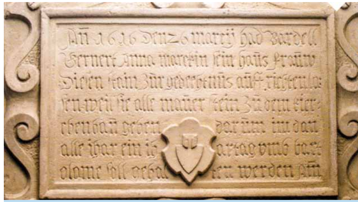
Inschrift für die Stifter der Mauersteine 1616

Die erste urkundliche Erwähnung des Ortes Allersheim ist zugleich die erste Erwähnung einer Kirche. Im Eichstätter Bischofsbuch ist verzeichnet, dass Bischof Gundekar II. (reg. 1057 - 1075) eine Kirche in „Alderesheim“ weihte. Allersheim gehörte damals zum Kloster Monheim in der Diözese Eichstätt.