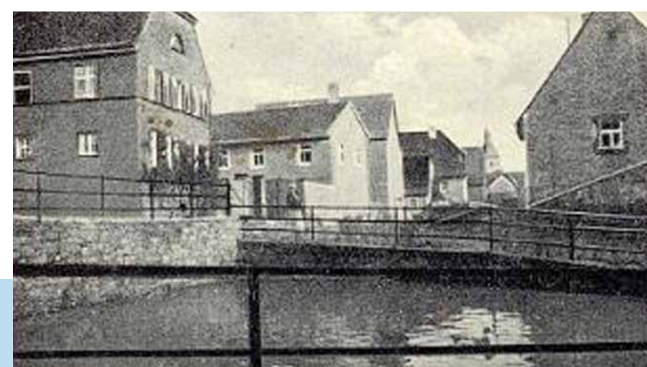
Die Weth in den 1950er Jahren als Feuerlöschweiher

Eine andere Frage war die Bereitstellung von Löschwasser für die Feuerwehr. Hierzu wurde die „Weth“ zu einem Becken ausgebaut, in dem sich größere Wassermengen sammeln konnten. Ein Feuerlöschweiher entstand, für dessen Betriebsbereitschaft es notwendig war, ihn regelmäßig von Pflanzenbewuchs zu befreien. Dies geschah in Fronarbeit. Die Einwohner leisteten mehr oder weniger freiwillig kostenfreie Arbeitsstunden - das war früher üblich.