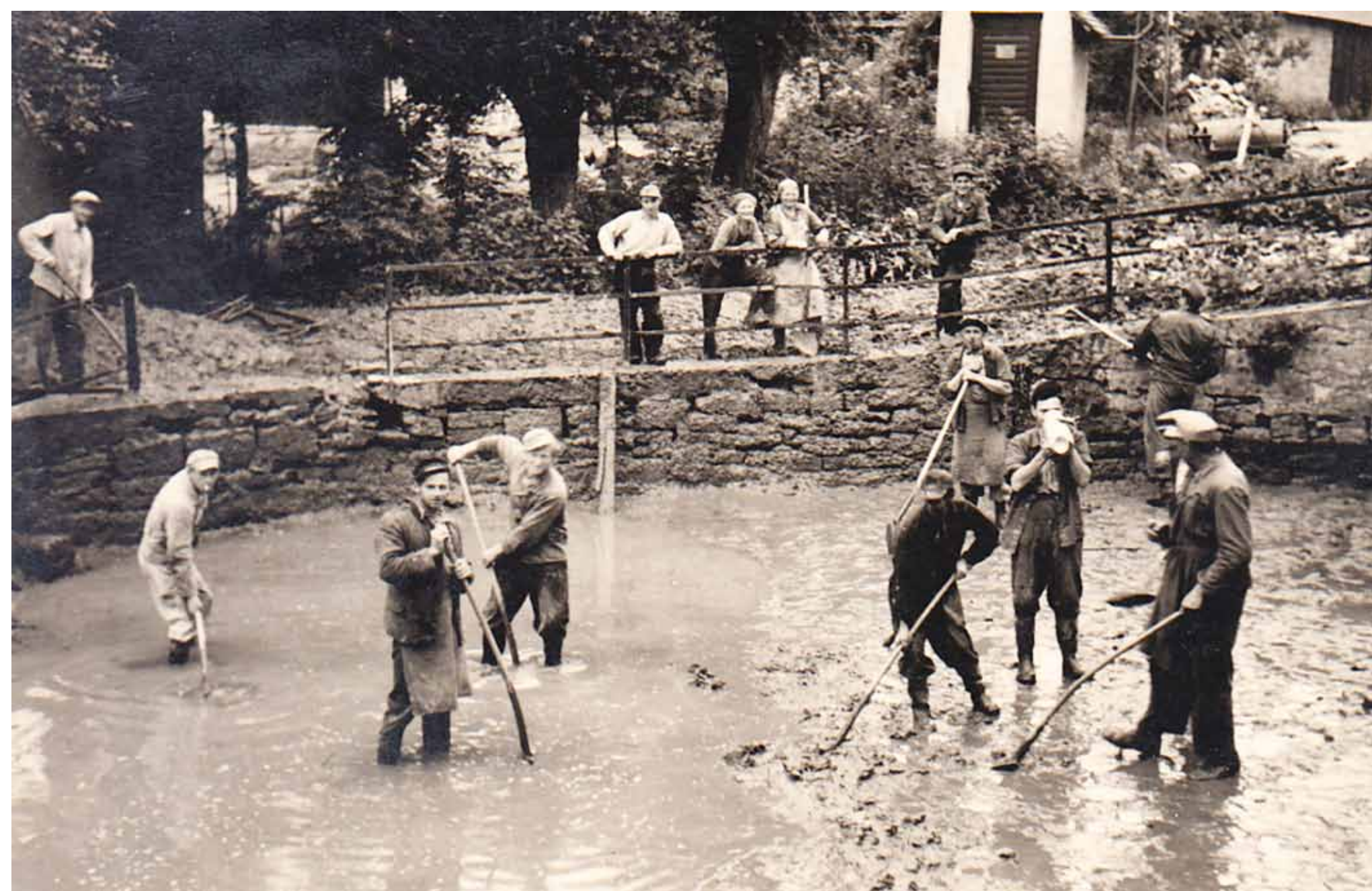
Frondienst bei der Säuberung der Weth in den 1960er Jahren