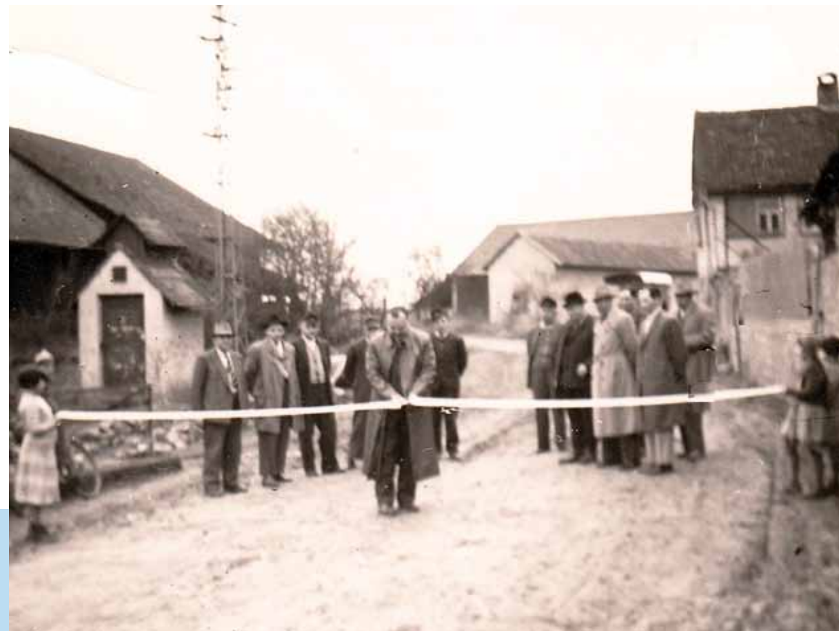
1960: Freigabe der sanierten Dorfstraße an der Weth

Fotografien aus den 1950er Jahren dokumentieren dörfliches Festleben, das sich weitgehend im Freien abspielte.