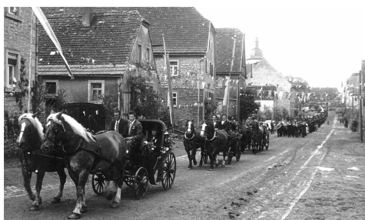
Festzug zur Feier des Jubiläums „70 Jahre Freiwillige Feuerwehr Herchsheim“

Gefeiert wurde bis in den Montag Nachmittag mit einem Kinderfest, was seinerzeit üblich war. Heute noch findet alljährlich auf der Dorfstraße im Oktober der Spinnrädlesmarkt statt.