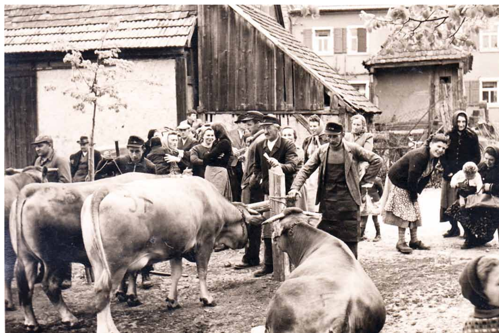
Mai 1955, Tierschau des Tierzuchtverbandes Herchsheim

Ein wesentlicher landwirtschaftlicher Aspekt im Ochsenfurter Gau der 1950er bis 70er Jahre war die Zucht von fränkischem Gelbvieh. Herchsheim konnte sich hier auszeichnen, unter anderem mit einem zweiten Preis auf der 45. Wanderausstellung der Deutschen Landwirtschaft 1959 in Frankfurt am Main. Zwei Jahre später besuchten 42 internationale Tierzuchtexperten das Dorf bei einer Studienfahrt durch Bayern, wo auch Vieh aus den umliegenden Ortschaften begutachtet wurde.