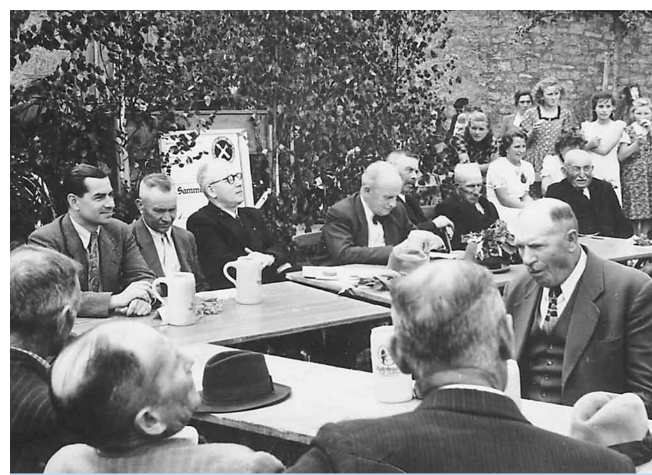
Feier im Freien: Das Darlehens-Vereinsfest im Jahr 1950

Das 50. Jubiläum des Spar- und Darlehenskassenvereins am 27. Juni 1950 macht den Anfang. Ein Festzug mit geschmückten Wagen, Reitern, Radfahrern und der Kapelle Geroldshausen leitete die Veranstaltung mit den Festrednern ein. Schließlich konnte noch ein Gründungsmitglied des Vereins mit einer Ehrenurkunde ausgezeichnet werden.