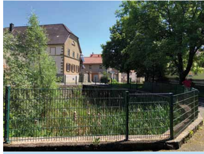
Weth an der Dorfstraße in Herchsheim

Herchsheim, Euerhausen und Allersheim sind drei typische Vertreter wohlhabender Bauerndörfer in den fruchtbaren Feldern des Ochsenfurter Gaus.