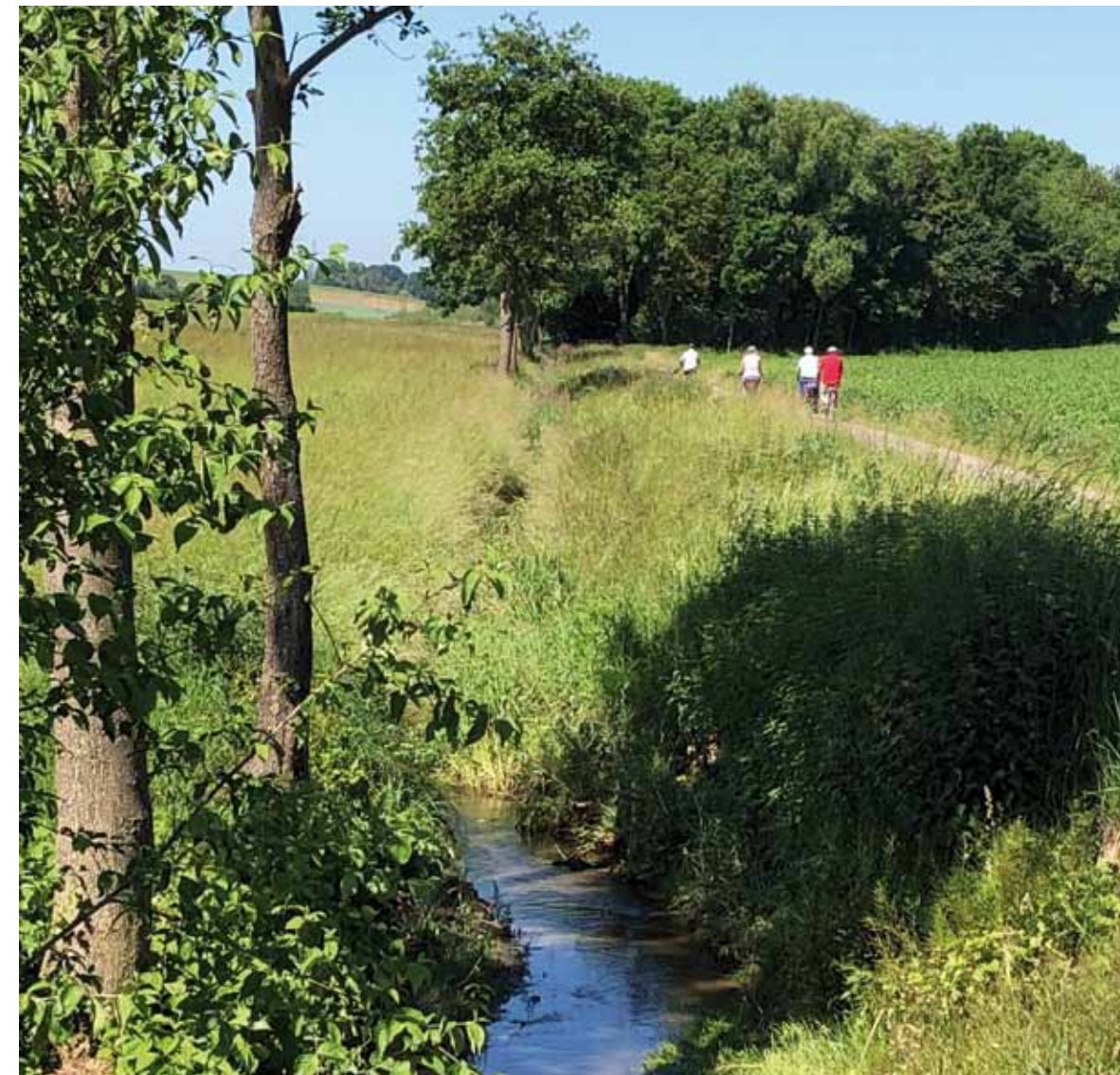
Unterwegs im Seebachtal

So haben wir vor der Säkularisierung 1803 eine Vielzahl von Lehensherren vor uns, die sich der Steuereinnahmen aus dem Ochsenfurter Gau sicher sein konnten.