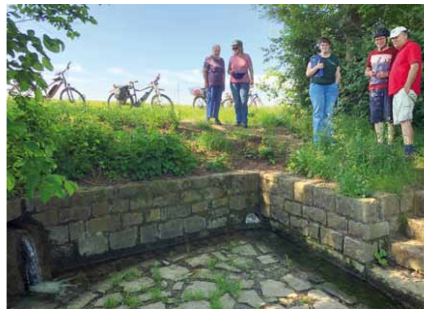
Pause an der Flachsbachquelle

Daraus entwickelte sich ein funktionierendes Miteinander – auch des religiösen Lebens.