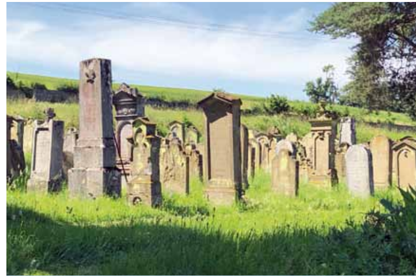
Am jüdischen Friedhof von Allersheim