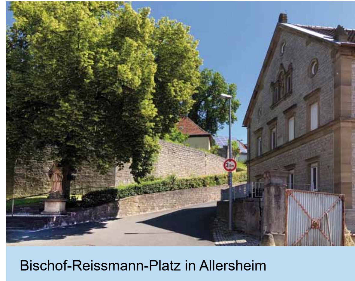
Bischof-Reissmann-Platz in Allersheim

Bis ins 19. Jh. versuchte nahezu jeder Fürst, ob geistlich oder weltlich, jedes Kloster oder Stift und jede Adelsfamilie, ob katholisch oder evangelisch, vom Reichtum des ergiebigen Ackerbaus zu profitieren.