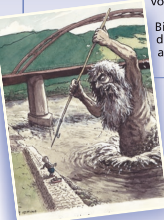
Der »Hakemoß«, gezeichnet von Achim Greser (Greser & Lenz)