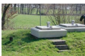
Am Mainufer befinden sich die Trinkwasserbrunnen.

Im Wasserwerk speisen die Reinwasserpumpen das Netz mit dem aufbereiteten Trinkwasser.