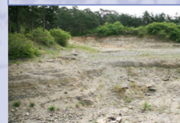
Von der Infotafel ist es noch ein Abstecher von 100 m in den Steinbruch.

Wir befinden uns mit ca. 340 m Höhe im Steinbruch Frohnberg an der höchsten Stelle des Kulturwanderwegs, der – geologisch gesehen – durch den Oberen Buntsandstein und den Unteren Muschelkalk (Ansbach-Waldzell) führt. Der Buntsandstein endet unterhalb von hier an der Kreisstraße am Ortsausgang von Ansbach in Richtung Waldzell. Der Flurname heißt dort bezeichnenderweise »Röte« und kommt vom rötlich eingefärbten Tonboden, der letzten Schicht des Buntsandsteins. Die Grenzschicht zum Muschelkalk wird Grenzgelbkalk genannt; es sind die markanten gelben Steine, die auf den Äckern entlang des Kulturweges in Richtung Waldzell zu finden sind. Im Steinbruch sind viele Versteinerungen versteckt, vor allem Muscheln sowie die Steinkerne von Schnecken.