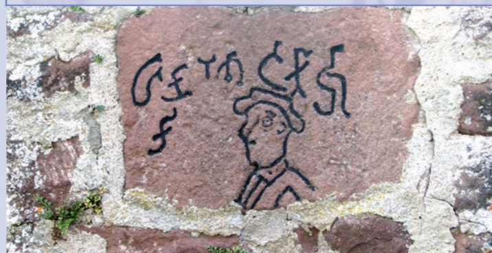
An der unteren Kirchenmauer wurde nachträglich ein Stein mit einer rätselhaften Gravur angebracht, deren Inhalt sich bis heute nicht deuten lässt.

Ansbach wurde 1297 erstmals urkundlich erwähnt. Über die Jahrhunderte herrschten viele verschiedene Herren über das Dorf. Neben dem Kloster Neustadt (auf das der Klosterhof unterhalb der Kirche zurückgeht) das Hochstift Würzburg, das Fürstentum Löwenstein-Wertheim-Rosenberg, das Großherzogtum Baden und ab 1819 Bayern. Die politische Gemeinde Ansbach war bis 1976 selbständig, dann schloss sie sich im Rahmen der Gemeindegebietsreform mit der Nachbargemeinde Roden zusammen. Das Gebäude der katholischen Kirche in Ansbach entstand im 14. Jahrhundert. In der Zeit Julius Eichters 1573–1617 wurde die Kirche umgebaut, der Turm danach im 18. Jahrhundert.