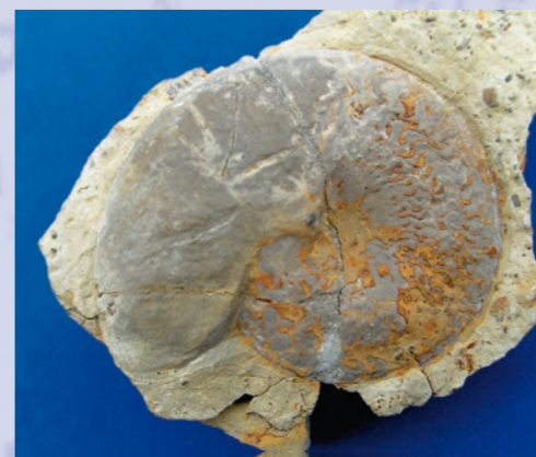
Schnecke Beneckeia buchi aus Ansbach (Größe 48 mm)

Eine Inschriftentafel an der Rückseite der Kirche in Waldzell erzählt von Bischof Julius Echter von Würzburg, der den Bau neu errichten ließ.