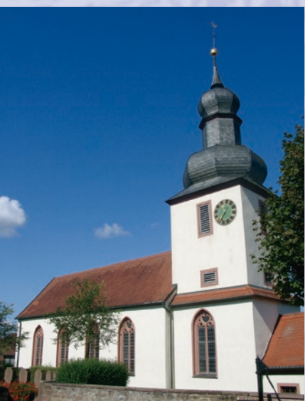
Die Kirche in Ansbach

Schauen Sie einmal in die Kirche: Im Altarraum zeigt eine Uhr an der linken Wand die Zeit an, die über ein mechanisches Getriebe mit der Turmuhr verbunden ist.