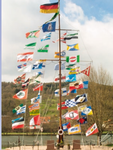
Der Erlacher Schiffermast

Über Wiesen und Felder, durch den Wald und entlang des Mains führt die Route durch das vom Kloster Neustadt erschlossene Siedlungsland im Waldsassengau entlang der ältesten Verbindung dieser Kulturlandschaft, dem Gertraudenpfad.