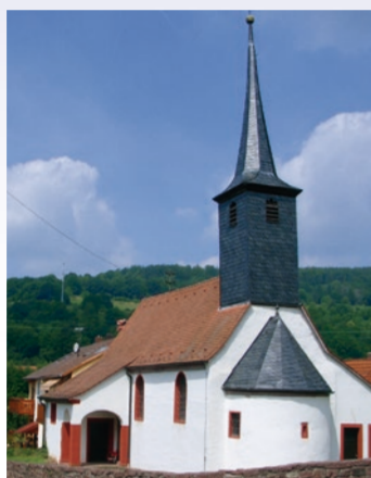
Der Kulturweg schließt mit der Erlacher Johanneskirche und dem Bildstock im Kirchhof ab.