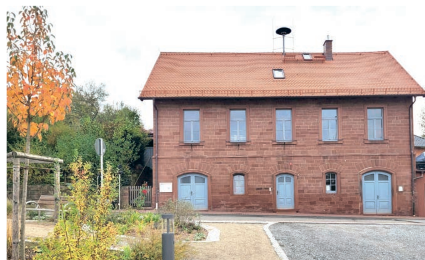
Die 1887 errichtete alte Schule von Kredenbach

Von 1840 bis 1900 blieb die Bevölkerungszahl von Kredenbach mit ca. 150 Einwohnern konstant. Die Kinder mussten zunächst die Schule in Altfeld und später in Michelrieth besuchen.