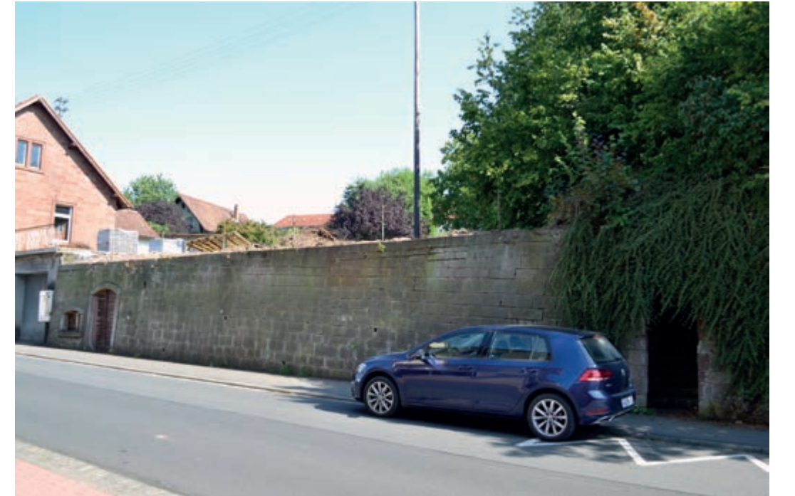
Foto der Mauer von 2019, heute mit Durchbruch

1836–1845 wurde in Marktheidenfeld die Mainbrücke gebaut. Hierdurch änderte sich in Kredenbach die Hauptverkehrsführung. Während über Jahrhunderte hinweg die Straße Richtung Würzburg den Berg hoch über Altfeld führte, wurde infolge des Brückenbaus die Straße nach Marktheidenfeld zur Hauptverkehrsverbindung Richtung Würzburg. Die heutige Dorfstraße wurde deshalb verbreitert und bergseits mit einer mächtigen Mauer gesichert, die ursprünglich ohne Unterbrechung von der Michelriether Straße bis zur heutigen Birkenstraße führte. Durch Neubauten ist die Mauer heute im Westen eingekürzt und an mehreren Stellen unterbrochen.