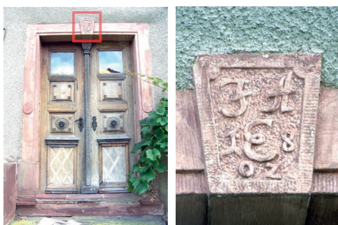
Die Eingangstür und die Inschrift von 1802