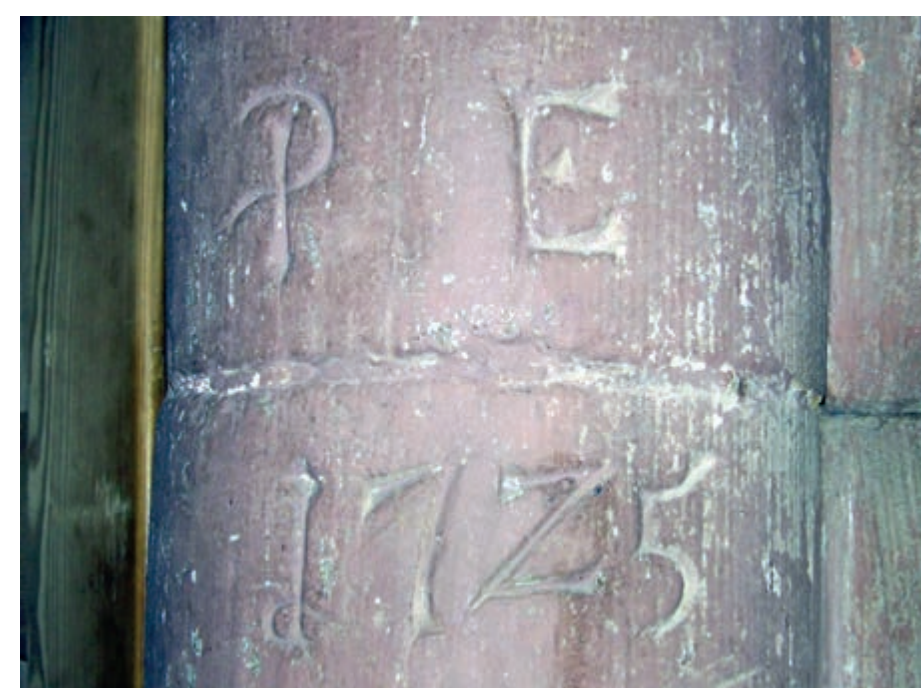
Inscription von 1725 in der ehemaligen Zollstation

Ab Esselbach/Kredenbach mussten die Grafen von Wertheim Reisenden und Händlern bis zur Hettstadter Steige auch das Geleit sichern. Bereits 1564 wurde im Kredenbacher Zollhaus der erste Wirt erwähnt. Das Gebäude der Zollstation und des Gasthauses „Zum Grünen Baum“ ist heute noch erhalten. Nach einer Inschrift an der steinernen Wendeltreppe im Inneren des Gebäudes wurde es 1725 von Peter Endres erbaut.