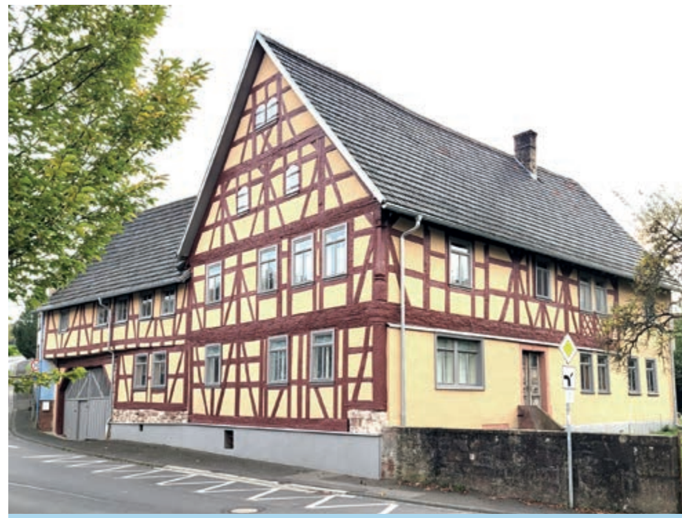
Die alte Zollstation mit freigelegtem Fachwerk

Kredenbach gehörte spätestens seit dem 14. Jh. zur Grafschaft Wertheim. Es grenzt unmittelbar an Esselbach, dessen Grundherr das Hochstift Würzburg war. 1363 verlieh Kaiser Karl IV. dem Grafen Eberhardt von Wertheim das Recht, in Kredenbach einen Viehzoll auf der Fernstraße und späteren Poststraße von Würzburg nach Frankfurt zu erheben, das bis ins frühe 19. Jh. ausgeübt wurde.