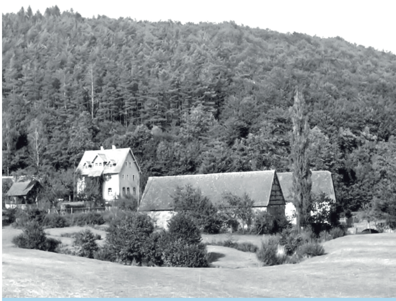
Die Neue Wachenmühle um 1940

Ärgerlich sagte sie: „Zum Donnerwetter, noch mal eine, habe doch schon zwei herausgefischt.“