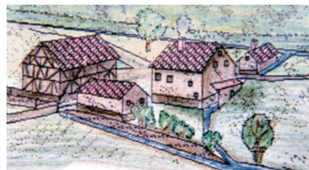
Zeichnung der Peters- oder Brunnclausenmühle