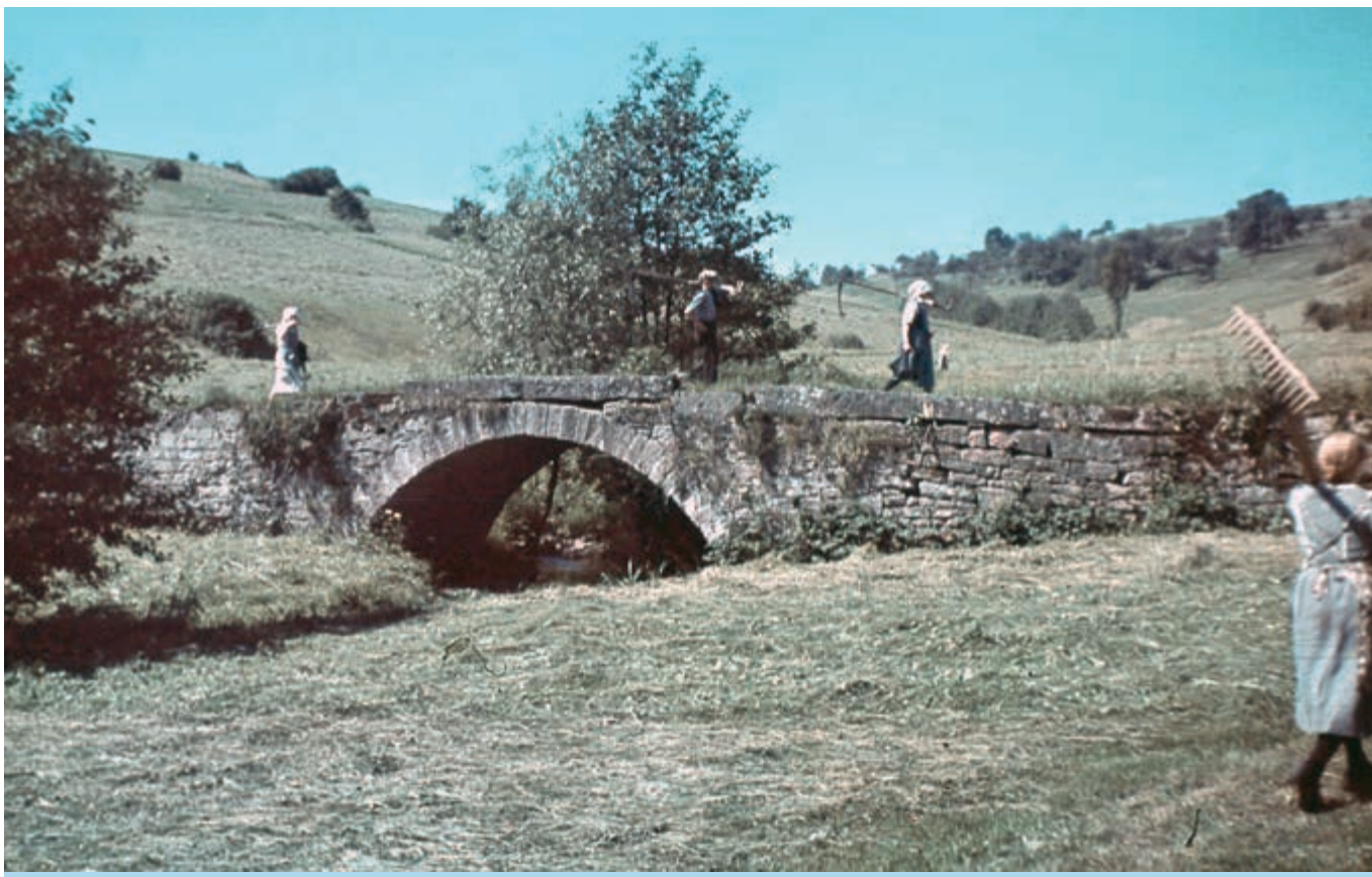
Die Salzbachbrücke beim Heumachen um 1942 mit Blick talaufwärts Richtung Eselbach

An der Salzbachbrücke treffen die Gemarkungen von Kredenbach, Eselbach und Steinmark zusammen, die durch den Eselbach und den Steinmarker Bach abgegrenzt sind. Die beiden Bäche werden nach ihrem Zusammenfluss zum Wachenbach, im Volksmund bis zur Heinrichsmühle „Salzbach“ genannt.