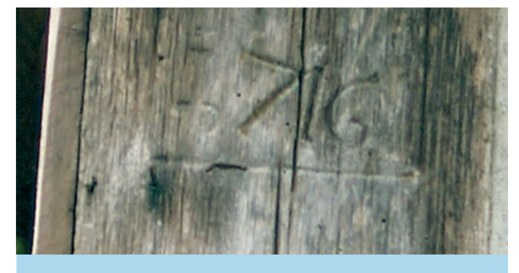
Der mit der Jahreszahl 1716 gekennzeichnete Balken der abgetragenen Petersmühle ist in Kredenbach erhalten geblieben.