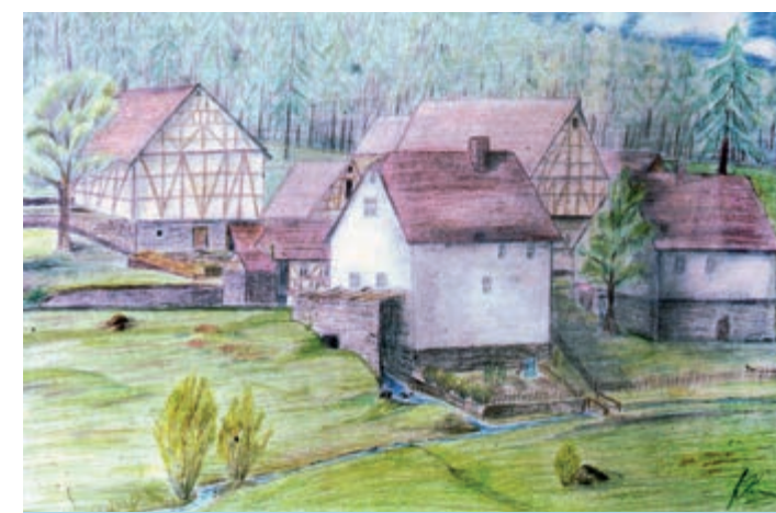
Zeichnung der Kieseckersmühle um 1920