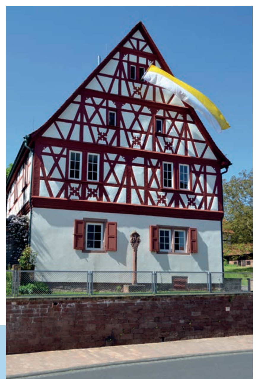
Das EsSELbacher Pfarrhaus wurde 1617 zur Zeit der Gegenreformation erbaut.

Der Pfarrhof hatte nicht allein administrativen Charakter für die Pfarreführung, sondern diente auch der wirtschaftlichen Absicherung der Pfarrer. Das Anwesen mit der ehemaligen Zehntscheune von 1845, dem Bruchsteinbau des Pfarrheimes und dem Ziehbrunnen von 1857 wird beherrscht vom Fachwerkbau des Pfarrhauses. Das Gebäude wurde 1617 im Auftrag des damaligen Patronatsherren Philipp-Christoph Echter von Mespelbrunn errichtet, der Neffe des Würzburger Fürstbischofs Julius Echter war. Der Bildstock vor dem Pfarrhaus zeigt in barocken Formen die Kreuzigungsgruppe.