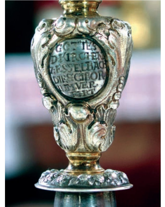
GOTTES D. KIRCHEN Z. ESSELBACH DIES CIBORIUM VEREHRT