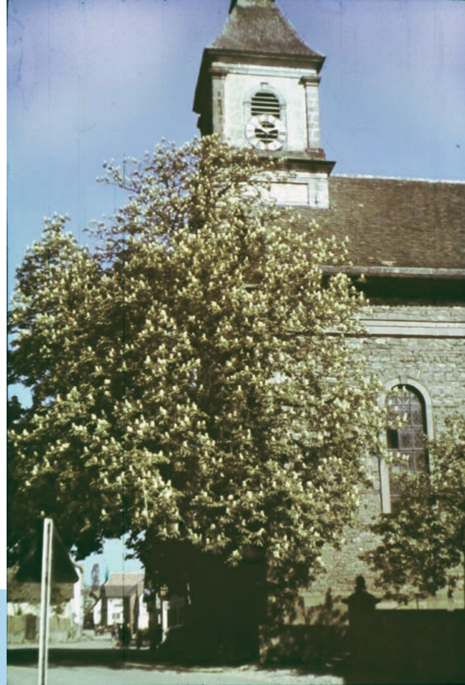
Bis in die 1950er Jahre standen vor der EsSELbacher Kirche zwei große Kastanienbäume.

1821 wurde die bisher zum Erzbistum Mainz gehörige Pfarrei EsSELBACH dem Bistum Würzburg zugewiesen. Heute ist EsSELBACH Sitz einer Pfarreiengemeinschaft, zu der Oberndorf und Bischbrunn sowie die Katholiken der überwiegend evangelischen Orte Altfeld, Eichenfürst, Glasofen, Kredenbach, Michelrieth und Steinmark gehören.