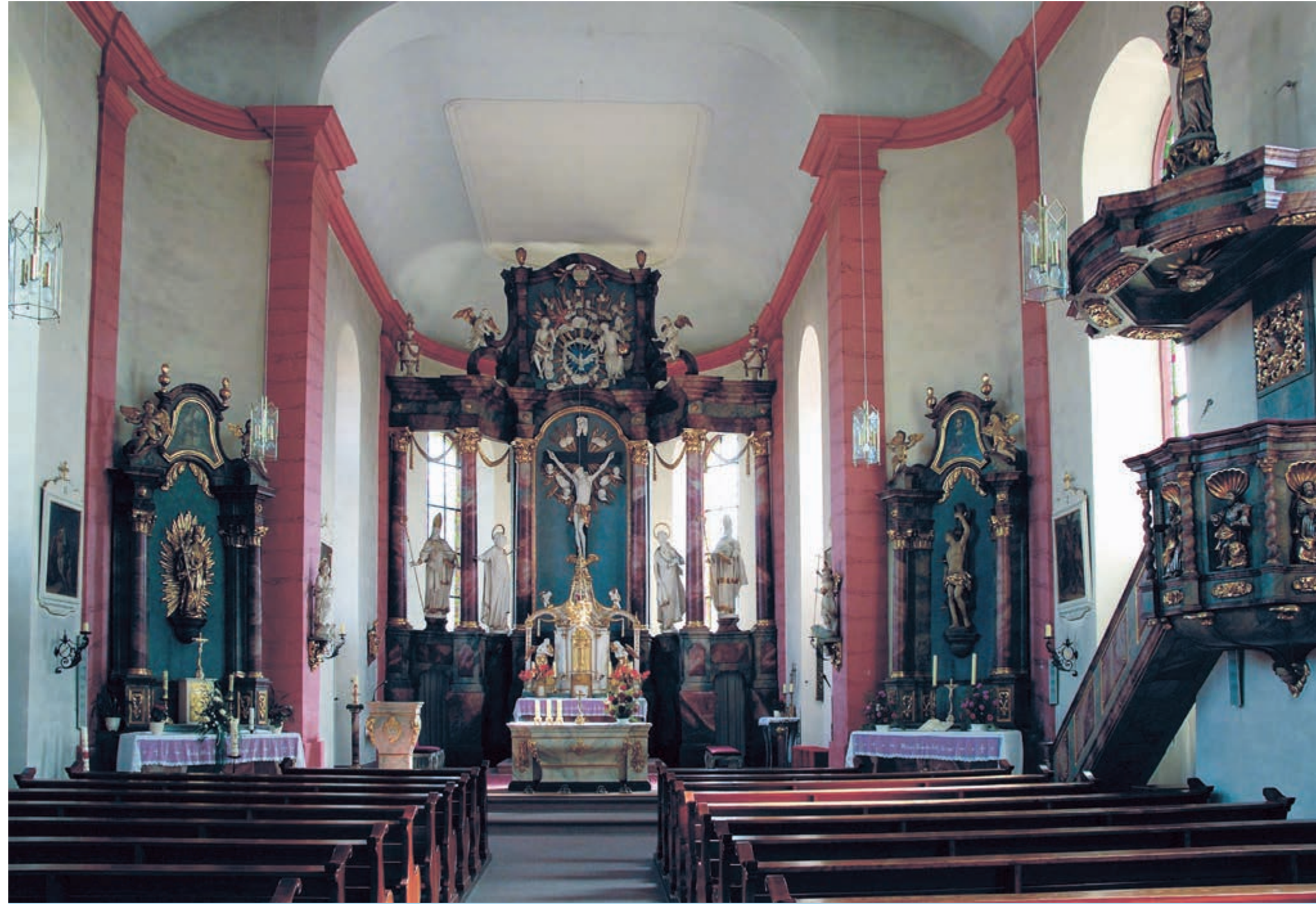
Das Kircheninnere von St. Margaretha