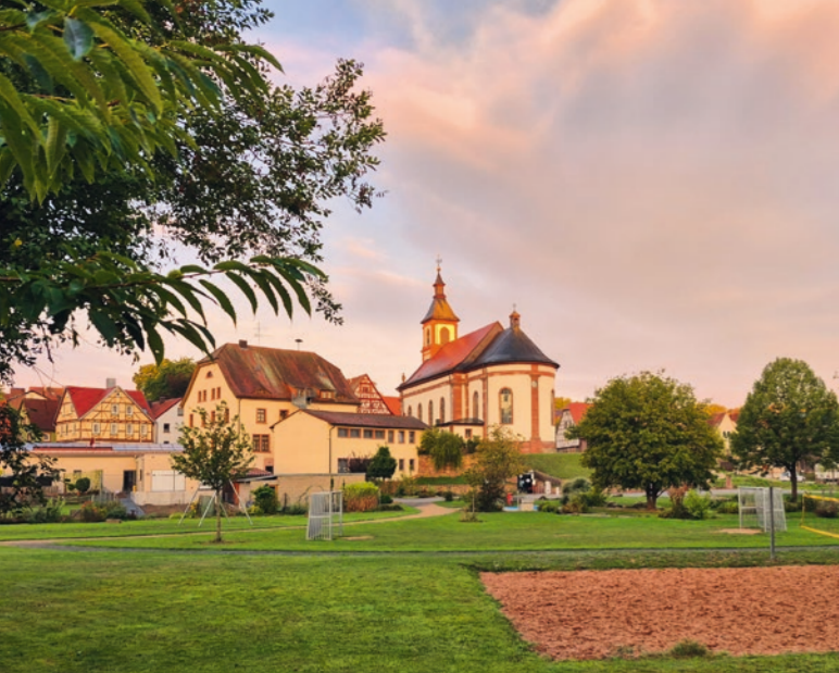
Kirche und Freizeitanlage Weed

An den historischen Grenzen von Kurfürstentum Mainz, Hochstift Würzburg und Grafschaft Wertheim erzählt der Kulturweg von den Herren von Espelbach, der »Alten Poststraße«, dem »Bauern-Astronomen«, der Reformation und von einer Zollstation.