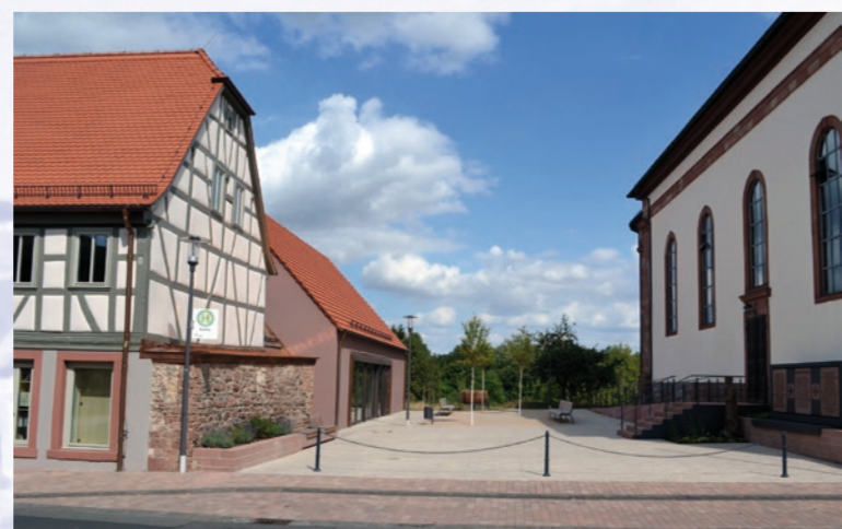
Der 2021 angelegte Dorfplatz mit dem Dorfgemeinschaftshaus (links)

Das Gasthaus »Zum Lamm« hatte den besten Standort direkt neben der Kirche und existierte bis 1980. Die Gemeinde erwarb 1987 das Anwesen. Ab 2018 wurde das ehemalige Gasthaus saniert und in das neue Dorfgemeinschaftshaus integriert. Hierbei wurde das Dach mitsamt Dachstuhl in seine ursprüngliche Form zurückgeführt und das Fachwerk freigelegt. Mit dem Bau des Dorfgemeinschaftshauses wurde erstmals ein Dorfplatz angelegt.