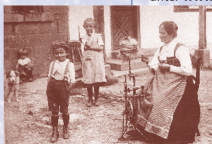
Das sicherlich schönste Foto der Serie von 1920/22 zeigt den Vorgang des Spinnens. Hier wird aus der Faser ein durchgehender Faden erzeugt.