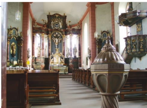
Blick in das Innere der Esselbacher Pfarrkirche