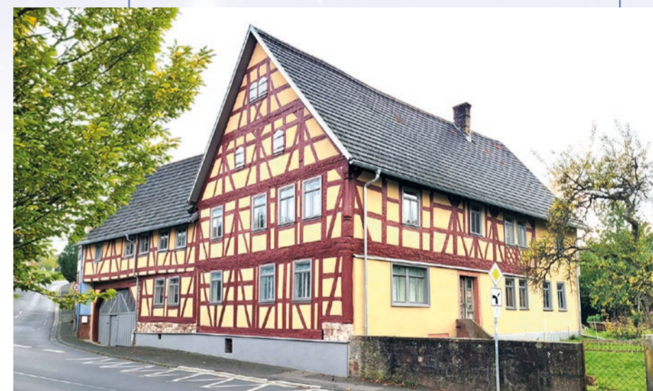
Die ehemalige Zollstation Kredenbach

Die älteste bekannte Erwähnung Kredenbachs findet sich 1330 als »Kretembach«, zugehörig zur Grafschaft Wertheim. Kredenbach grenzt unmittelbar an Esselbach, das Teil des Hochstifts Würzburg war. Seit 1363 wurde hier bis ins frühe 19. Jh. Zoll auf der Fernstraße und späteren Poststraße von Würzburg nach Frankfurt erhoben. Das Gebäude der Zollstation und des Gasthauses »Zum Grünen Baum« ist erhalten geblieben. 1836-1845 wurde in Marktheidenfeld die Mainbrücke gebaut und in Kredenbach wurde in der Folge der Hauptverkehrsweg umgelenkt.