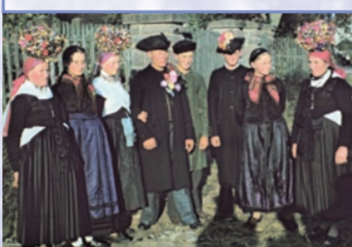
Die sieben protestantischen Orte Michelrieth, Altfeld, Steinmark, Oberwittbach, Eichenfürst, Kredenbach und Glasofen im Südosspessart unterscheiden sich nicht nur durch den Glauben von ihrer Umgebung, auch ihre Tracht setzte eigene Akzente.

Steinmark, 1298 erstmals schriftlich erwähnt, gehörte wahrscheinlich seit seiner Gründung zur Pfarrei Esselbach. Steinmarker hatten eine enge Verbindung zu den benachbarten Dörfern Esselbach, Oberndorf und Bischbrunn. Selbst mit der um 1540 in der Grafschaft Wertheim eingeführten Reformation blieb Steinmark beim katholischen Glauben. Erst 1617/18 wurden die Steinmarker durch den Druck des Landesherrn evangelisch. Seitdem gingen sie bis nach Michelrieth (ca. 5 km) in die Kirche. Erst seit 1953 verfügt Steinmark über ein eigenes Kirchengebäude.