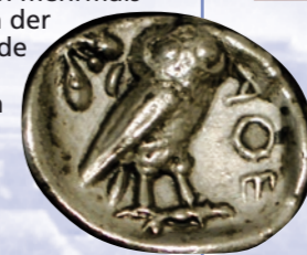
Die Poststraße und ihre Vorgängerroute wurden seit Jahrtausenden begangen, wie eine hier gefundene Athener Drachme aus dem 5. Jh. v. Chr. zeigt.