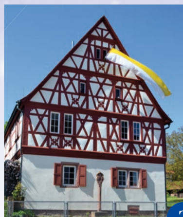
Das Pfarrhaus – ein prachtvoller Fachwerkbau von 1617