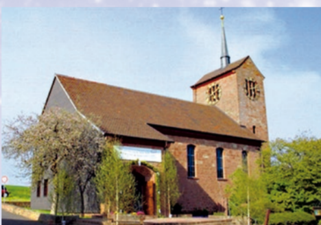
Die evangelische Steinmarker Kirche wurde 1953 erbaut.