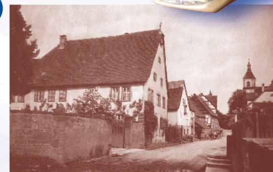
Gegenüber der Kulturwegtafel steht das Gebäude der ehemaligen Posthalterei.

Als 1615 die Thurn-und Taxis'sche Postroute Brüssel-Köln-Frankfurt-Würzburg-Nürnberg-Prag eingerichtet wurde, entstand auch die Esselbacher Poststation. Während die Poststraße zunächst nur für Reiterkuriere gebaut wurde, konnte sie ab 1690 im regelmäßigen Postverkehr auch mit Kutschen befahren werden. In Esselbach steht das älteste noch erhaltene Postgebäude Unterfrankens, das Mitte des 17. Jh. neu errichtet wurde. Die Posthalterei war 300 Jahre lang in Familienbesitz. Da sie auch über die Töchter weitervererbt wurde, änderte sich mehrmals der Familienname. Ihre Mitglieder spielten in der Esselbacher Ortsgeschichte eine herausragende Rolle und traten vielfach als Wohltäter der Pfarrgemeinde auf. Im späten 18. und frühen 19. Jh. erlebte die Posthalterei ihre Blütezeit. Mit dem Aufkommen der Eisenbahn und später des PKW-Verkehrs verlor sie Ende des 19. Jh. ihre Bedeutung.