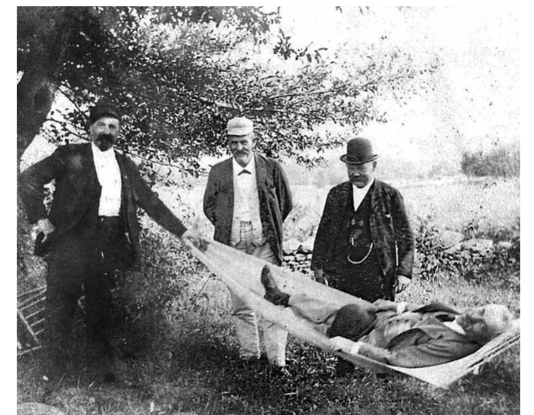
Ausruhen im Garten nach dem Frühschoppen - ein seltener Schnappschuss.

Der ganze Stolz der Gasthausbesitzer war die Eismaschine, mit der am