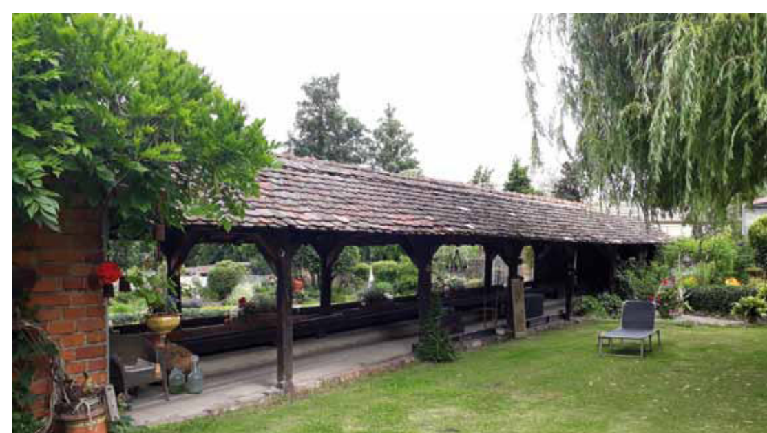
Die historische Kegelbahn entstand 1878 oberhalb des Bierkellers und wurde um 1900 in den Hof des Gasthauses verlegt.