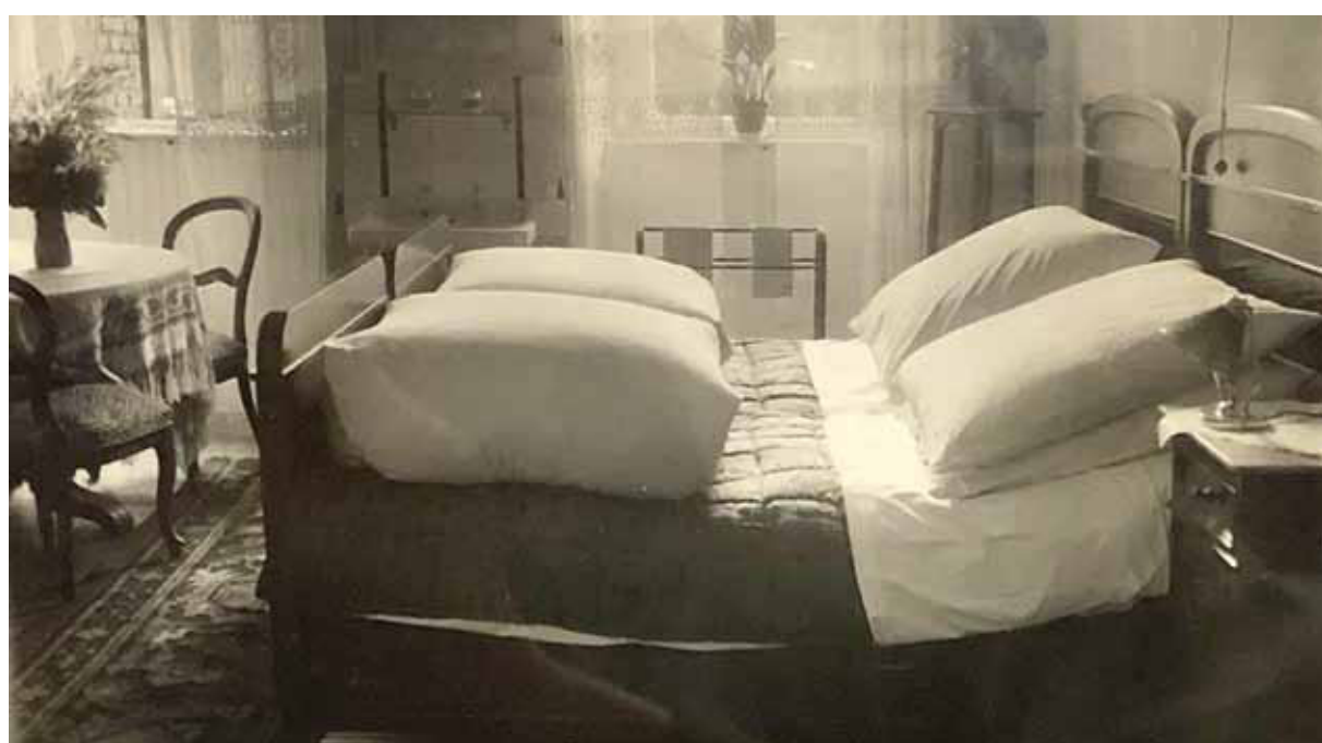
Doppelzimmer mit Federbetten

Bis zu Kriegsbeginn 1939 kamen Feriengäste aus dem Ruhrgebiet, während des Zweiten Weltkrieges pachteten die Nationalsozialisten das Gasthaus als Kinderlandverschickungsheim. Nach dem Krieg kamen viele Vertreter, Fernfahrer und Firmenrepräsentanten. Im Sommer erfreuten sich die Gäste am großzügigen Garten und der überdachten Kegelbahn.