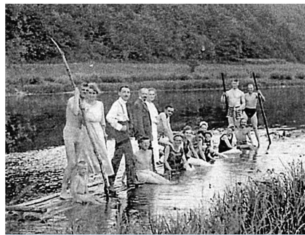
Wenn es an Wasserfahrzeugen mangelte, bauten sich die Gäste eben selbst ein Floß (Sommer 1920).