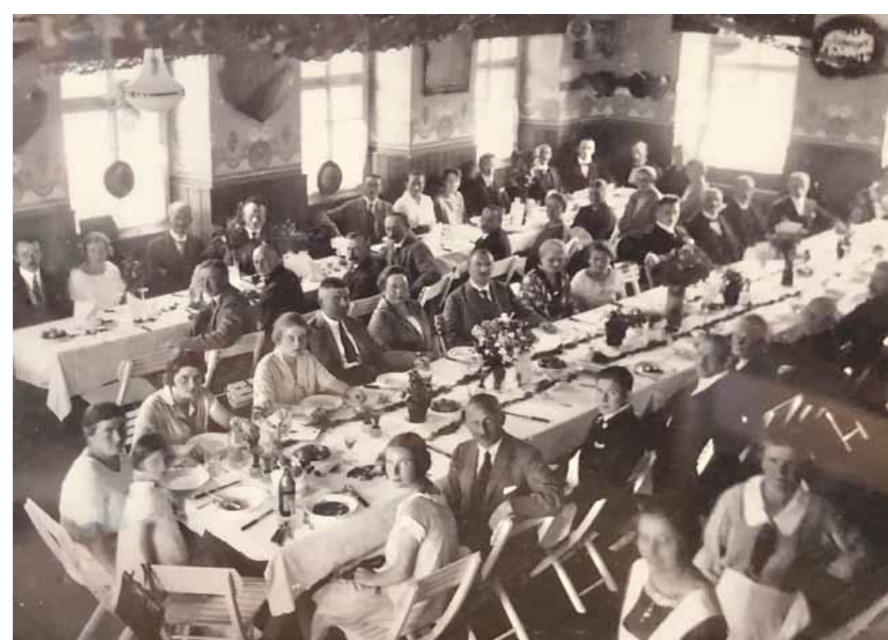
Saal im ersten Stock 1929 mit einer Festgesellschaft

Der Gasthof Hofmann wurde 1974 geschlossen. Die 23 Zimmer, der Speise- und der Tanzsaal wurden in vier Wohnungen umgebaut. Im Erdgeschoss verblieben die zwei Gasträume, die Ausschank sowie die Küche weitgehend im Originalzustand. Wegen baurechtlicher Vorschriften ist ein weiterer Betrieb als Gastwirtschaft ausgeschlossen.