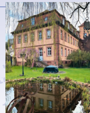
Blick vom Garten auf das Anwesen