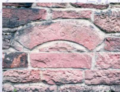
Die älteste Jahreszahl an einem Haus in Kleinwernfeld stammt von 1568.

Der Kilometerstein stand ursprünglich zwischen Burgsinn und Gemünden. Er wurde vor der Zerstörung gerettet und hier aufgestellt.