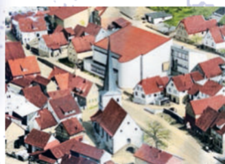
Die beiden Wernfelder Kirchen – der Neubau von 1969 ohne Turm

Der Kilometerstein stand ursprünglich zwischen Burgsinn und Gemünden. Er wurde vor der Zerstörung gerettet und hier aufgestellt.