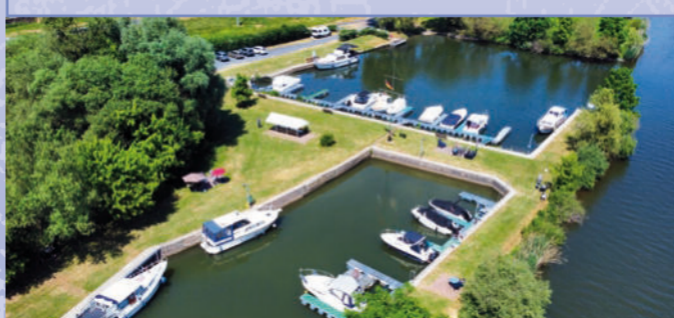
Der Yachtclub Wernfeld hat seinen Sitz in Kleinwernfeld.

Aus dem Jahre 1349 stammt die erste urkundliche Erwähnung von Kleinwernfeld. 1383 wurde zum ersten Mal zwischen Groß- und Klein Wernfeld unterschieden. 1818 entstand aus Wernfeld und Kleinwernfeld die politische Gemeinde Wernfeld. Damals waren die meisten Einwohner Landwirte, Korbflechter und Besenbinder.