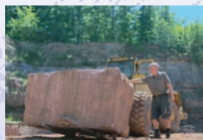
Abtransport und Sprengung eines Buntsandsteinquaders