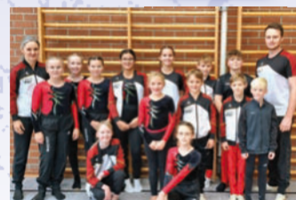
Auch 2025 ist der Wernfelder Turn-Nachwuchs aktiv dabei.