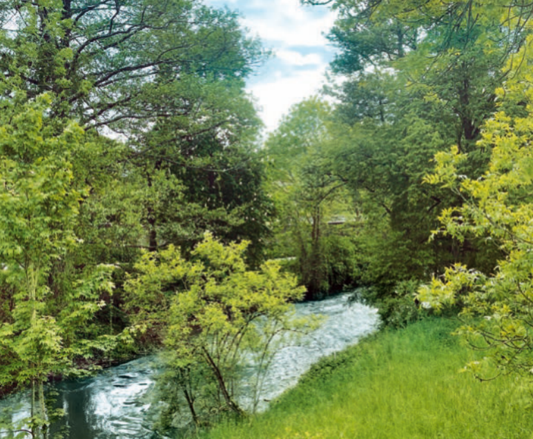
Nach 70 km mündet die Wern hier in Wernfeld in den Main