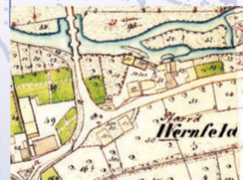
Wernbrücke und Wolzmühle auf dem Urkataster von 1844