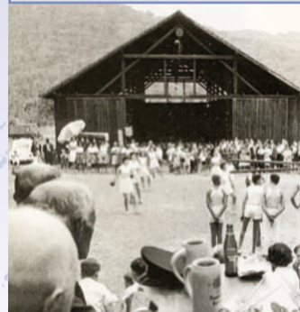
Am Dorfplatz feierte die Turnabteilung des TSV Wernfeld früher ihre Feste.

Der Kulturweg hat zwei Schwerpunkte: Die Dorfrunde über 2 km bringt Ihnen anhand von fünf Stationen die Ortsgeschichte näher. Darüber hinaus können Sie von der Fußgängerbrücke weit in die Landschaft entlang des Mains blicken und einen Abstecher nach Kleinwernfeld machen. Die Seerosenschleife führt über 6 km durch die Wernfelder Kulturlandschaft. Es sind etwa 150 Höhenmeter zu überwinden. Folgen Sie der Markierung des gelben EU-Schiffchens auf blauem Grund.