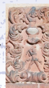
Über dem Eingangsportal ist das Wappen des Hausbauers Holzmann zu sehen.