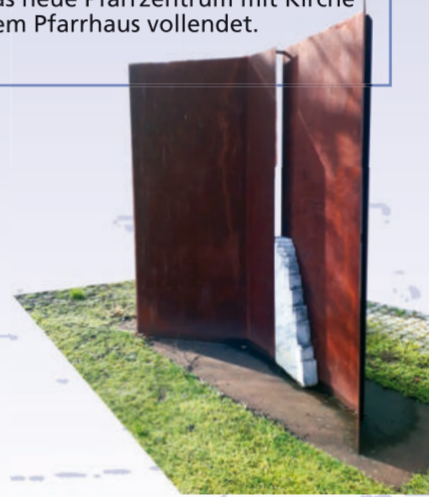
Von dem Wernfelder Künstler Rainer Kuhn stammt die abstrakte Plastik, die 2005 aus Anlass der Verleihung der Denkmalschutzmedaille für die alte Kirche aufgestellt wurde.