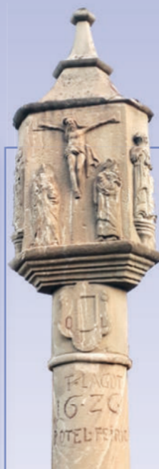
Bildstock von 1626 gegenüber der alten Kirche Mariä Himmelfahrt (unten)