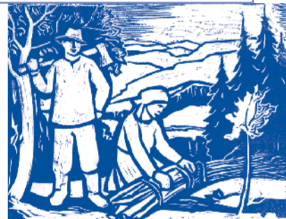
Die »Hawischer Wellekipper« auf einem Holzschnitt von Alois Bergmann-Franken (1954)