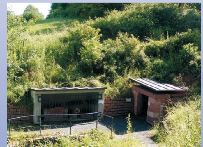
Das Ensemble der Brunnenstube ist der zweite archäologische Höhepunkt in Haibach.

Mit der Freilegung und Renovierung der in der Regierungszeit Kardinal Albrecht von Brandenburg errichteten Brunnenstube verfügt Haibach über eines der bedeutendsten Technikenkmäler der Region. Die hier beginnende Wasserleitung versorgte das Schloss in Aschaffenburg mit Wasser.