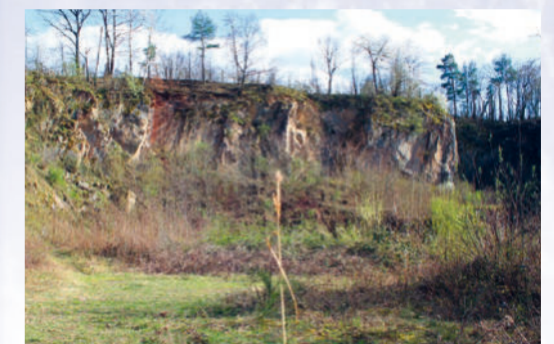
Die Steilwand des Steinbruchs Wendelberg