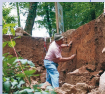
Die archäologischen Untersuchungen auf der Ketzelsburg waren nur möglich aufgrund des außerordentlichen Engagements vieler Helfer.

Historische und archäologische Forschungen ließen aus den Legenden der Vergangenheit ein realistisches Bild der Ketzelsburg entstehen. Umrunden Sie die hochmittelalterliche Anlage auf dem durchgehend erhaltenen Ringwall, in dessen Mitte auf dem Plateau einst ein mit Holzpalisaden geschützter Turm mit Steinfundament und Fachwerk stand. Die sechs Tafeln im archäologischen Park zeigen Rekonstruktionen von Burg und Umfeld um das Jahr 1160.