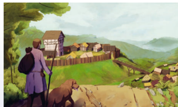
Einen hervorragenden Eindruck vom ursprünglichen Aussehen der Ketzelsburg vermitteln die Rekonstruktionszeichnungen (von Lisa Herdweck). Vor mehr als 800 Jahren stand auf dem damals unbewaldeten Burgberg eine weitgehend aus Holz errichtete Burg. Lange war von der Anlage nur noch der tiefe Ringgraben mit seinem vorgelagerten Wall sichtbar.