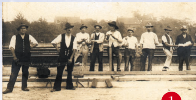
Haibacher Maurer auf Montage beim Eisenbahnbau im Jahr 1913