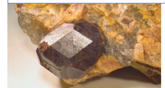
Spessartin, gefunden in Haibach

Der stillgelegte Steinbruch wurde zum Refugium für geschützte Pflanzen und Tiere. Der dort gebrochene »Haibacher Blaue« (= Biotitgneis) ist im Ort an vielen Gebäuden wiederzuerkennen. Darüber hinaus wurde hier das Mineral »Spessartin« gefunden. Es handelt sich dabei um eine Spielart des Halbedelsteins »Granat«.