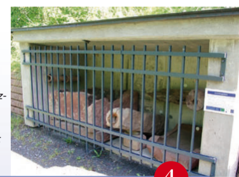
Tonrohre und ein Absetzbecken aus Buntsandstein können neben der Brunnenstube besichtigt werden.