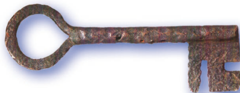
Der »Schlüssel von der Ketzelsburg« zeigt das bereits sehr früh erwachende Interesse für Geschichte in Haibach. Im Jahre 1840 wurde der Schlüssel angeblich am Ringwall gefunden und sogleich als ein Beleg für die Existenz der Burg des »Ritters von Heydebach« angesehen. Bei Untersuchungen im Rahmen der Erforschung der Ketzelsburg stellte sich heraus, dass die Korrosions Spuren auf dem Metall nicht auf jahrhundertlanges Liegen im Boden zurückgingen. Vielmehr sind sie Ergebnis eines mühevoll durchgeführten künstlichen Alterungsprozesses. Ein Fälscher hatte mit einem Stichel mühe- und liebevoll Hunderte von kleinen Löchern in den Schlüssel gepunzt.