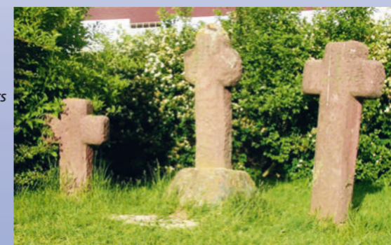
Die »Drei Kreuze« zwischen den Stationen 3 und 4 erinnern an die Legende des »Ritters von Heydebach«.