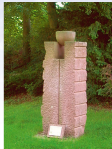
Die Skulptur »Geschwisterpaar« von Ingrid Hornef setzt die Geschichte(n) um die Ketzelsburg künstlerisch um. Sie steht am Beginn des Kulturweges.