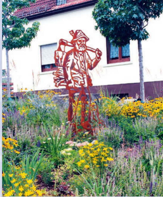
Seit 2024 erinnert eine Wellekipper-Skulptur an das Bündeln von Reisigwellen und das Kippen auf eine handliche Länge.

kl kleine Tafeln (Büchelberghaus, alte Poststraße, Drei Kreuze, Wellekipper)