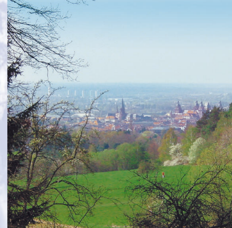
Von der Brunnenstube reicht der Blick bis an das Ziel der Wasserleitung im Schloss Johannisburg.