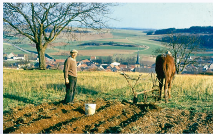
Landwirtschaft am Hommerich (1976)