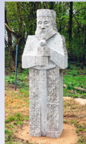
»Karl der Große« von Bernd Waack (2012)