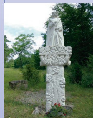
Die Schutzmantelmadonna steht neben der Bildeiche am Kulturweg.

Der Bruderkrieg zwischen Bayern und Preußen 1866 brachte Krankheiten wie die Cholera in die Region. Greußenheim blieb, im Gegensatz zu den umliegenden Gemeinden, von dieser Krankheit verschont. Damals gelobte die Gemeinde jährlich eine Wallfahrt nach Höchberg zur Kirche Maria Geburt. Aufgrund des immer stärker werdenden Verkehrs soll nach Aussagen von Zeitzeugen Anfang der 1960er Jahre die erste Wallfahrt nun zur Bildeiche geführt haben. Nicht weit davon liegt das Flurstück Fürstenküche. Es gibt keine gesicherten Erkenntnisse, aber man weiß, dass Greußenheimer für die Grafen von Wertheim Dienste als Jagdgehilfen ausüben mussten. Man vermutet, dass die Verköstigung der fürstlichen Jagdgesellschaft an diesem Platz stattfand und daher seit dieser Zeit den Namen »Fürstenküche« trägt.