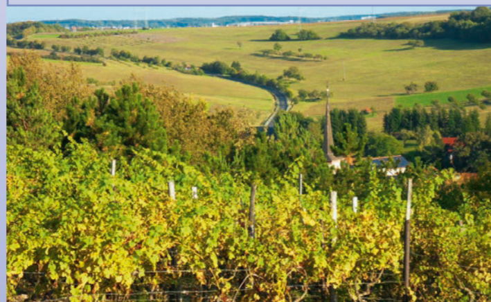
Der Blick vom Hommerich auf Greußenheim mit dem Weinberg (2011)

In ganz Franken und auch in Greußenheim war der Weinbau im Mittelalter und in der frühen Neuzeit weit verbreitet. Wein galt gegenüber Wasser als besser genießbares Getränk. Da das Klima bis in das 17. Jahrhundert wärmer war als heute, konnte eine große Menge produziert werden, allerdings weit weniger alkoholhaltig als heute. Nach dem Niedergang des Weinbaus wegen des Klimas und Anfang des 20. Jahrhunderts wegen der Reblaus ist heute die Weinlage am Hommerich der letzte verbliebene Weinberg in Greußenheim.