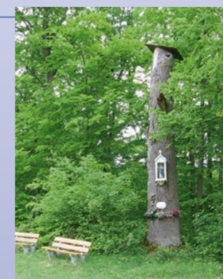
Die Bildeiche ist Ziel einer alljährlichen Prozession.