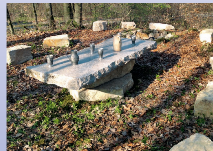
Die Fürstenküche erreicht man über einen Abstecher von 70 m bei der Bildeiche.