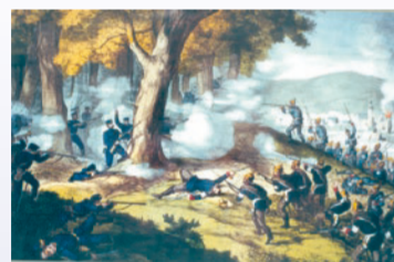
Zeitgenössische Abbildung der Kämpfe von 1866.

Auf der »Wilzi« kommt der Deutsche Enzian vor.