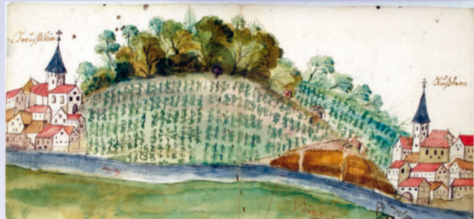
Die älteste bekannte Darstellung von Greußenheim (Kreussheim, rechts Roßbrunn als Rußbron) aus dem Jahr 1660.