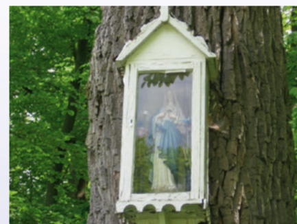
Holzkasten mit der Marienfigur an der Bildeiche