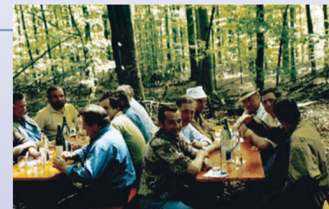
Feier der Feldgeschworenen am Mittagstisch

Jedes Jahr treffen sich die Feldgeschworenen von Unterleinach und Greußenheim zum Mahl am Mittagstisch an der Gemarkungsgrenze zwischen den beiden Gemeinden. In der frühen Neuzeit waren Grenzbeziehungen ohne die Feldgeschworenen nicht denkbar. Heute noch unterstützen sie das Vermessungsamt. Außerhalb Frankens gibt es sie jedoch beinahe nirgends mehr. Das Ehrenamt ist im 13. Jahrhundert in Franken entstanden. Dort erkannten die fränkischen Gerichte, dass vor Ort Ansprechpartner in den einzelnen Dörfern nötig waren, die sich mit den lokalen Gegebenheiten auskannten und die Grenzverläufe gewährleisten konnten. Aufgabe der Feldgerichte war es, in Grenzangelegenheiten Schiedsprüche zu fällen. So wurden die Feldgeschworenen zu Hütern der Grenzen und Abmarkungen.