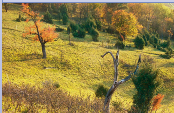
Herbstliche Stimmung auf der »Wilzi«

In der Auseinandersetzung zwischen Österreich und Preußen um die Vorherrschaft in Deutschland war auch Unterfranken Kriegsschauplatz. Die bayerische Armee als Verbündeter Österreichs und eine preußische Heeresabteilung, die sogenannte »Main-Armee«, lieferten sich auf dem Gebiet zwischen Uettingen, Greußenheim, Roßbrunn und Helmstadt ein letztes blutiges Gefecht. Rund 50.000 Soldaten waren hier am 26. Juli 1866 beteiligt. Wenn man den Westrand des Herchenbergs erreicht, öffnet sich der Wald und es bietet sich ein wunderschöner Blick auf das Tal zwischen Uettingen und Waldbrunn. Diese offene Fläche trägt den Eigennamen »Wilzi«, die vor allem ein Magerrasen mit dichten Wacholderbeständen, Schlehenbüschen und alten Kirschbäumen ist. Auch Enzian kommt hier vor.