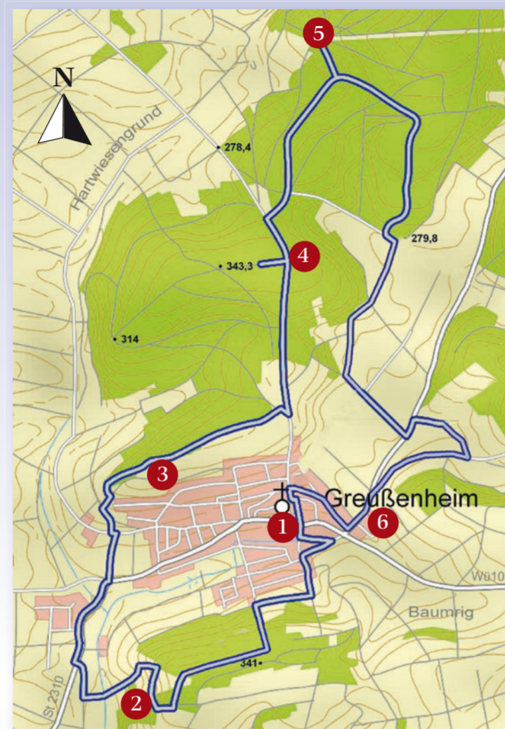
Weglänge 11 km, Start am Kirchplatz 4, 97259 Greußenheim