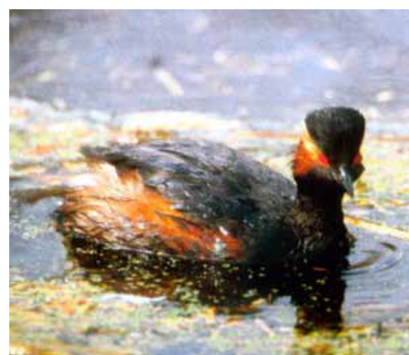
Wegen des Schwarzhalbstauers wurde 2005 das NSG „Ehemalige Tongrube von Mainhausen“ ausgewiesen.