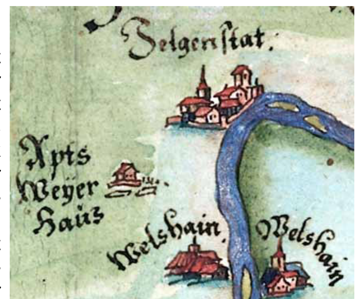
Am Rande der Spessartkarte des Nürnbergers Paul Pfinzing von 1562/94 ist die Klein-Welzheimer Wasserburg neben Selgenstat und Welshain (beiderseits des Mains) zu erkennen. Sie trägt den Namen Apts Weyer Haus, was vermuten lässt, dass sich das Gebäude bereits im 16. Jahrhundert im Besitz des Kloster Seligenstadt befand und von Wasser umgeben war.

Die Wasserburg ist heute in Privatbesitz und kann nicht besichtigt werden.