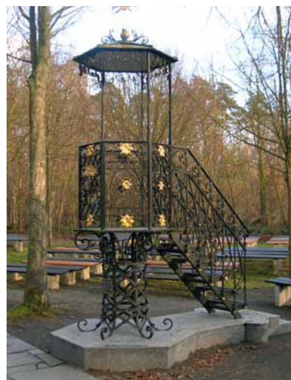
Bei der Wallfahrtskirche „Liebfrauenheide“ hielt Bischof Freiherr von Ketteler 1869 seine berühmte Rede über die katholische Arbeiterbewegung.