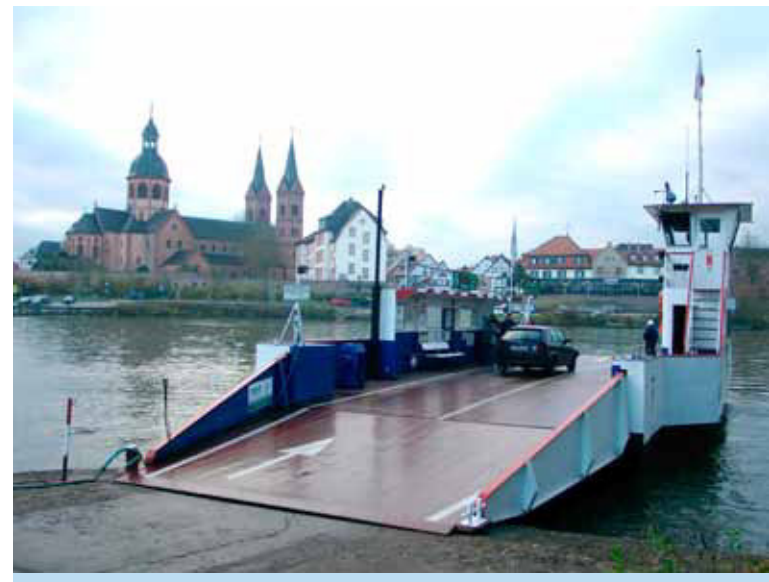
Die Seligenstädter Fähre verbindet Hessen mit Bayern.

Am Unterrhein erstreckt sich beiderseits des Mainufers ein Landstrich über die beiden Bundesländer Hessen und Bayern. Das war nicht immer so. Bis 1803 gehörten Seligenstadt und die Gemeinden mainaufwärts zum Erzstift Mainz, das damals ein eigenständiger Staat war. Sie verbindet eine gemeinsame Geschichte, die der Kulturradweg „Kurmainzer Herz“ aufgreift.