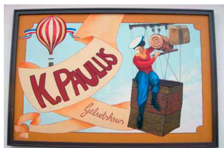
In Zellhausen befindet sich das Geburtshaus von Käthe Paulus, der deutschen der Luftfahrt-Pionierin.

Die 16 Stationen präsentieren die Geschichte der Landschaft am Main, die von der Natur über Jahrmillionen geformt wurde. Braunkohleflöze entstanden, Kiesbetten wurden abgelagert, Mainarme bildeten sich und verschwanden. Der Mensch hat in der vergleichsweise kurzen Epoche von mehreren Jahrtausenden diese Naturlandschaft umgestaltet in eine Kultur- und Industrielandschaft: von prähistorischen Hügelgräbern am Schachenbrunnen bis zur Braunkohlehalde „Kipp“.