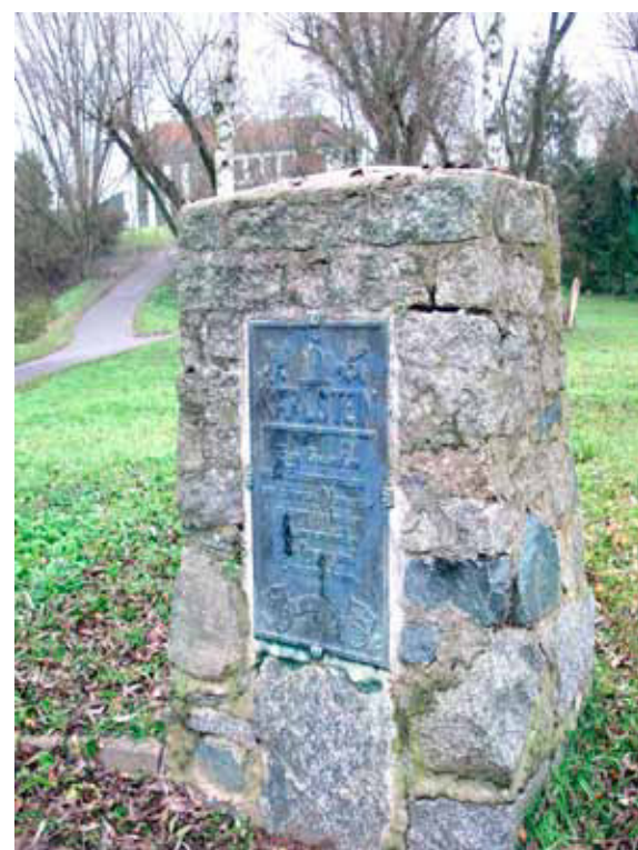
Das Denkmal „Karlstein“ markiert eine traditionsreiche ehemalige Gemarkungsgrenze.

Lassen Sie sich bei der Rundfahrt von der Vielfalt unserer Heimat überraschen.