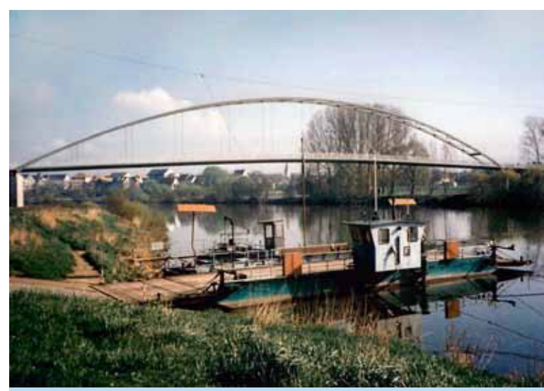
Über die Kilianusbrücke zwischen Dettingen und Mainflingen wird der Main ein zweites Mal überquert. Die Fährverbindung wurde mit dem Brückenbau eingestellt.