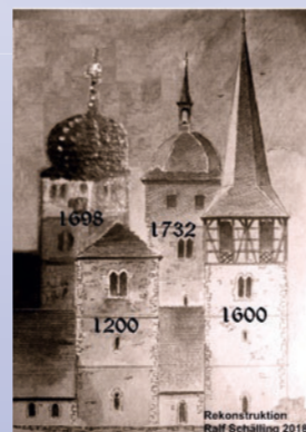
Der Schäftersheimer Kirchturm im Wandel der Zeit