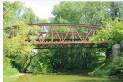
Von der Gaubahn verblieb die Brücke über die Tauber