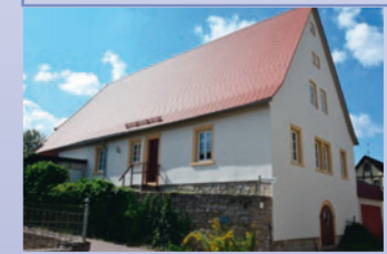
Das Rathaus befindet sich im Judenhof im sanierten ehemaligen Zehntamt.

Die Info-Tafel steht in der Mühlenstraße vor dem Rathaus, das früher das Zehntamt war, der Sitz des Würzburger Amtmanns. Das Areal mit den umliegenden Anwesen erhielt im 19. Jahrhundert den Namen Judenhof, weil hier viele jüdische Familien lebten. Zwei Mühlengebäude gibt es in der Mühlenstraße, von denen die Obere Mühle heute noch diese Funktion ausübt. Nicht weit von hier steht das Gasthaus »Krone«, das 1585 erstmals genannt wurde.