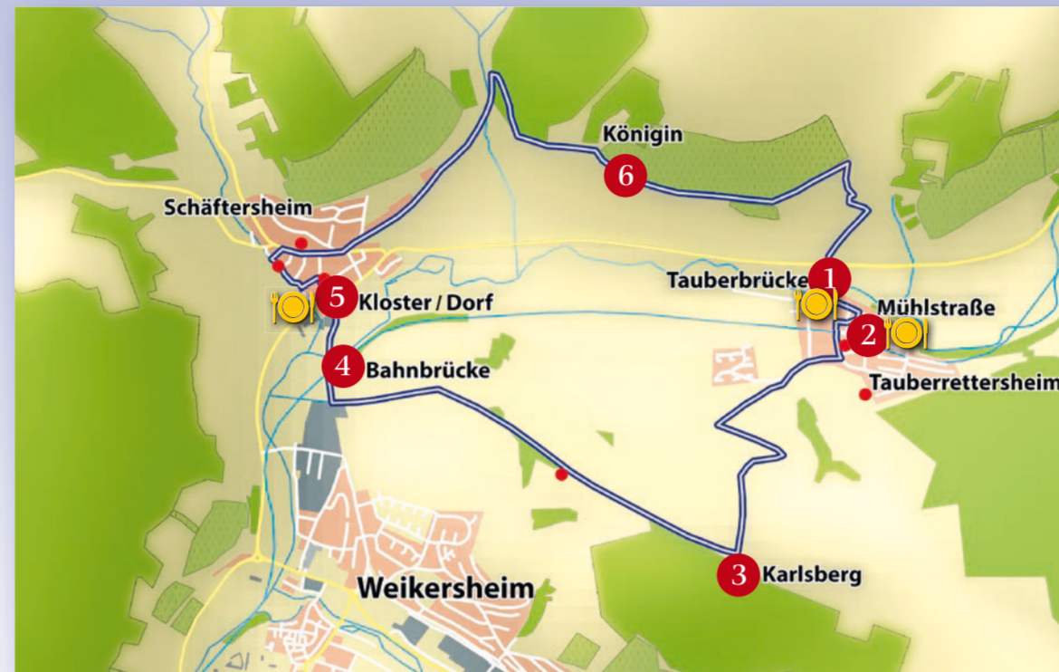
Weglänge 10 km Startpunkt Tauberbrücke, 97285 Tauberrettersheim ● kleine Informationstafel