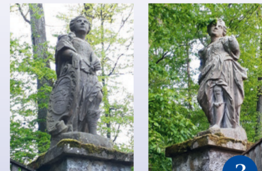
Barocke Figuren am Tor zum Park Karlsberg