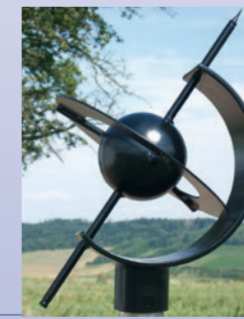
Zwischen Karlsberg und Schäftersheim laufen Sie entlang des Planetenweges

Im Wald auf dem Berg zwischen Tauberrettersheim und Weikersheim wurde 1679 ein Tierpark für die Jagd der Adelsfamilie Hohenlohe angelegt. 1727-1735 ließ hier Graf Carl Ludwig (1702-1756) ein Lust- und Jagdschloss errichten und benannte es nach seinem Namen in »Carlsberg« um. Bald nach dem Tod des Grafen setzte der Verfall des Lustschlosses ein, der 1865 zum Abriss führte. Heute (2018) sind Park und Haus in Privatbesitz und nicht öffentlich zugänglich. Der Kulturweg führt an der Sternwarte der Astronomischen Vereinigung Weikersheim vorbei und läuft entlang des Planetenweges.