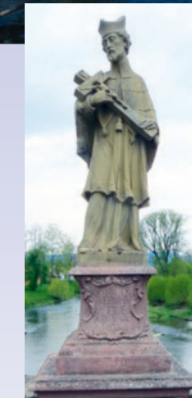
Heiliger Nepomuk auf der Tauberbrücke

Der Flut des Hochwassers von 1732 fielen in Tauberrettersheim drei Menschenleben zum Opfer und sie zerstörte die hölzerne Brücke. Der Würzburger Fürstbischof entschied sich für einen Neubau aus Stein und es war niemand anderes als Balthasar Neumann, der den Neubau plante und durchführen ließ – auf einer Länge von über 85 Metern mit 6 Jochen die Tauber überspannend. Mit dem Ausbau der Straße 1841/42 auf der rechten Uferseite von Tauberrettersheim nach Schäftersheim verlor die Brücke ihre Bedeutung für den Fernverkehr. Folgen Sie der Markierung des gelben EU-Schiffchens auf blauem Grund auf einer Länge von 10 km.