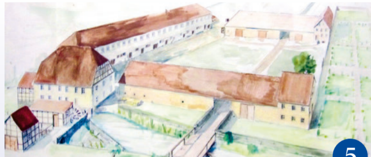
Rekonstruktion der Klosteranlage nach zeitgenössischer Vorlage von Karl-Ernst Sauer