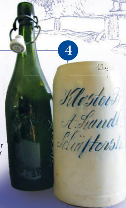
Flasche und Krug der Brauerei Landbeck

Die ehemalige Bahnbrücke der 36 km langen Gaubahn Ochsenfurt - Weikersheim führte hier über den Tauberfluss. Die Bahnlinie wurde 1907 eröffnet und reichte ab 1909 bis Weikersheim. Sie führte durch die zwei Bundesländer (Baden-)Württemberg und Bayern. Ihre Bedeutung lag im Transport landwirtschaftlicher Güter, vor allem von Zuckerrüben, die im benachbarten Ochsenfurter Gau angebaut werden. Der Güterverkehr wurde bis 1974 bedient, die gesamte Strecke 1992 stillgelegt. Aus der Bahntrasse wurde der Gaubahnradweg. In den nahe gelegenen Felsen gebaut stand 1900-1930 die Schäftersheimer Brauerei. Heute (2018) ist noch der Eingang zum Eiskeller im Inneren des Felsens sichtbar.