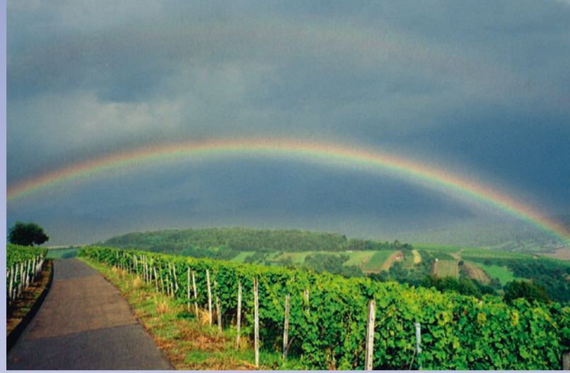
Regenbogen über der Weinlage »Königin«