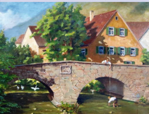
Brücke über den Nassauer Bach