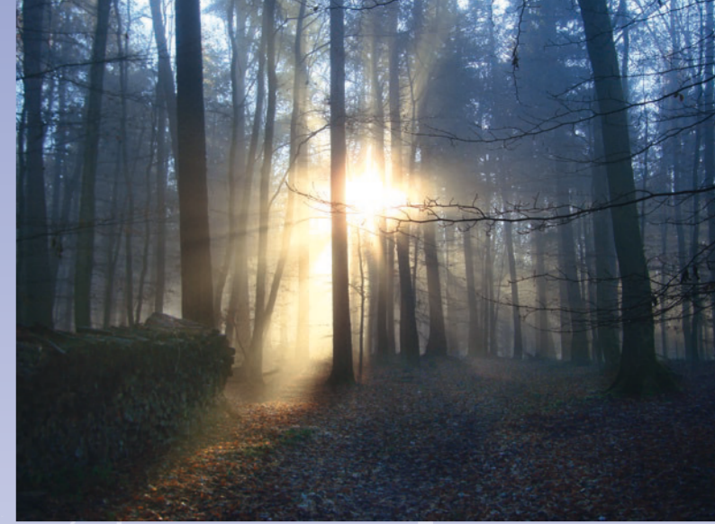
Im Morgenlicht auf der Waldwanderungsrouten