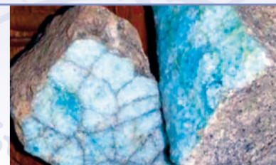
Bröckchen aus der Ofenwand eines Glasofens, die bei der Anlage des Golfplatzes gefunden wurden