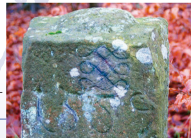
Grenzstein 1559 (17) oben mit der brotlaibförmigen Erhebung und den drei Ewigkeitszeichen