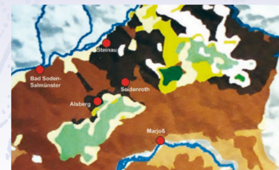
Geologie des Nordspessarts: Hellbraun der rote Buntsandstein, links hellgrün der Basalt der Alsberger Platte