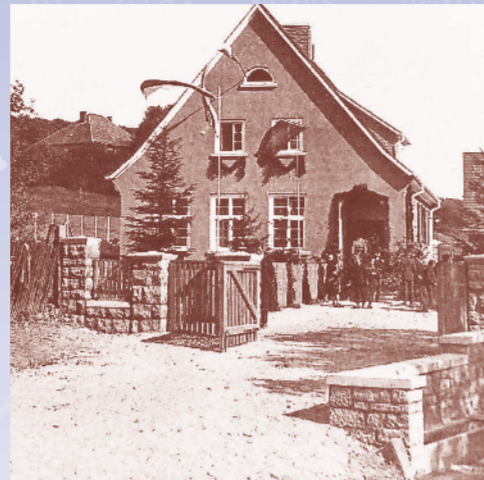
Historisches Foto der alten Schule am Start des Kulturweges

Weglänge: Panoramarunde 2 km, Waldwanderung 10 km kl kleine Informationstafel Startpunkt: Alte Schule, Ringstraße 16, 63628 Bad Soden-Salmünster