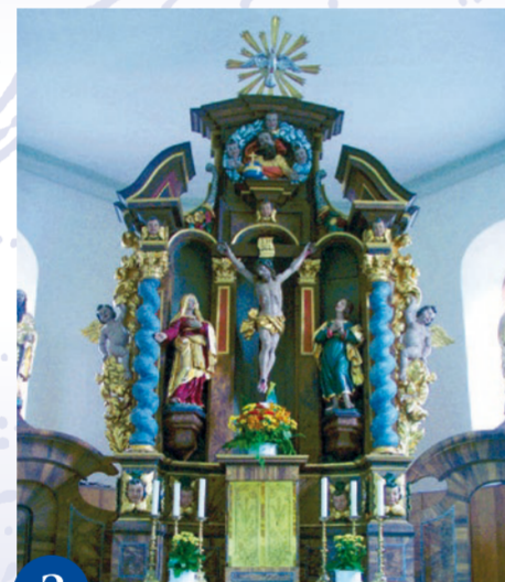
Die Alsberger Kirche während der Jugendwallfahrt in den 1980er Jahren