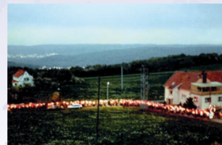
Lichterprozession der Frauenwallfahrt 1978