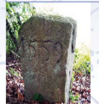
Grenzstein von 1559 am Golfplatz

1972 entstand die Idee der Gründung eines Golfplatzes in Alsberg. Die Verhandlungen mit den örtlichen Grundstücksbesitzern führten 1974 zu einer Einigung. Seit 1988 kann auf 18 Bahnen gespielt werden. Der Golfplatz bildet eine Fortsetzung der Landschaftsnutzung durch den Menschen. Während die Fläche heute der Freizeit und Naherholung dient, war sie im 16. Jahrhundert so begehrt, dass sie von der Mainzer und Hanauischen Grenze durchschnitten wurde. Schlackehalden geben Auskunft darüber, dass Eisenerz geschmolzen wurde. Glasscherbenfunde verweisen auf einen mittelalterlichen Glasofenstandort.