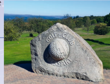
Gedenkstein an der Zufahrt zum 25jährigen Jubiläum des Golfplatzes

Weglänge: Panoramarunde 2 km, Waldwanderung 10 km kl kleine Informationstafel Startpunkt: Alte Schule, Ringstraße 16, 63628 Bad Soden-Salmünster