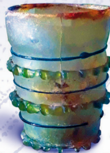
Die barocke Ausstattung in der Alsberger Kirche und das 1975 gefundene Spessartglas