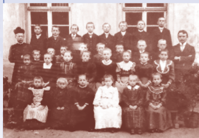
Alsberger Schulklasse im Jahr 1911