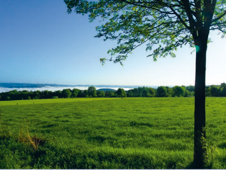
Blick im Frühjahr von der Panoramarunde

Zwei Schleifen bringen Ihnen die Geschichte der Kulturlandschaft von Alsberg näher: Mit einem 2 km langen Spaziergang gelangt man zur Kirche und zum Panoramablick. Die rund 10 km lange Waldwanderung führt entlang der ältesten datierten Spessart-Grenzsteine.