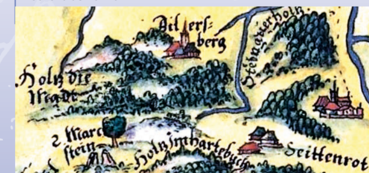
»Alsberg« und die »2 Markstein« auf der Spessartkarte des Paul Pfinzing von 1594

1559 wurde die Mainzer und Hanauische Grenze mit Steinen und Jahreszahlen markiert. Darunter hat sich ein außergewöhnlicher Grenzstein mit einer runden Erhöhung erhalten, auf der bei einem Grenzgang der Grenzverlauf durch Handauflegen der Teilnehmer bekräftigt wurde. 1660 und 1741 wurden jeweils zusätzliche Steine gesetzt. Seit 1976 werden die historischen Grenzen des Altkreises Schlüchtern dokumentarisch erfasst und so als Zeugnisse der historischen Kulturlandschaft bewahrt.