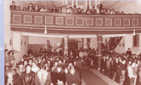
Die Alsberger Kirche während der Jugendwallfahrt in den 1980er Jahren

Seit mehr als 500 Jahren ist in Alsberg eine Wallfahrt belegt, wegen der die Kirche zu Beginn des 18. Jahrhunderts erweitert werden musste. Nachdem die Wallfahrt im 19. Jahrhundert fast zum Erliegen kam, wurde sie in den 1920er Jahren neu belebt. Der Innenraum erhielt eine kunstvolle barocke Ausstattung. Bei einer Kirchenrenovierung wurde 1975 im Altarstein ein intaktes mittelalterliches Spessartglas gefunden, das heute im Dommuseum in Fulda zu sehen ist.