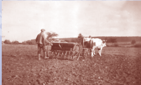
Landwirtschaft früher in Alsberg: August Harnischfeger (»Senge August«) an der Sämaschine (um 1935)

Die 2 km lange Spazierrunde erlaubt einen weit reichenden Blick auf den Vogelsberg. Bei guter Sicht hat man auch die Chance, den Sendeturm des Großen Feldbergs im Taunus (880 m) hervorlugen zu sehen. In östlicher Richtung am Horizont sind mit der Wasserkuppe (950 m) und mit dem markanten Gipfel der Milseburg (835 m) die höchsten Gipfel der Rhön zu erkennen.