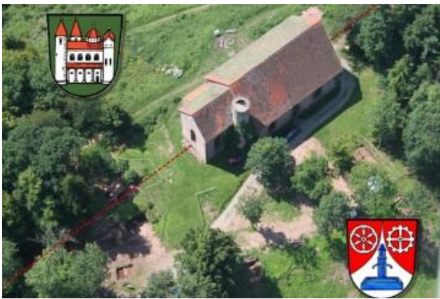
Auch heute noch verläuft die Gemarkungsgrenze mitten durch die Kirchenruine

im Tal erfolgt sein. Hierfür notwendige, zusätzliche Gebäude zeichnen sich bis heute im Weichbild der Stadt Amorbach deutlich ab. Ein zweiter Grund für die Aufgabe der Besiedelung auf dem Gotthardsberg dürfte die mit dem Brand einhergegangene Zerstörung der Infrastruktur, insbesondere der Wasserversorgung, gewesen sein. Blad nach 1600 wurde die Kirche auf dem Gotthardsberg auf Initiative des Klosters Amorbach in Teilen wiederhergestellt. 7 Dass dabei, wie urkundlich bezeugt, auch ein Teil der Klosterbebauung instand gesetzt wurde, lässt sich bislang archäologisch beispielsweise in Form zeitgemäßer Ofenkacheln belegen, die anlässlich des Neubaus zum Einsatz kamen. Stehen blieb nur die Ruine der Klosterkirche. Ein Blitzschlag im Jahre 1714 zerstörte das Dachgebälk des Kirchenschiffes.