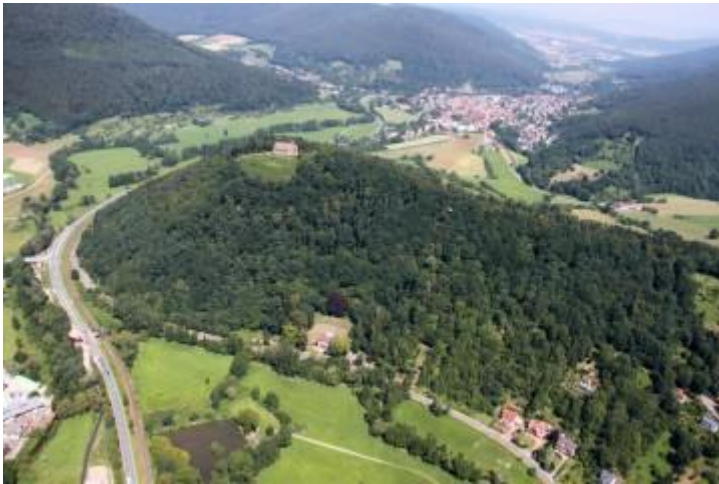
Der Gotthardsberg von Amorbach zum Main hin gesehen. Auf dem Luftbild ist die strategische Bedeutung der Anlage augenscheinlich

Auf seiner etwa 100 Meter frei emporsteigenden Bergkuppe bildet der Gotthardsberg die markanteste Erhebung im Tal der Mud. Von seiner Spitze aus kann ein Rundblick in sieben Täler genossen werden. Von dem ehemaligen Frauenkloster hat sich heute nur noch die 1956 wieder eingedeckte Kirchenruine obertägig erhalten. Sie steht auf dem höchsten Punkt eines nach Osten weisenden Bergsporns. Nach drei Seiten hin fällt das Gelände steil in die Täler ab. An seiner Ostseite setzt sich der Höhenrücken stufenartig abgetreppt über mehrere hundert Meter fort, bis ein tief einschneidender Graben die Kuppe vom westlichen Ausläufer des Sommerberges trennt. Die exponierte Lage in der umliegenden Landschaft mit Sicht bis in den Spessart macht deutlich, welchen strategischen Vorteil man sich zu allen Zeiten von einer Bebauung auf dem Berg versprach. In jüngerer Zeit ist die Anlage vor allem von touristischem Interesse. Im Jahre 1878 wurde der Rundturm auf der Nordostseite der Kirche erhöht und zum Aussichtspunkt ausgebaut. Entscheidend für die Wahrnehmung des Ensembles war die Entwaldung der Hügelkuppe in den 1990er-Jahren.