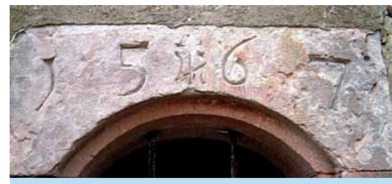
Aus der gleichen Zeit ein Foto der Jahreszahl 1567 auf dem Fenstergewände