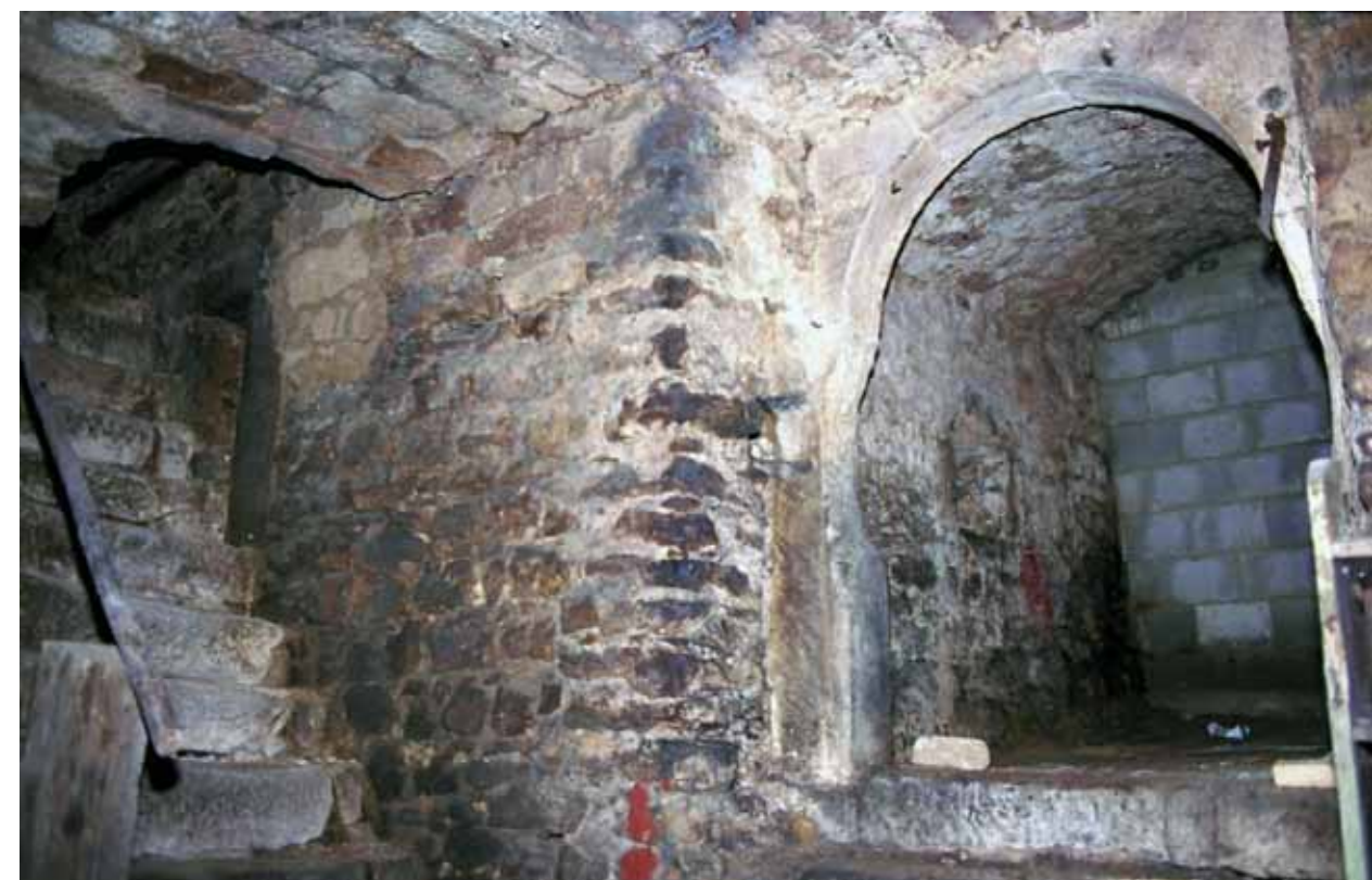
Keller des Templerhauses vor der Sanierung; rechts sichtbar der Beginn des unterirdischen Ganges in Richtung Kirche.

In der Kleinwallstädter Chronik von 1931 wurde dieses Haus dem Templerorden zugeordnet, weshalb es seinen heutigen Namen trägt.