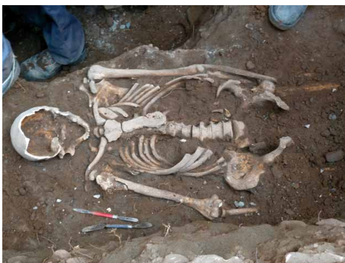
Skelettfund bei der Grabung im Jahre 2012

Man vermutet, dass dieser Kellergang als Verbindung zur Kirche des Ortes als Fluchtweg geschaffen wurde. Nach dem geheimnisvollen unterirdischen Gang zum „Alten Schloss“, der lange in der Phantasie vergangener Generationen spukte, sucht man allerdings vergebens.