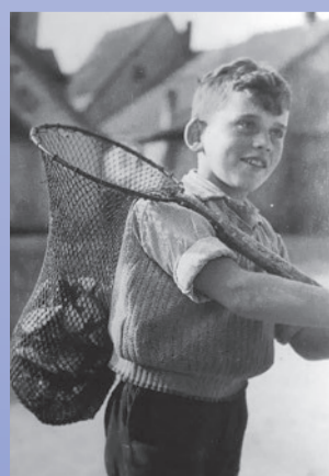
Der »Hennebergesserperla« bei der Heimkehr mit seinem Fang