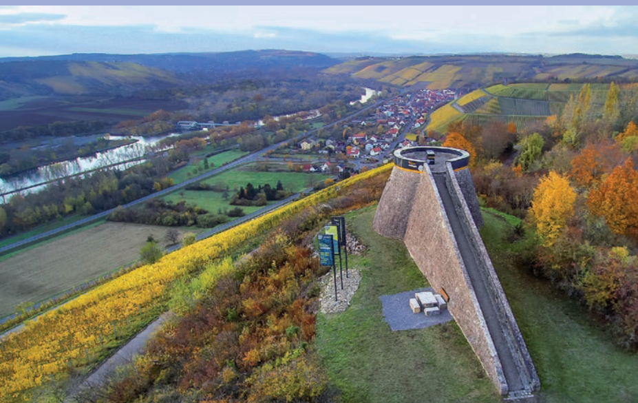
Blick auf den terroir f von Randersacker