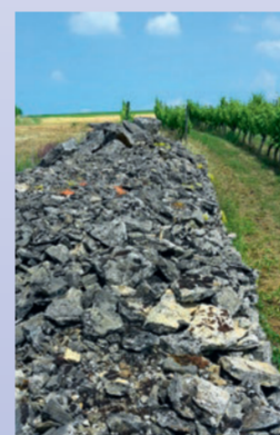
Steinrutsche in den Theilheimer Weinbergen