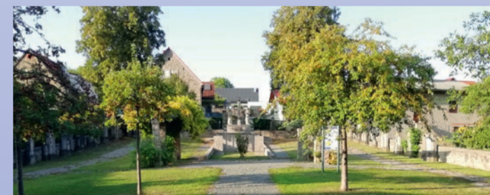
Seit 1972 ist der ehemalige Theilheimer Friedhof zum Dorfpark umgewidmet.