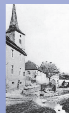
Theilheimer Rathaus, Kirche, neues Pfarrheim und Pfarrhaus 1921 und 2020