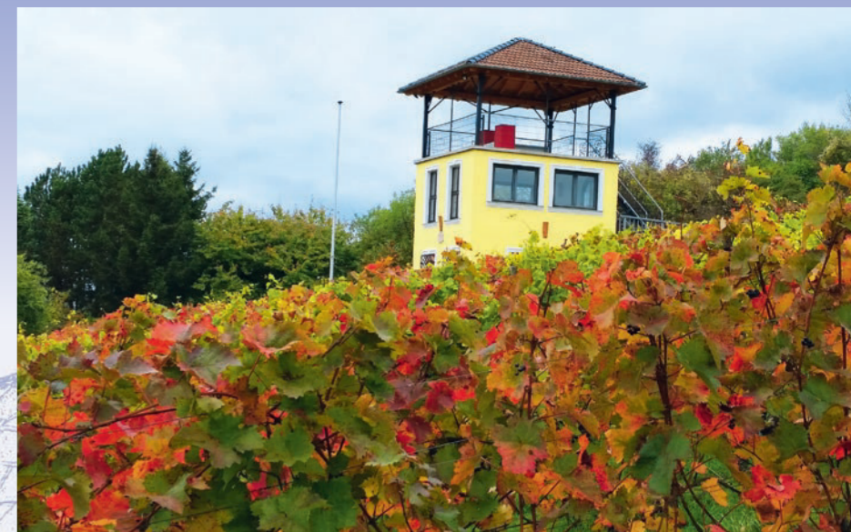
Der Urlaubsturm in den Theilheimer Weinbergen