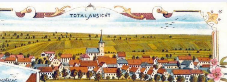
Theilheim auf einer Postkarte von 1899