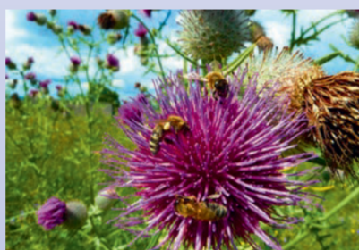
Bienen auf Distel und Ziegen im Naturschutzgebiet Marsberg

Die Randersackerer Fischerzunft veranstaltet jährlich im Oktober einen Fischmarkt, wo man die köstlichen »Meefischli« am Stück frittiert schmecken kann.