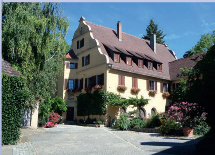
Von der Herrngasse durch das Torhaus kommen Sie in den Innenhof des ehemaligen Zehnthofs.

Der eigens ausgeschilderte Gang durch den historischen Altort in Randersacker bringt Ihnen Rathaus, Zehnthof, Flecken (alter Marktplatz), Mönchshof und Kirchplatz näher.