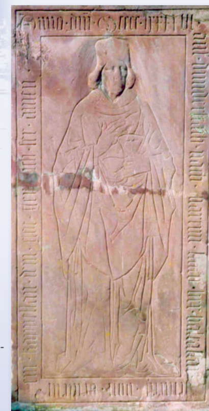
Sandstein-Grabplatte in der Pfarrkirche Theilheim von 1496 aus der Werkstatt Tillmann Riemen-schneiders