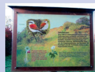
Info-Tafel des Theilheimer Weinlehrpfades