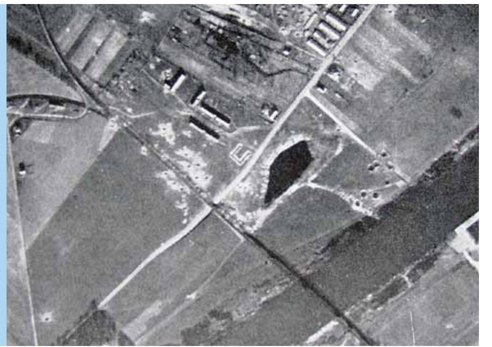
Rechts: Da die Brücke im 2. Weltkrieg nicht gesprengt wurde, diente sie den amerikanischen Streitkräften als Brückenkopf (Luftbild 1945).

Militärhistorisch bekannt ist die Brücke, weil sie im Frühjahr 1945 unzerstört blieb, anders als die Aschaffener Mainbrücke. Hier überquerten am 25. März amerikanische Truppen den Main, worauf ein 9-tägiger Kampf um Aschaffenburg begann, der Tote und Verletzte auf beiden Seiten forderte, bis die Stadt am 3. April kapitulierte.