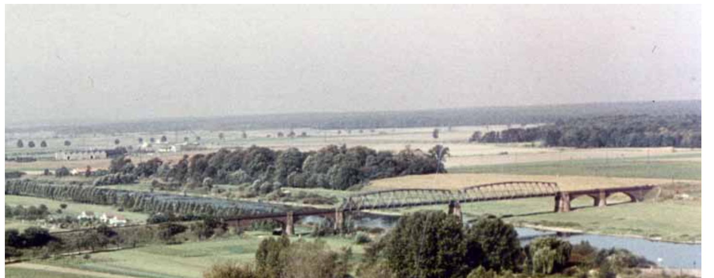
In den frühen 1960er Jahren ist vom Nilkheimer Industrie- und Gewerbegebiet kaum etwas zu sehen.

Die Tafel „Nilkheimer Brücke“ wurde realisiert im Rahmen des Projekts «Pathways to Cultural Landscapes» durch die ARGE Nilkheim mit Förderung von: Vereinsring Nilkheim, Fa. Kaup GmbH & Co KG, Fa. Ulltech AG, Fa. INRO Rohstoffhandel, Notar Dr. Thilo Morhard, Fa. Kreher Beton GmbH, Fa. Bernhard Westarp GmbH, Fa. Helmut Westarp GmbH, Fa. IWS GmbH, Mergenbaumblatt, Aschaffener Versorgungs GmbH, Sparkasse Aschaffenburg, Raiffeisenbank Aschaffenburg. Mit Unterstützung durch Bayernhafen Aschaffenburg, Stadt Aschaffenburg, Archäologisches Spessartprojekt und Herrn Carsten Polnick.