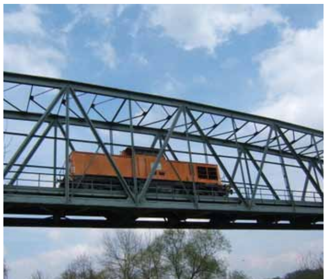
Heute transportiert die Hafentbahn Güter zwischen Bahnnetz und Hafengelände.