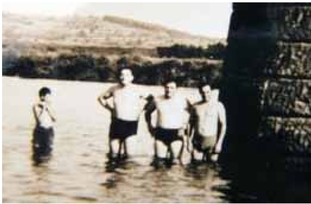
Links: Der Main war früher das Schwimmbad für die Jugend - auch in Nilkheim an der Brücke.

Die fortschreitende Mainkanalisierung trieb die Bereitstellung von Industrieflächen im Hafen voran. Dies kam der Infrastruktur von Leider und Nilkheim zugute.