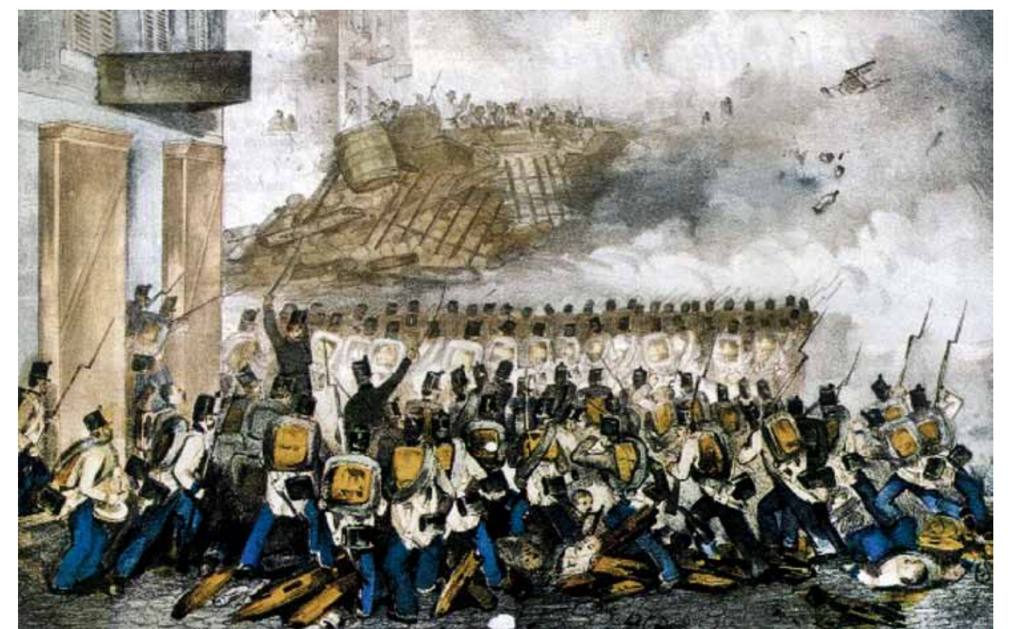
Auch in Frankfurt wüteten zu Beginn der Märzrevolution 1848 Barrikadenkämpfe.

Der soziale Druck, der sich im Vormärz angestaut hatte, entlud sich nicht immer in Versammlungen und Debatten. Besonders zu Beginn der Märzrevolution kam es zu Auseinandersetzungen zwischen Demonstranten und der Polizei. Barrikadenkämpfe forderten Opfer auf beiden Seiten. Die schlimmsten fanden in Berlin statt. Neben der Bauernbefreiung und der Forderung nach einem deutschen Nationalstaat (1848 existierte noch das Kunstprodukt des Wiener Kongresses: der Deutsche Bund), standen die Forderungen nach Gewerbefreiheit im Vordergrund. Die einsetzende Industrialisierung mit den für die entstehende Arbeiterklasse widrigen Lebensumständen heizte die Atmosphäre zusätzlich an.