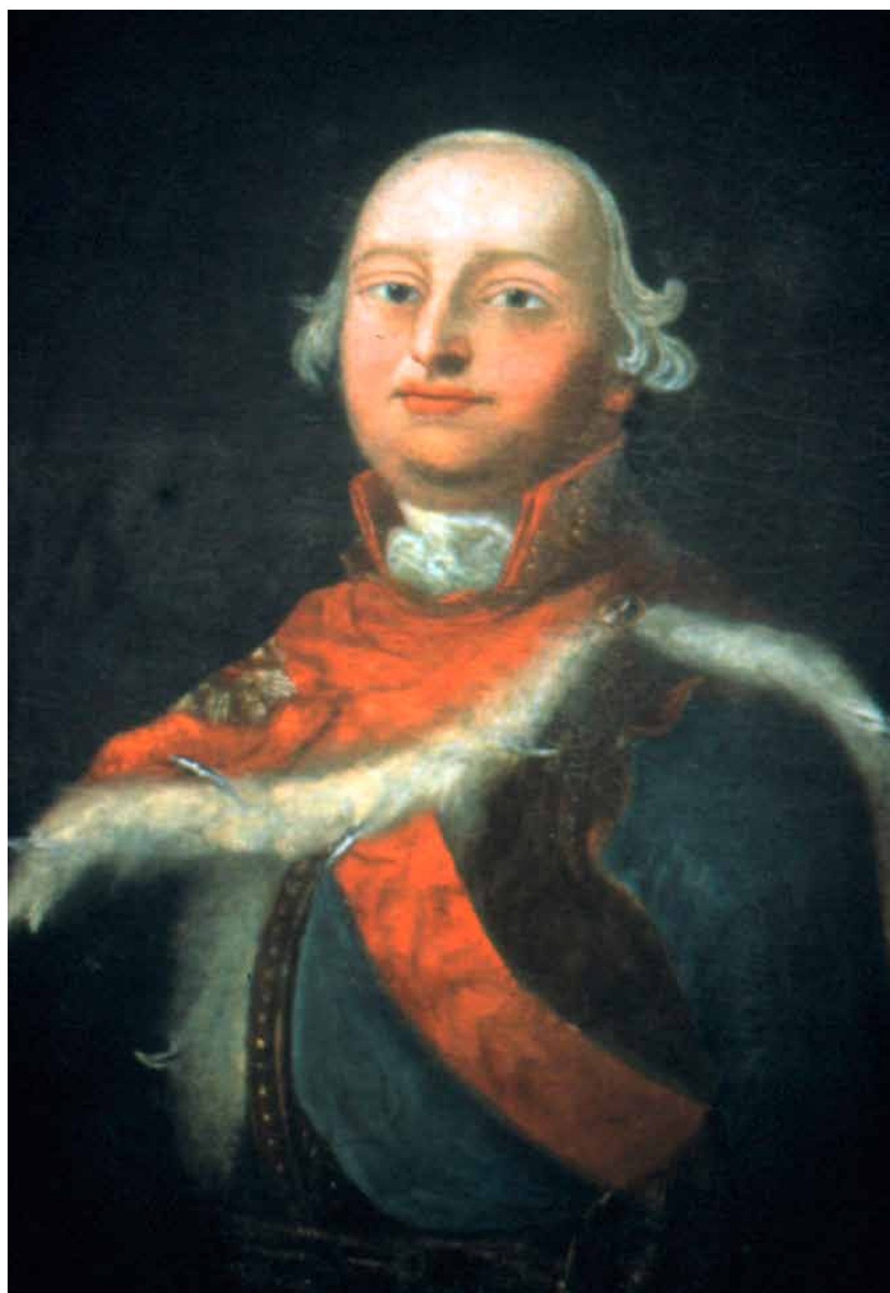
Fürst Konstantin zu Löwenstein-Wertheim-Rosenberg

Hinter diesem Wortungstüm verbirgt sich die bis dahin größte territoriale und politische Umgestaltung Deutschlands überhaupt, nämlich das Ende des Heiligen Römischen Reiches Deutscher Nation. Anlass dafür gaben die Napoleonischen Kriege 1792-1815, die das Reich schwächten und in Gebietsansprüchen Napoleons mündeten, die durch den Reichsdeputationshauptschluss befriedigt wurden. Dieser Beschluss des Reichstages entschädigte die Fürsten des Deutschen Reiches für ihre linksrheinischen Verluste an Frankreich durch die Enteignung und Aufhebung rechtsrheinischer geistlicher Güter (= Säkularisation).