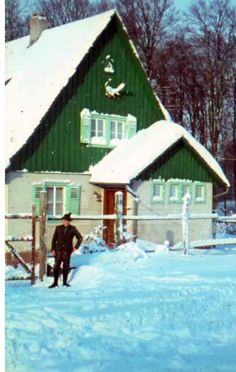
Das Forsthaus Aurora in den 1970er Jahren ...

Im Zuge einer Neuorganisation wurden 1818 die Forsthäuser Karlshöhe und Hubertus errichtet. Der Zustand des Waldes zum Zeitpunkt der Säkularisation war vom Einwirken der Menschen aus den umliegenden Ortschaften geprägt. Die Übernutzung des Waldes verhinderte das ungestörte Heranwachsen von geradem Bauholz. Die ausgedehnten Eichenbestände waren bereits zu Neustädter Zeiten gefällt worden. Die für das Gedeihen von Nutzholz verantwortlichen Förster bezeichneten den Mittelwald als „so sehr ruiniert ..., daß in vielen Jahren gar keine Rechnung darauf gemacht werden könnte.“