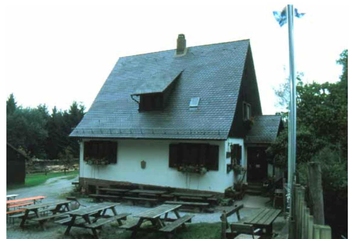
... und im Jahr 2000.

Das Forsthaus Aurora wird heute als Jausenstation für die Wanderer bewirtschaftet. Es leistet damit einen Beitrag für die touristische Infrastruktur im Spessart. Orte wie dieser sowie in nächster Nähe Sylvan und die Karlshöhe vermitteln dem Besucher das, was in etwa mit den Almhütten in den Alpen vergleichbar ist: Einen einfachen, aber stimmigen und überzeugenden Eindruck der Menschen, die hier leben und den lebendigen Teil der Kulturlandschaft Spessart ausmachen.