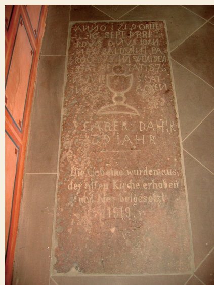
Der Grabstein des Pfarrers Balduini wurde von der alten Kirche in die Vierzehn-Nothelferkapelle versetzt.