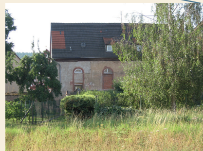
Die alte Kirche steht etwas zurückgesetzt vom Ortskern.

Das Rathaus ist das älteste erhaltene Bauwerk Wenigumstadts. Es wurde 1584 während der Regierungszeit des Mainzer Kurfürsten Wolfgang von Dalberg im Renaissancestil errichtet. Am Steinsims zwischen Erd- und Obergeschoss sind die zeitgenössischen Steinmetzzeichen zu erkennen. Jeder Steinmetz hatte sein eigenes Zeichen, das für die Abrechnung wichtig war. Das Untergeschoss bestand früher aus einer offenen Halle, die durch drei Rundbogenportale betreten werden konnte. Diese wurden nach 1890 zu Fenstern umgearbeitet oder zugemauert. Heute erinnert fast nichts mehr an die frühere Halle. Das reich verzierte Fachwerkobergeschoss wurde 1925 freigelegt. Durch die Verzierung mit ornamentalem Blattwerk, Spiralen, Sternen, Sonnen und Engelsköpfen ähnelt das Haus anderen mainfränkischen Bauten. Die Verzierung des linken Eckpfostens sticht ins Auge: Zwei halbseitige Drachenköpfe erscheinen nach vorne als Schreckkopf. Daraus wächst der Mittelstab mit einer Nixe und zwölf Engelsköpfen, der wiederum in einen Drachenkopf mündet. Die Kratzputzbilder stammen aus dem Jahre 1953 und sind das Werk des Wenigumstädter Kirchenmalers Willy Jakob.