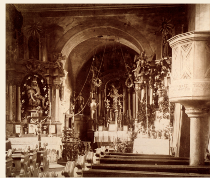
Innenansicht der alten Kirche.