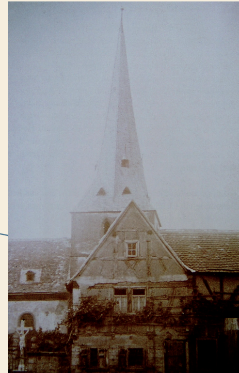
Der 1910 abgerissene Turm der alten Kirche.