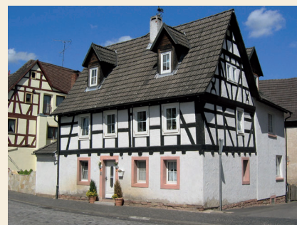
Das älteste Schulhaus gegenüber dem Rathaus.