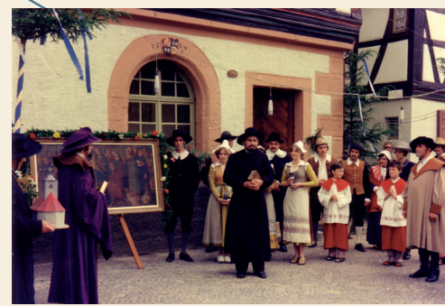
Zum Heimatfest 1975 wurde der Einzug der Wallonen in einem Festspiel von der Dorfbevölkerung aufgeführt.