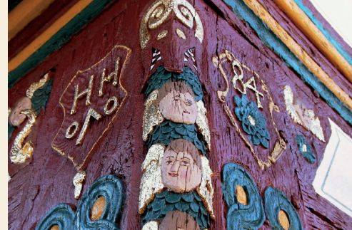
Oben und links: Details des neu bemalten Schnitzwerkes.