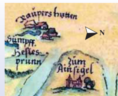
Die 1594 erstellte Pinzing-Karte zeigt »Raupershütten« (Ruppertshütten) und das Kloster »Zum Ainsigel« (Einsiedel)