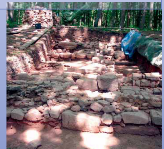
Die ergrabenen Fundamente zeigen, dass das Kloster Einsiedel bisher in Größe und Bedeutung weit unterschätzt wurde.