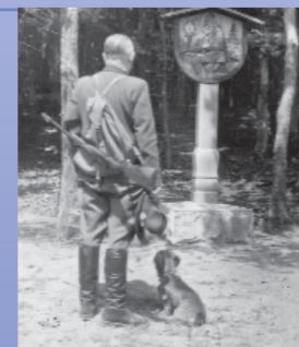
Der 1951 errichtete Bildstock »Hubertus«