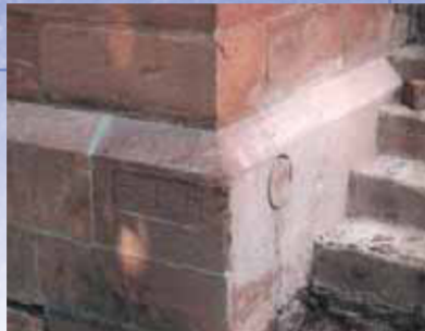
Der Grundstein der neuen Kirche, aus dem der Aufriss der alten Kirche geborgen wurde