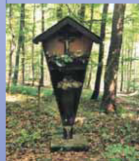
Eine Anzahl von Bildstöcken säumt den Kulturrundweg