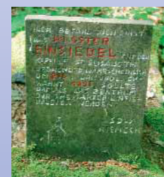
Der kleine Inschriftenstein verweist auf einen früheren Wissensstand. Die Info-Tafel von 2003 wird nach dem Ende der Grabungen aktualisiert.