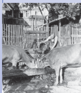
Der Startpunkt Dorfplatz mit dem Brunnen in den 50er Jahren des 20. Jahrhunderts

Folgen Sie dem Rundweg mit der Markierung des gelben EU-Schiffchens auf blauem Grund.