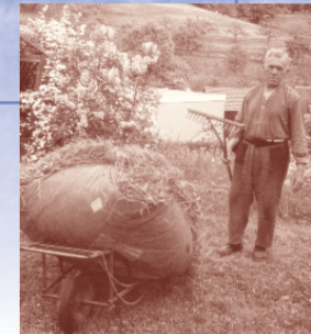
Beim Futtermachen im Jahr 1975

Bei der Heuabfuhr um 1950, links im Bild eine Mähmaschine, vor die Vieh gespannt werden konnte