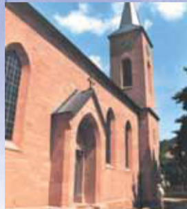
Die 1876 errichtete neue Kirche in Ruppertshütten

Bis vor zehn Jahren war das Aussehen der von Pater Martin von Cochem erbauten Kirche völlig unbekannt. Erst bei Renovierungsarbeiten an der 1876 errichteten neuen Kirche wurde der Grundstein geöffnet, worin sich zeitgenössische Dokumente fanden. Darunter war auch ein Aufriss der alten Kirche, der somit ein einzigartiges Dokument der Ortsgeschichte darstellt.