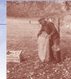
Apferlerte um 1950