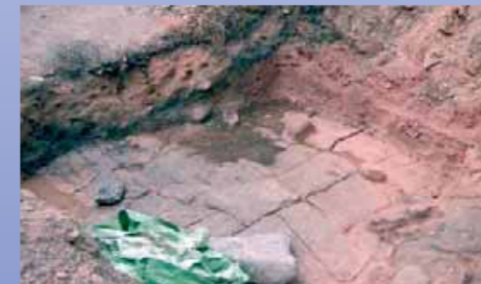
Erste Untersuchungen an der Trasse der Birkenhainer Straße lassen vermuten, dass diese Straße im Mittelalter besser ausgebaut war als bisher bekannt.