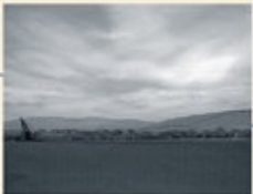
Virtueller Blick vom Main zum Kastell.

Die Region links des bayerischen Untermain stand fast 160 Jahre - von etwa 100 bis 260 n. Chr. - unter römischer Herrschaft. Der Main bildete streckenweise die Grenze (Mainlimes) zur Germania magna (Großgermanien) im Osten. Basis für das römische Militär waren Kastelle und Wachtürme, die sich wie Perlen entlang des Mains aufreichten. In Wörth gab es ein kleines Kastell für einen Numerus - eine Einheit von ca. 150 Soldaten. Nach der Entdeckung des Kastells und des Badegebäudes am Ende des 19. Jahrhunderts durch Wilhelm Conrady ruhte die Forschung bis 2002. Die vom Bayerischen Landesamt für Denkmalpflege in München durchgeführten geophysikalischen Messungen machen im Boden liegende Strukturen von Mauerwerk, Gruben und Gräben sichtbar. Auf dem Bild der Messungen - dem Magnetogramm - ist die viereckige Umfassungsmauer des Kastells mit einem Tor an jeder Seite deutlich zu erkennen.