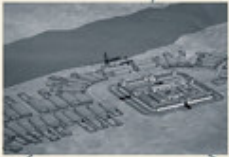
Die virtuelle Konstruktion gibt einen Überblick über die Fläche.