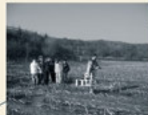
Geophysikalische Prospektion des bayerischen Landesamt für Denkmalpflege.

Die Anlage ist von einem Doppelgraben umgeben. Im Inneren liegt das zentrale Verwaltungsgebäude, die Principia , sowie das Wohnhaus des Kommandeurs und Soldatenunterkünfte. Das Magnetogramm lässt auch eine Zivilsiedlung an der linken Kastellseite erkennen sowie weitere Holzbauten auf der Mainseite. Einige Strukturen deuten auf Befestigungen des Uferbereichs sowie Anlegevorrichtungen für Schiffe hin. Anfangs bildete der Odenwaldlimes die Grenze. Vom Mainkastell verlief die durch Palisaden markierte Grenze auf die Odenwaldhöhe zum Wörther Erdkastell hinter dem Schneesberg und über Lützelbach, Vielbrunn, Würzburg weiter bis zum Neckar bei Bad Wimpfen. Um 160 n. Chr. verkürzte und vereinfachte man den Grenzverlauf, indem man einen Teil weiter nach Osten verlegte. Der Main zwischen dem Wörther Mainkastell und Miltenberg/Bürgstadt war jetzt auch Teil der natürlichen Flussgrenze. Der Odenwaldlimes wurde damit hinfällig und dem Verfall preisgegeben.