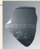
Hochwertige Tonscherbe aus Trier, gefunden in Wörth.