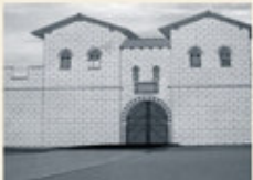
Virtuelle Rekonstruktion des Tores heute.