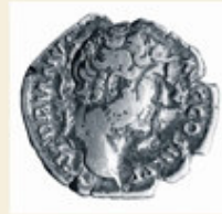
Münze des Kaisers Hadrian aus Wörth.