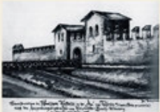
Rekonstruktion der Toranlage vor über 100 Jahren.