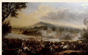
Dieses Gemälde zur Schlacht bei Dettingen wurde von Ludwig Christian von Löwenstern gemalt. Es zeigt die Flucht der Franzosen, von denen viele im Main ertranken.