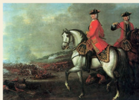
Der englische König Georg II. war der Sieger der Schlacht bei Dettingen. Er ließ von Georg Friedrich Händel das „Dettinger Te Deum“ komponieren.