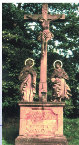
Die Kreuzigungsgruppe verrät ihr Alter durch das Chronogramm: Die Großbuchstaben sind lateinische Zahlen, die zusammengerechnet die Jahresangabe 1749 ergeben.

Nach dem kurzen, aber steilen Aufstieg über den Kreuzweg belohnt der Ausblick vom Hornungsberg, der ehemaligen Acker- und Weinbaufläche der Neustädter. Von hier hat man die beste Übersicht über die strategisch günstige Lage Neustadts: Der Ringwall auf dem Gaiberg und unterhalb die Befestigung der Michaelskirche im Süden, über dem Mainufer Erlach mit dem von dort nach Karlburg führenden Gertraudenpfad und schließlich nach Norden, wo der Weg von hier bis zur Margarethenkapelle entlang der alten »via publica«, der Verbindung Tauberbischofsheim-Fulda, entlangführt.