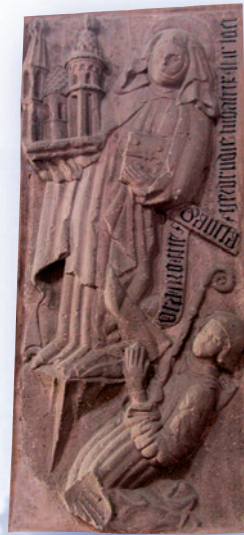
Das Steinrelief von Gertrud und Abt Königsfeld zeigt die älteste Darstellung der Kirche um 1438, wahrscheinlich die Ansicht von Westen aus.

Karl der Große soll hier ein sagenhaftes Jagdschloss auf dem Michaelsberg gehabt haben, drei Sachsenbischöfe waren Neustädter Äbte – überraschend starke Impulse gingen bei der Sachsenmission vom östlichen Spessart aus. Erleben Sie auf dem 12 km langen Rundweg über fünf Stationen mehr als 1200 Jahre Geschichte einer Kulturlandschaft.