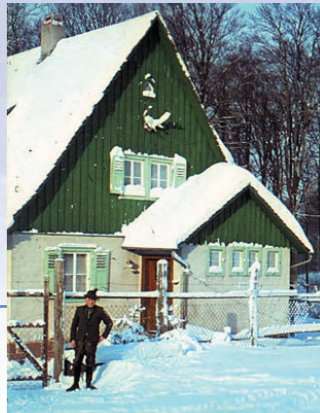
Forsthaus Aurora in den 70er Jahren

Das Forsthaus Aurora entstand nach dem Übergang des Neustädter Klosterwalds an den Fürsten zu Löwenstein-Wertheim-Rosenberg. Der im späten 19. Jahrhundert eingerichtete Wildpark, besonders die Umzäunung, benötigte dauernde Betreuung. 1936 wurde die Blockhütte durch ein steinernes Haus ersetzt, in dem die fürstlichen Förster lebten. Heute können sich Gäste in der Wandersaison von Mittwoch bis Samstag mit einer Vesper kräftigen.