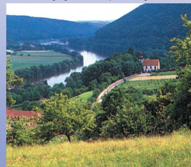
Die Michaelskirche mit dem Bergsporn des Gaibergs rechts im Hintergrund. Die ehemalige wahrscheinlich frühmittelalterliche Befestigung hatte eine exponierte Lage.