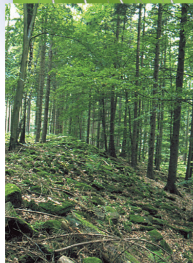
Der Ringwall auf dem Gaiberg steht unter Denkmalschutz.

Die im Jahr 2000 renovierte Margarethenkapelle wurde um 1190 gebaut.