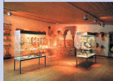
Im Lapidarium (von lat. »lapis = Stein«) können Sie das karolingische und romanische Kloster entdecken.

Folgen Sie dem Rundweg mit der Markierung des gelben EU-Schiffchens auf blauem Grund.