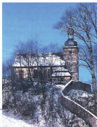
Die Michaelskirche steht inmitten einer frühmittelalterlichen Befestigung.

Archäologisch gut erforscht ist der Michaelsberg mit der Michaelskirche. Mehrere Grabungen brachten den Erkenntnis, dass hier bereits zur Anfangszeit des Klosters ein Kirchengebäude sowie weitere Befestigungen bestanden. In Neustadt könnte an diesem Platz eine Verwaltung ähnlich einer karolingischen Königspfalz angesiedelt gewesen sein. Die auch hier vorhandene Gertrudsverehrung wurde vor allem im Hochmittelalter betont, als Neustadt (vergeblich) versuchte, sich von der würzburgischen Herrschaft zu lösen.