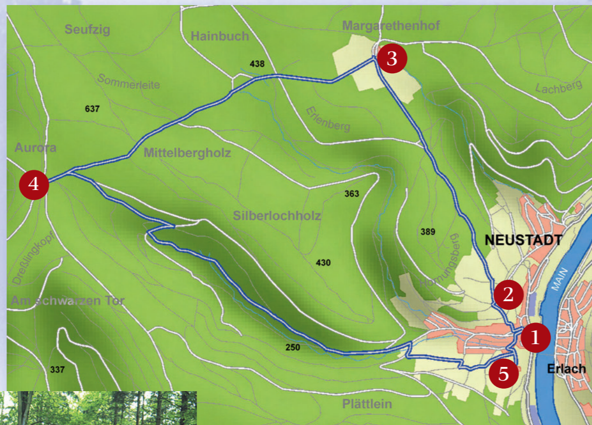
Weglänge: ca. 12 km