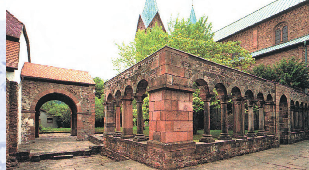
In der Klosteranlage (Station 1 des Kulturweges) empfängt Sie gleich nach dem Eintritt karolingische (links) und romanische Architektur.

Karl der Große soll hier ein sagenhaftes Jagdschloss auf dem Michaelsberg gehabt haben, drei Sachsenbischöfe waren Neustädter Äbte – überraschend starke Impulse gingen bei der Sachsenmission vom östlichen Spessart aus. Erleben Sie auf dem 12 km langen Rundweg über fünf Stationen mehr als 1200 Jahre Geschichte einer Kulturlandschaft.