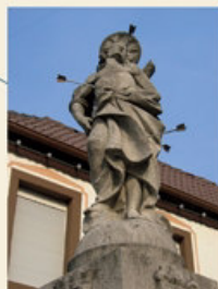
Der heilige Sebastian ist auf dem Brunnen neben dem Rathaus dargestellt.