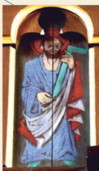
Links an der Empore kann man den Apostel Philipp erkennen, dessen Hand ohne Daumen bereits fünf Finger hat.