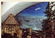
Die von einheimischen Künstlern geschaffene Wenigumstädter Krippe schmückt alljährlich ein Bild mit einer winterlichen Dorfansicht.