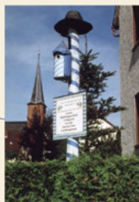
Lokalkolorit... Letzte Nistmöglichkeit vor der hessischen Grenze."

Als die alte, im Ortskern Wenigumstadts stehende Pfarrkirche baufällig und außerdem für die Gemeinde zu klein geworden war, kam um 1855 der Gedanke auf, eine neue Kirche zu errichten. Die Finanzierung dieses Vorhabens gestaltete sich jedoch schwierig, so dass einige Jahrzehnte vergingen, bis der Kirchenneubau am Anfang des 20. Jahrhunderts unter Pfarrer Ignaz Weber verwirklicht werden konnte. Als Bauplatz wurde ein Ort außerhalb des Dorfes gewählt, die „Saugärten“ gegenüber der Schule.