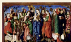
Das Tafelbild der vierzehn Nothelfer (15. Jahrhundert) stammt vermutlich aus fränkischer Schule.