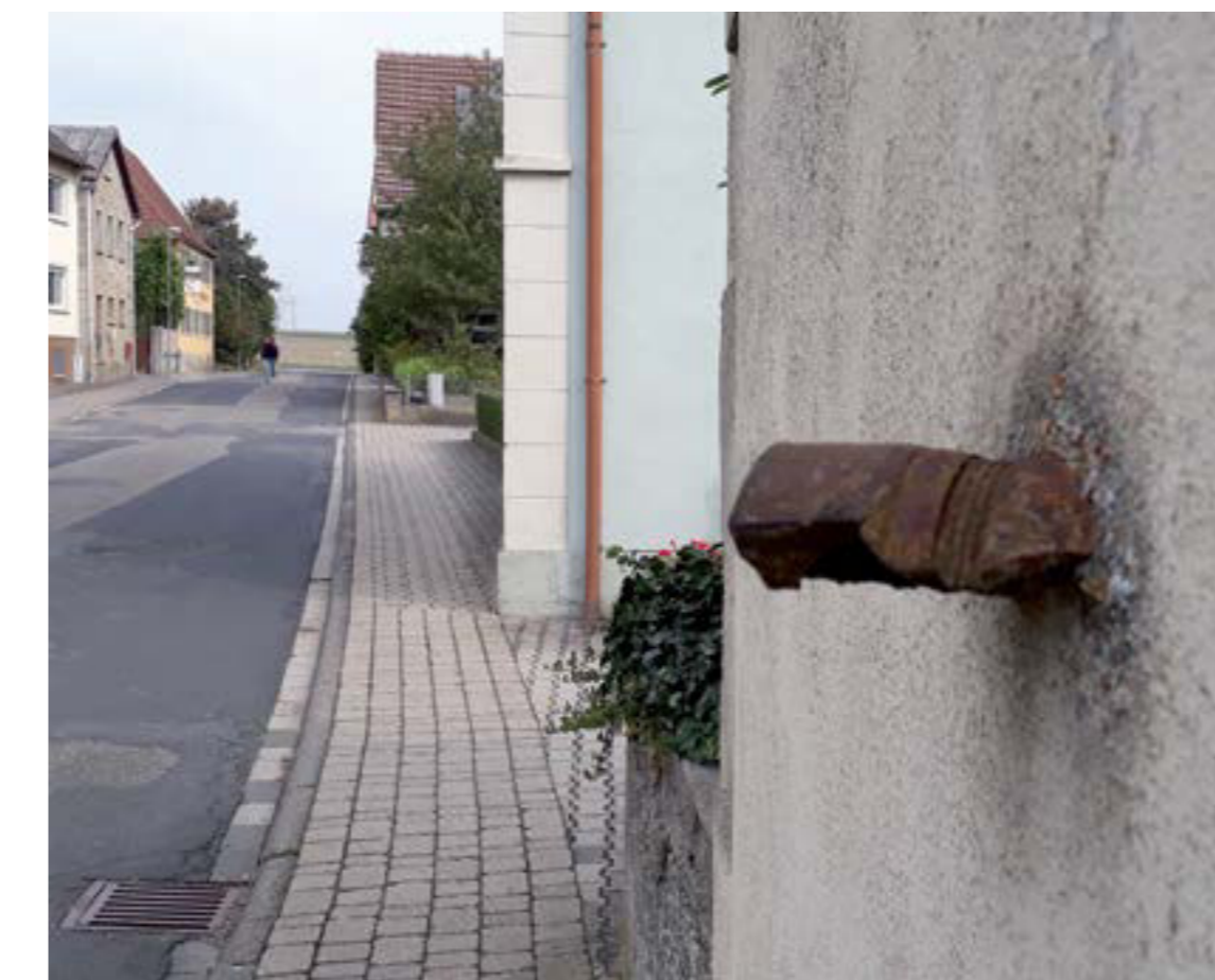
Gegenüber der Kirche ist in der Hauswand ein Granatsplitter aus den letzten Kriegstagen des Jahres 1945 erhalten geblieben.

Krieg und Kirche Die Hügelgräber bei Stalldorf künden von einer ersten Besiedlung um etwa 800 bis 400 v. Chr. Urkundlich tritt der Ort etwa 100 Jahre nach Riedenheim im Jahr 1224 auf. Wie in Riedenheim sind die Herren von Hohenlohe und das Hochstift Würzburg die Ortsherren, bis Stalldorf 1814 bayerisch wurde.