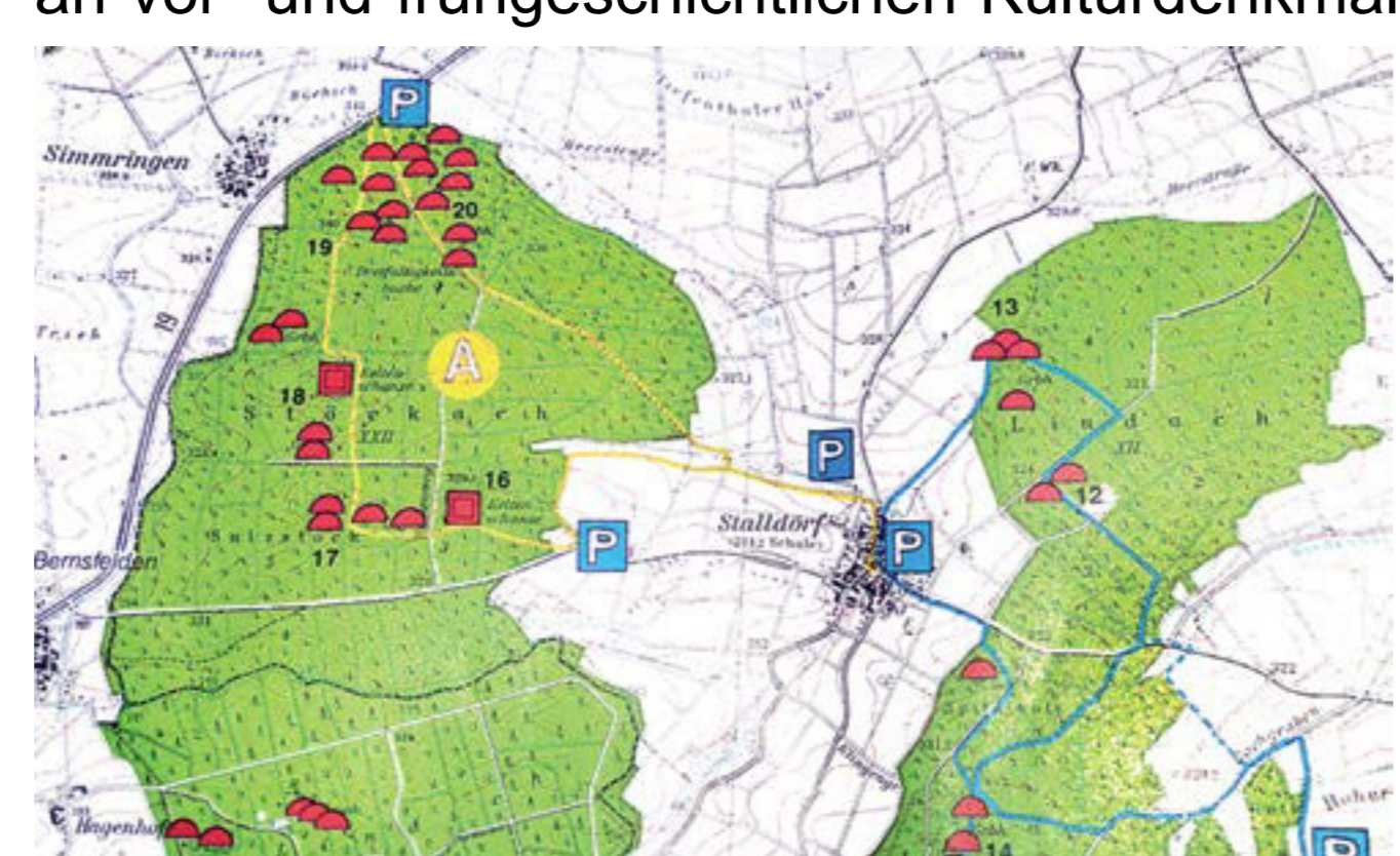
Um 1980 erschloss ein Archäologischer Wanderpfad die Hügelgräber und Viereckschanzen im Stöckachwald und bei Riedenheim. Der europäische Kulturweg hat die Route durch den Stöckachwald 2018 reaktiviert.

Frühe Kulte Die Gemeinde Riedenheim zeichnet sich durch einen großen Reichtum an vor- und frühgeschichtlichen Kulturdenkmälern aus. Hügelgräber bis zur Größe des „Fürstengrabes“, keltische Viereckschanzen und die hochmittelalterliche Michaelskapelle belegen dies eindrücklich. Bei der außergewöhnlichen Vielzahl der Hügelgräber im Wald ist zu beachten, dass einst weitaus mehr Begräbnisstätten vorhanden waren.