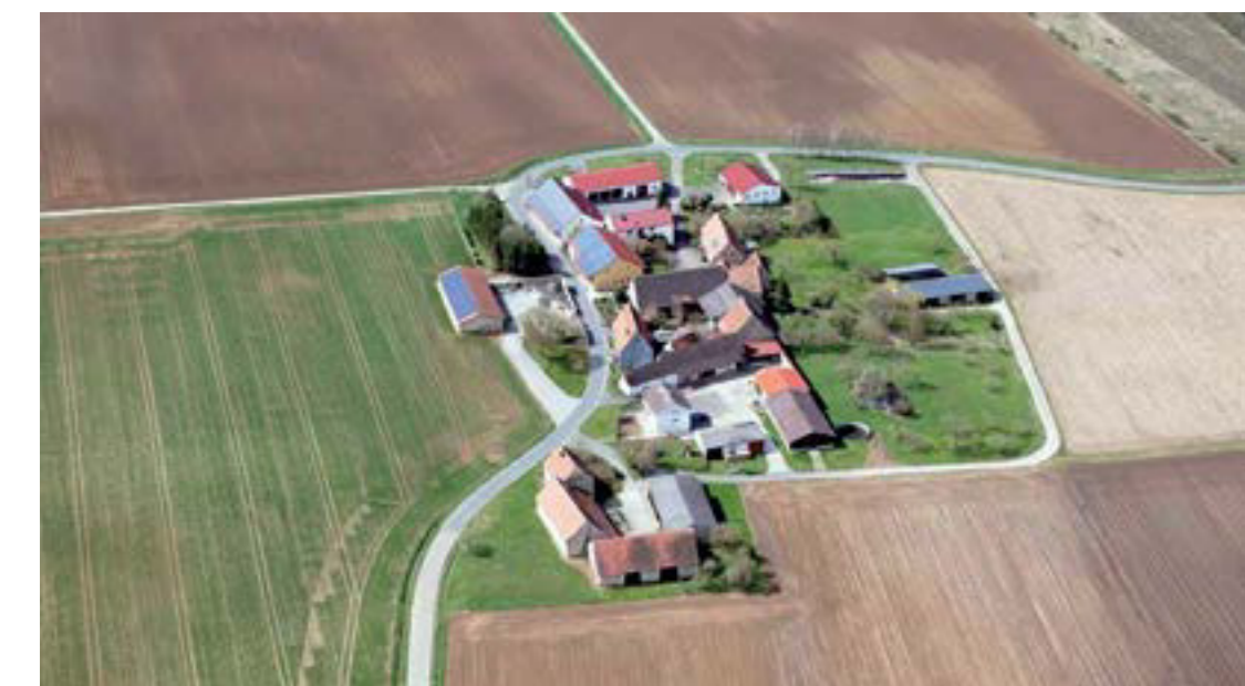
Der Ortsteil Lenzenbrunn ist eine Außenstation des Kulturweges.

Mit der umgestürzten Dreifaltigkeitsbuche führt der Kulturweg sogar zu einem Überrest aus der Pflanzenwelt. Darüber hinaus haben Riedenheim, Stalldorf, Oberhausen und Lenzenbrunn überraschende Aspekte zu bieten. So waren und sind hier in den letzten Jahrzehnten Künstler tätig, deren Arbeiten im öffentlichen Raum, in Kirchen, Ateliers und im Internet zu finden sind. Auch das Dorfleben kommt mit den Ehrendamen der Feuerwehr oder mit dem Brauch des Maibaumaufstellens nicht zu kurz. Außergewöhnlich sind die Aktivitäten des Fallschirmspringerclubs in Oberhausen.