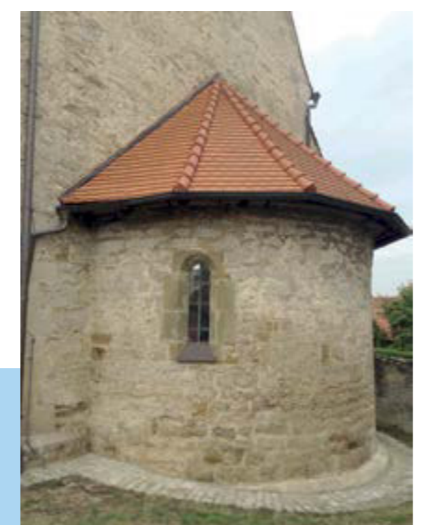
Die Michaelskapelle in Riedenheim ist hochmittelalterlichen Ursprungs. Sie gehörte zu der heute verschwundenen Burg Schönstein und der Wüstung Diebach im Schönstheimer Wald.

Die Michaelskapelle führt die Tradition des religiösen Zentralortes weiter. Ihre romanischen Anfänge verweisen auf das hohe Alter Riedenheims und auf die Bedeutung für den Adel der Region im 12. Jahrhundert. Danach verlagerten sich die Herrschaftsschwerpunkte zu den Burgen nach Röttingen und Aub.