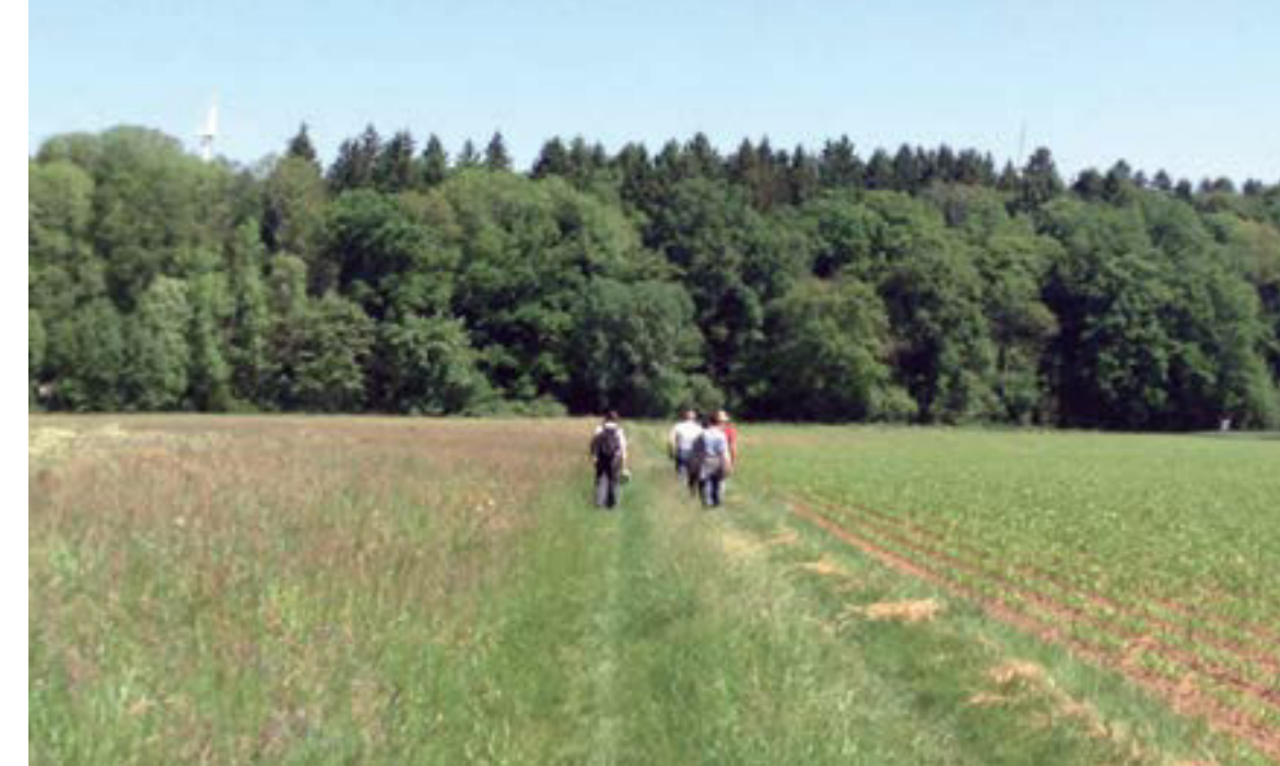
Die Stalldorfer Schleife des Kulturweges wechselt zwischen offener Feldlandschaft und langen Waldpassagen.

Erstaunlich ist an der Kulturlandschaft am Rand des Ochsenfurter Gaus immer wieder, dass Dörfer mit nur wenigen Einwohnern über Jahrhunderte bestehen geblieben und sich die Vielfalt der örtlichen Kulturdenkmäler zum großen Teil erhalten hat.