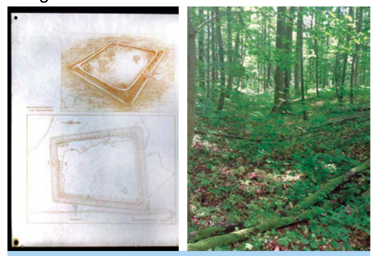
Die vorhandene Beschilderung an den Viereckschanzen im Stöckachwald informiert über ihre Entstehung.

Doch wurden sie durch den Pflug auf dem freien Feld über Jahrhunderte hinweg eingeebnet und zumeist völlig zerstört. Die beiden Viereckschanzen im Stöckachwald könnten keltische Tempelbezirke oder Gutshöfe mit einer religiösen Funktion gewesen sein. Wir wissen über die Religion der Kelten allerdings sehr wenig, doch waren die „Fürstengräber“ hohen keltischen Würdenträgern vorbehalten.