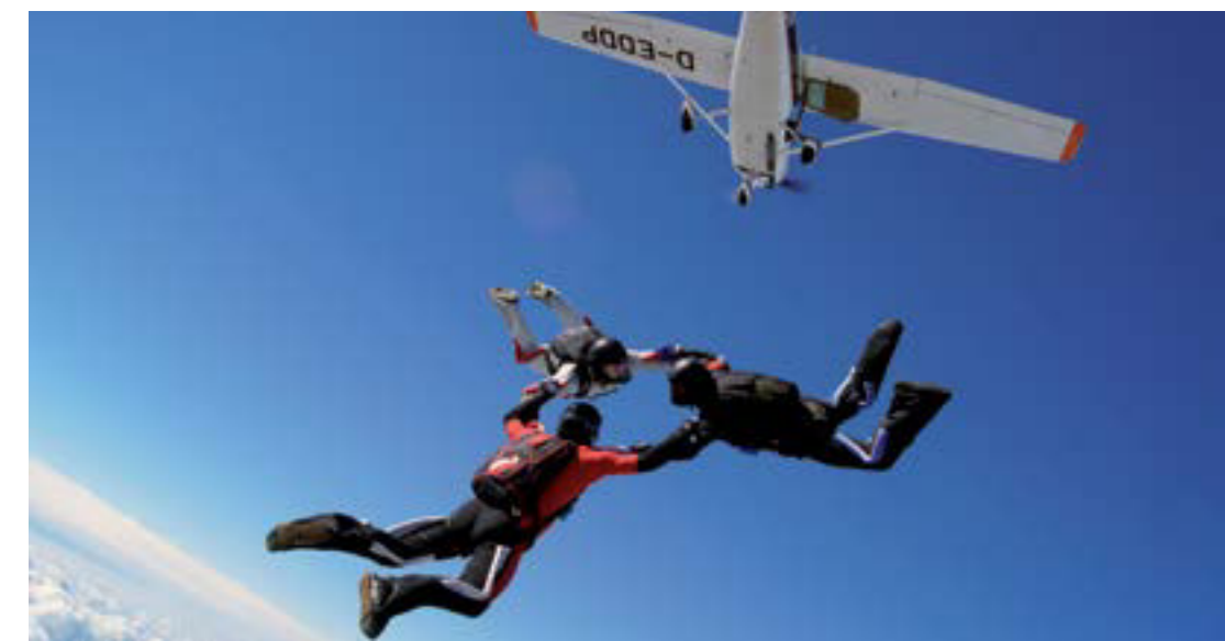
Bei der Riedenheimer Schleife wird auch der Ortsteil Oberhausen erwartet, wo der Fallschirmspringerclub seinen Sitz hat.

In der Gemeinde Riedenheim kann dies sehr schön über Jahrtausende am Beispiel von Kultstätten gezeigt werden. Von der Steinzeit über die Kelten bis zum Mittelalter erzählen Überreste von Grabhügeln, Tempelbezirken und einer romanischen Kapelle die Geschichte einer Landschaft, die aufgrund ihres fruchtbaren Ackerbodens attraktiv für die Besiedlung war.