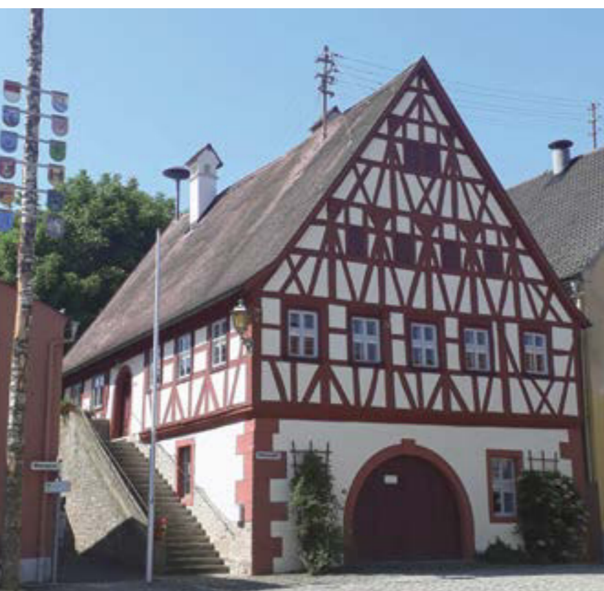
Das Riedenheimer Rathaus wurde 1575 erbaut. Die Michaelskapelle befindet sich mit dem Friedhof am Ortsrand von Riedenheim.