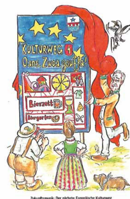
Laurenzimesse und Kulturweg

The Mainberg is 188 m high, the lowest of the seven hills of Marktheidenfeld. The railway line Lohr-Wertheim and the road crossing the bridge met at its foot, which again and again led to difficult traffic conditions. The railway between Lohr and Wertheim was built in 1879/81, but gained no greater importance. Exceptions were the visits of the Bavarian prince regent Luitpold between 1890 and 1911, which set off from the station in Marktheidenfeld for hunting Rohrbrunn or departed from here. The last regular passenger train between Lohr and Wertheim drove in late May 1976. After the dismantling of the tracks in 1993, the route was for the most part converted into a bicycle and footpath. 1837-46, the Main Bridge was built. The municipality of Marktheidenfeld used the 50th anniversary of this event to commemorate the royal builder. In 1933/34, the war memorial was erected on the mountain in the view line of the Main Bridge. It was redesigned in 1960-1963 and in 1985 with the placement of commemorative plaques for the victims of war and violence as a memorial. Absolutely you should visit behind the railway embankment the old ford and the Mainlands. From there you have an idyllic view of Marktheidenfeld.