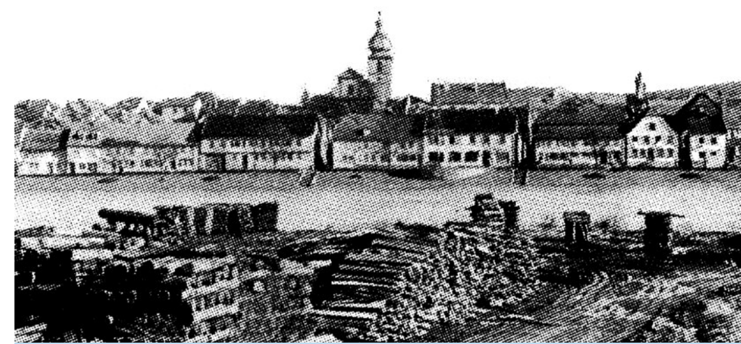
Blick von der Mainlände auf Marktheidenfeld um 1960

Unbedingt sollte man hinter dem Bahndamm die alte Furt und Fährstelle und die Mainlände aufsuchen. Von dort hat man einen idyllischen Blick auf Marktheidenfeld. Über Jahrhunderte und über den Bau der Brücke hinaus stellten Furt und Fähr die Verkehrsverbindung nach Westen in Richtung Aschaffenburg und Frankfurt sicher. An der Mainlände wurde bis in die 1960er Jahre hinein Holz aus dem Spessart gestapelt, das mit den Schiffen mainabwärts transportiert wurde.