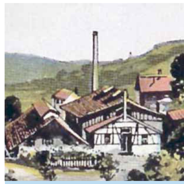
Die Ziegelhütte und die Tongrube in der Flurlage „An der Ziegelhütte“, (1834).