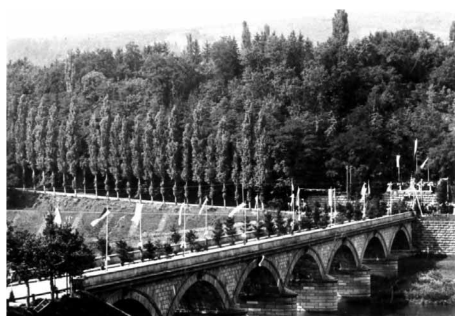
Die Einweihung des Denkmals für König Ludwig I. am 23. August 1896

Die heute nicht mehr erhaltene Inschrift in der Mauer lautete: „ Unter der glorreichen Regierung/ KOENIGS LUDWIG DES 1. VON BAYERN/ wurde die Brücke und Strasse erbaut/ und/ am XXVIII. Januar MDCCCXLVI festlich/ eröffnet “.