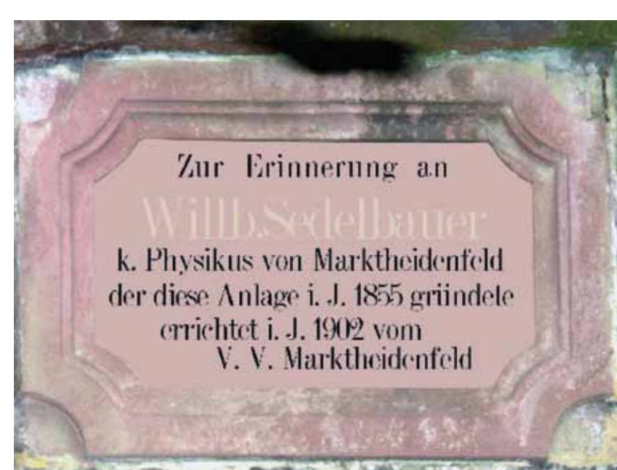
Gedenkstein für Willibald Sedelbauer in der Anlage, errichtet vom Verschönerungsverein

1882 entstand dort auch mit dem Bau eines Pavillons der berühmte Strohtempel. Aus dem Verschönerungsverein entwickelte sich 1925 mit dem 1920-25 bestehenden Spessartclub der Spessart- und Verschönerungsverein, der 1948 als Spessartverein wieder gegründet wurde und bis 2016 bestand.