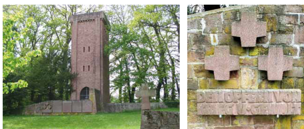
Vom Kriegerdenkmal zum Mahnmal