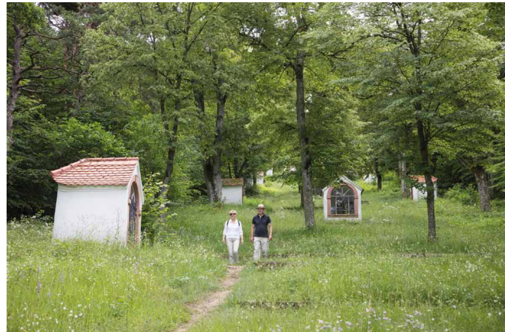
Gang durch die Kreuzwegstationen

1888 wurde dann das Projekt der Kreuzbergkapelle wieder aufgegriffen. Die Pläne von 1841 waren die Grundlage für die erneute Genehmigung 1889.