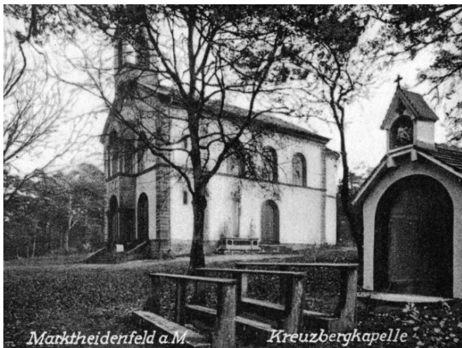
Ansichtskarte der Kreuzbergkapelle (vor 1938).

1839/40 wurde dann der Stationsweg u.a. mit Kastanien und Linden bepflanzt, die sich zum Teil bis heute erhalten haben. Den Abschluss sollte eine Kapelle, eine Wallfahrtskirche, bilden, für die bereits 1840 Pläne erstellt wurden.