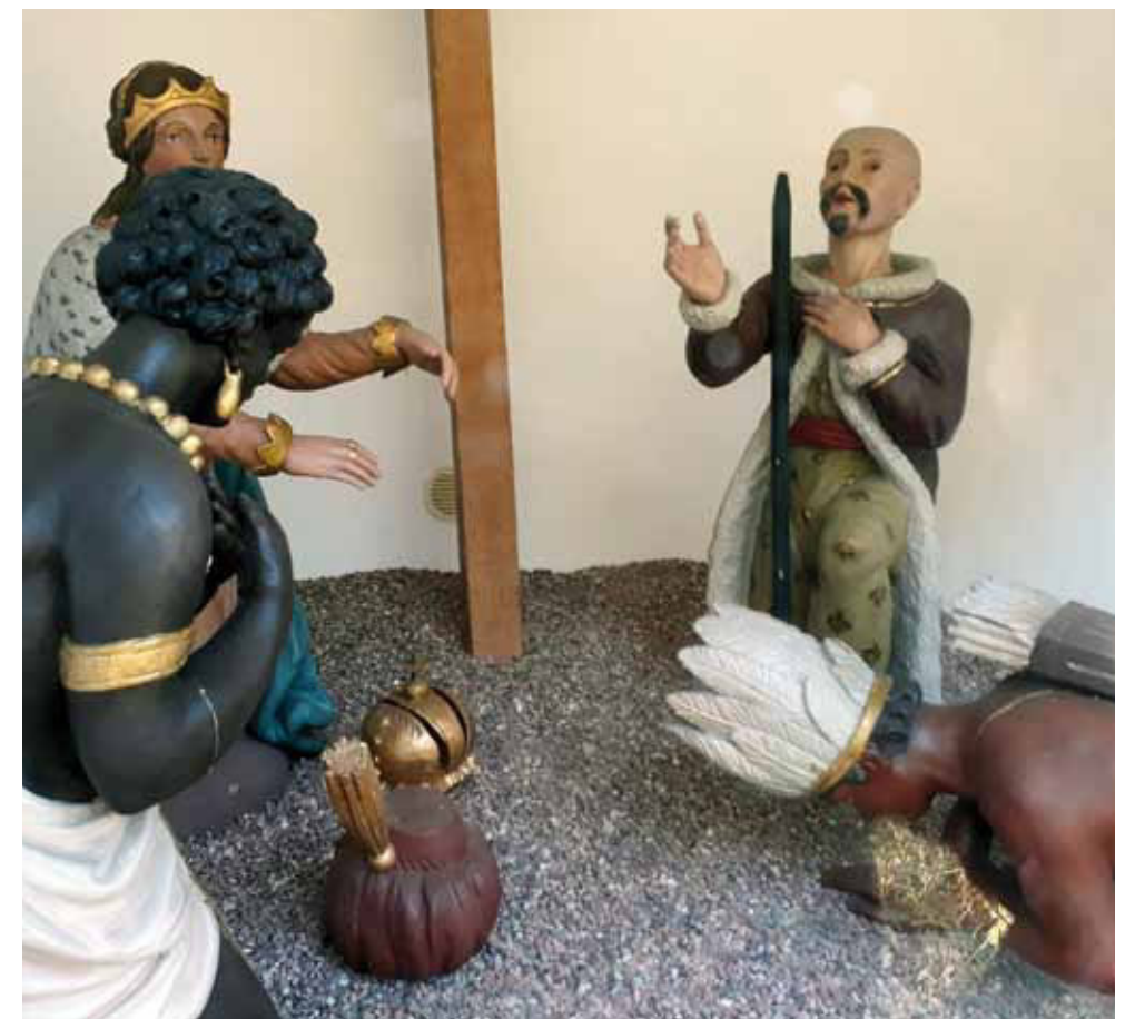
Die 15. Station: Verehrung des Kreuzes durch die vier Erdteile

1938 wurde die Kreuzbergkapelle umgestaltet. Der bisherige Altar wurde durch den aus der Kirche St. Bartholomäus in Waldbüttelbrunn stammenden Barockaltar mit den Figuren der Frankenheiligen Burkard und Kilian sowie der Apostelfürsten Petrus und Paulus ersetzt. Damals wurde auch die Kanzel aus Waldbüttelbrunn mit den Darstellungen der drei christlichen Haupttugenden, Glaube, Hoffnung und Liebe, erworben. Für den Treppenaufgang zur Kanzel und für eine Sakristei wurde ein Anbau errichtet. Die beim Bau der Kapelle entfernte Kreuzigungsgruppe fand ursprünglich an der rechten Kirchenwand einen neuen Platz. Heute steht sie rechts neben der Kapelle. Unweit davon befinden sich eine Holzfigur des hl. Laurentius, die Erich Gillmann anfertigte, und eine Maria gewidmete Feldkapelle. Der Stationsweg und die Kreuzbergkapelle stehen auf dem Grund und Boden der Stadt Marktheidenfeld.