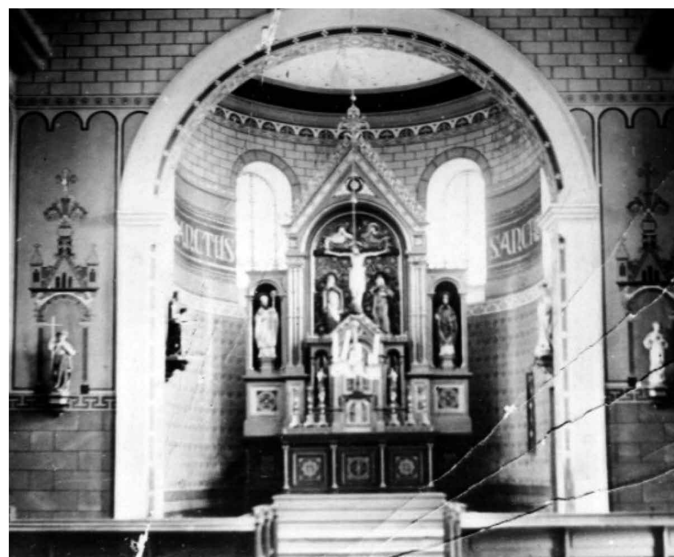
Die ursprüngliche und die aktuelle Ausstattung der Kreuzbergkapelle

1842 wurde die Genehmigung zum Bau erteilt, der aus finanziellen Gründen aber nicht verwirklicht werden konnte. Den Abschluss bildete wohl seit 1824 ein Kreuz bzw. seit etwa 1837 eine Kreuzigungsgruppe von