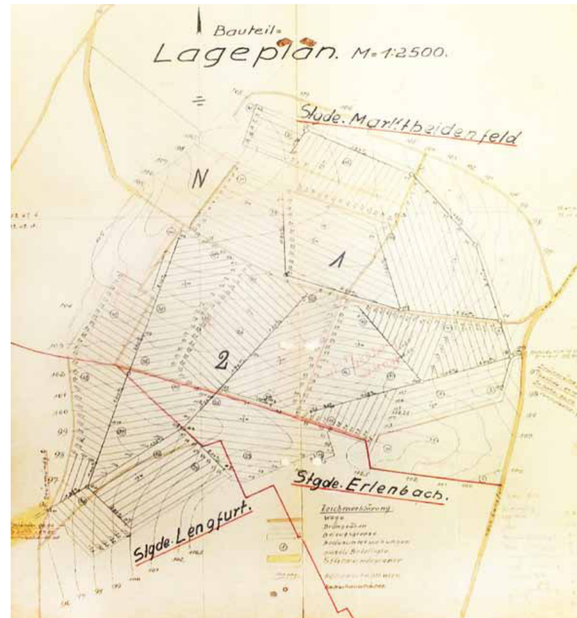
Lageplan für die Entwässerung des Dillbergs (1938)

Die Hochebene auf dem Dillberg war im Besitz der Gemeinde und wurde den Gemeindebürgern zur Bewirtschaftung überlassen.