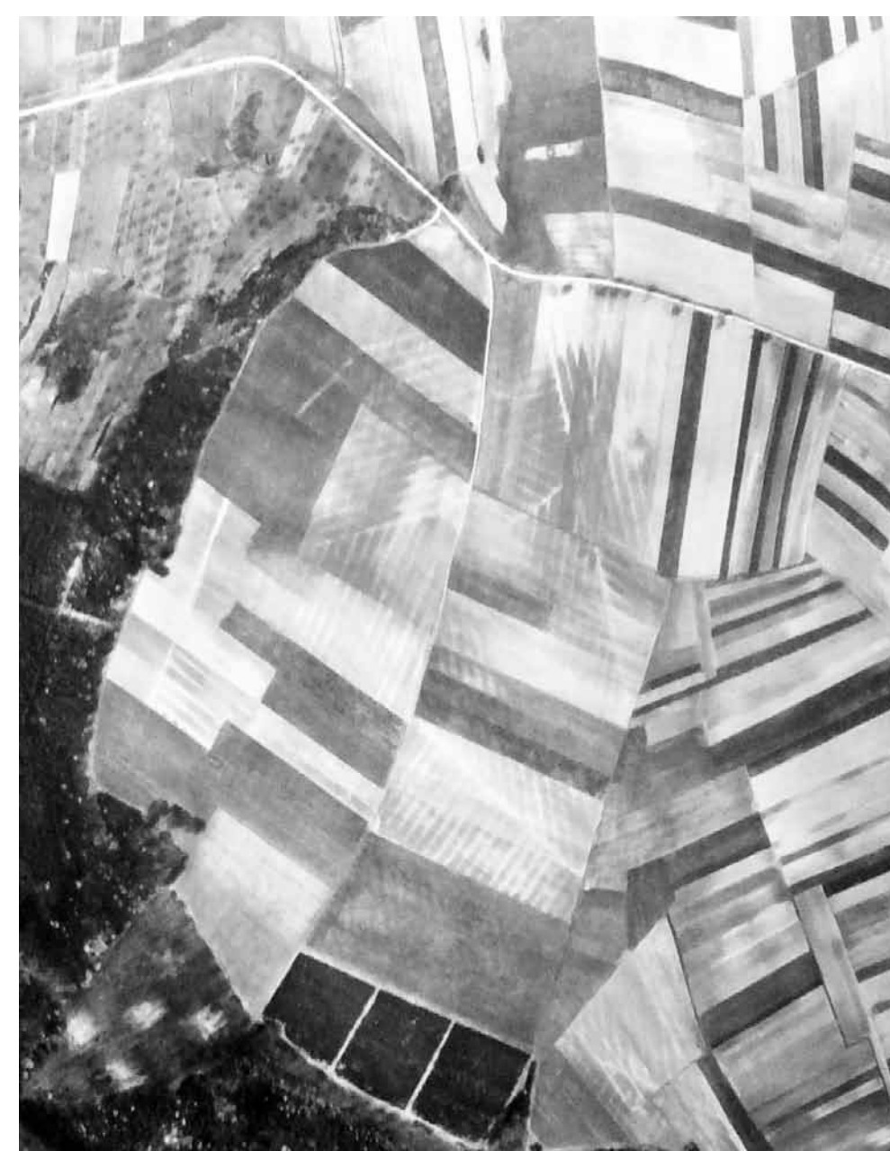
Ausschnitt aus einer Luftaufnahme vom 21. März 1961. Diese Aufnahme zeigt, bedingt durch die unterschiedliche Durchnässung, die auf dem Dillberg verlegten Drainageleitungen, die an der Lengfurter Straße in den Wildsgrundgraben eingeleitet werden. Rechts: Gedenkstein am Dillberg.

für den 1956 die Anlage eines Militärflugplatzes und 1978 die Ansiedlung einer Justizvollzugsanstalt angedacht waren, von 1978 bis 1990 als Gewerbegebiet erschlossen.