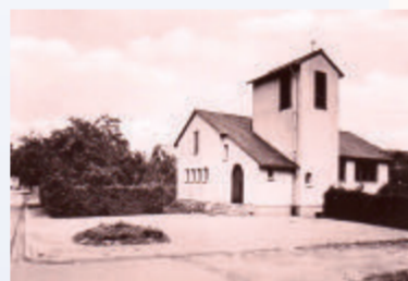
Die evangelische Markuskirche nach dem Bau 1955 und heute (2016).

Der Ortsrundgang (Länge von ca. 3 km) beginnt hier und führt Sie unterhalb des Wingerts zum Bahnhof und an das Heimatdenkmal. Danach überschreiten Sie den 50. Breitengrad und erreichen den alten Ortskern mit der Musikschule (ehemals Kirche und Rathaus) sowie die neu erbauten Kirchen von Kleinostheim.