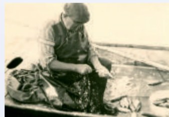
Durch den Neubau der Kleinostheimer Schleuse wurde der Wasserspiegel des Mains um ca. 2,5 m angehoben. Damit sind der »Fischerbau« und die Einmündungen der Schwanengasse sowie der Lindengasse im Main verschwunden. Eine Anlegestelle am Kleinostheimer Ufer gibt es nicht mehr.

Am neuen Urnenrasenfeld steht auf einem Sandsteinfindling das ehemalige Turmkreuz, das 1712 bis 1992 das Gebäude der heutigen Musikschule zierte.