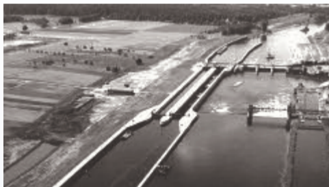
Die neu gebaute Schleuse aus der Luft um 1970