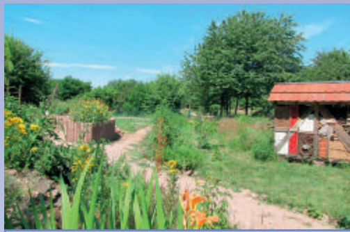
Im Naturerlebnispfad des LBV