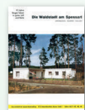
Werbebrochure für die Waldstadt und Blick in eine Straße der Siedlung im Jahre 2016