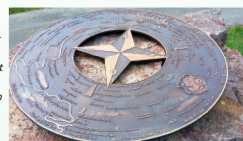
Die Panoramaplatte des Johannesberger Geschichtsvereins erläutert den Blick von Sternberg aus in alle Himmelsrichtungen.