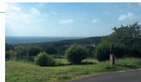
Blick von Sternberg hinunter in das Rhein-Main-Gebiet

Die Route durch die Rückersbacher Schlucht führt hinauf nach Sternberg zu einem Panoramablick über das Rhein-Main-Gebiet. Auf dem Rückweg kommen Sie an der Schutzhütte und am Waldsee vorbei. Über eine Schleife können Sie die Siedlung Waldstadt am Spessart kennenlernen.