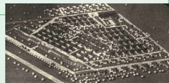
Modell der Waldstadt

In den 1960er Jahren wurden am Rande der Ballungsgebiete auf freiem Feld oder im Wald Siedlungen errichtet, die die Zukunft des Wohnens verhiessen – nah an der Stadt und doch in der Ruhe auf dem Land. Zielgruppe waren gut situierte Menschen, die im Rhein-Main-Gebiet – besonders am expandierenden Flughafen – arbeiteten. So entstand in Kleinostheim der Plan einer Siedlung »Waldstadt am Spessart« mit dem Slogan »Zehn Jahre länger leben in guter Luft und Ruhe«, der auch der Titel des Kulturweges ist. Zwischen 1961 und 1966 entstanden 132 Bungalows sowie 56 Reihenhäuser, die für Kleinostheimer Bürger errichtet wurden.