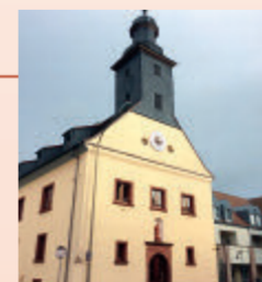
Die Schulgebäude von 1793 und 1874 wurden um 1990 abgerissen. Die alte Kirche dient heute dem Musikunterricht.