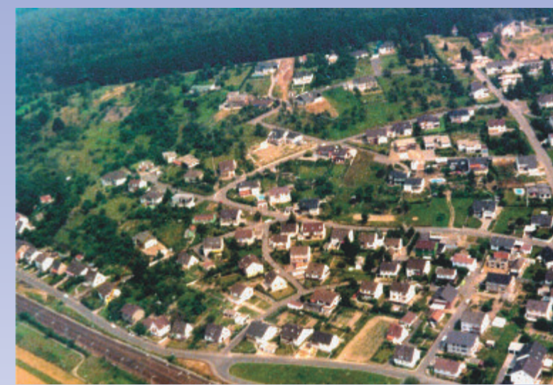
Blick auf den bebauten Wingert, den ehemaligen Weinberg im Jahre 1978