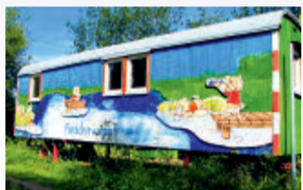
Jährlich lädt der LBV zu attraktiven Veranstaltungen ein und bietet eindrucksvolle Erlebnisse und Exkursionen in die Natur.