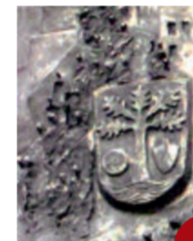
Detail des Heimatdenkmals