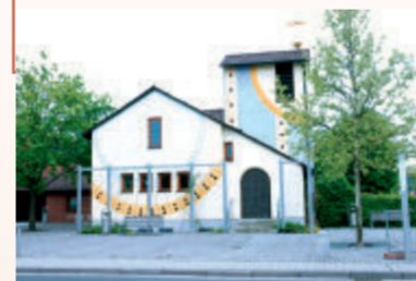
Die 1948–51 erbaute neue katholische Laurentiuskirche.