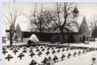
Aussegnungshalle und Urnenmauer zeigen Werke des Aschaffener Künstlers Siegfried Rischar.

Die Mainroute kann auch am Friedhof begonnen werden. Hier lohnt ein Blick auf die künstlerische Gestaltung der alten und der neuen Aussegnungshalle sowie der Urnenwand. Auch der Fundamentrest der ältesten Kirche Kleinostheims und das Massengrab der Opfer der Bombardierung vom 21. Januar 1945 sind hier zu sehen.