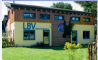
Der LBV-Naturerlebnispfad und das Bernd Hofer-Haus befinden sich am Rande des Sport- und Freizeitgeländes der Kleinostheimer Vereine.

Die Route in der Mainlandschaft führt Sie vom Friedhof über die Schleuse zur Umweltstation des Landesbundes für Vogelschutz (oder umgekehrt). Der „Naturerlebnispfad“ befindet sich am Rande des Sport- und Freizeitgeländes der Kleinostheimer Vereine, das ab 1980 im Bereich aufgefüllter Kiesgruben eingerichtet wurde. Die Umweltstation des LBV ist Partner im Netzwerk „Umweltbildung.Bayern“ und bietet eine breite Palette von Aktionen und Veranstaltungen im Rahmen der Bildung für nachhaltige Entwicklung. In dem abwechslungsreichen 4,2 ha großen Gelände können die Gäste mit und ohne fachkundige Betreuung die Natur in vielfältiger Art und Weise erleben. Seit 2008 rundet das nahegelegene Bernd Hofer-Haus die Angebote ab. Dort finden Vorträge, Versammlungen und Workshops statt.