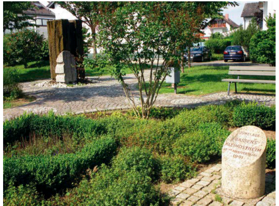
Partnerschaftsdenkmal am Goetheplatz

Am 13. Juni 1980 wurden die Partnerschaftsurkunden unterzeichnet.