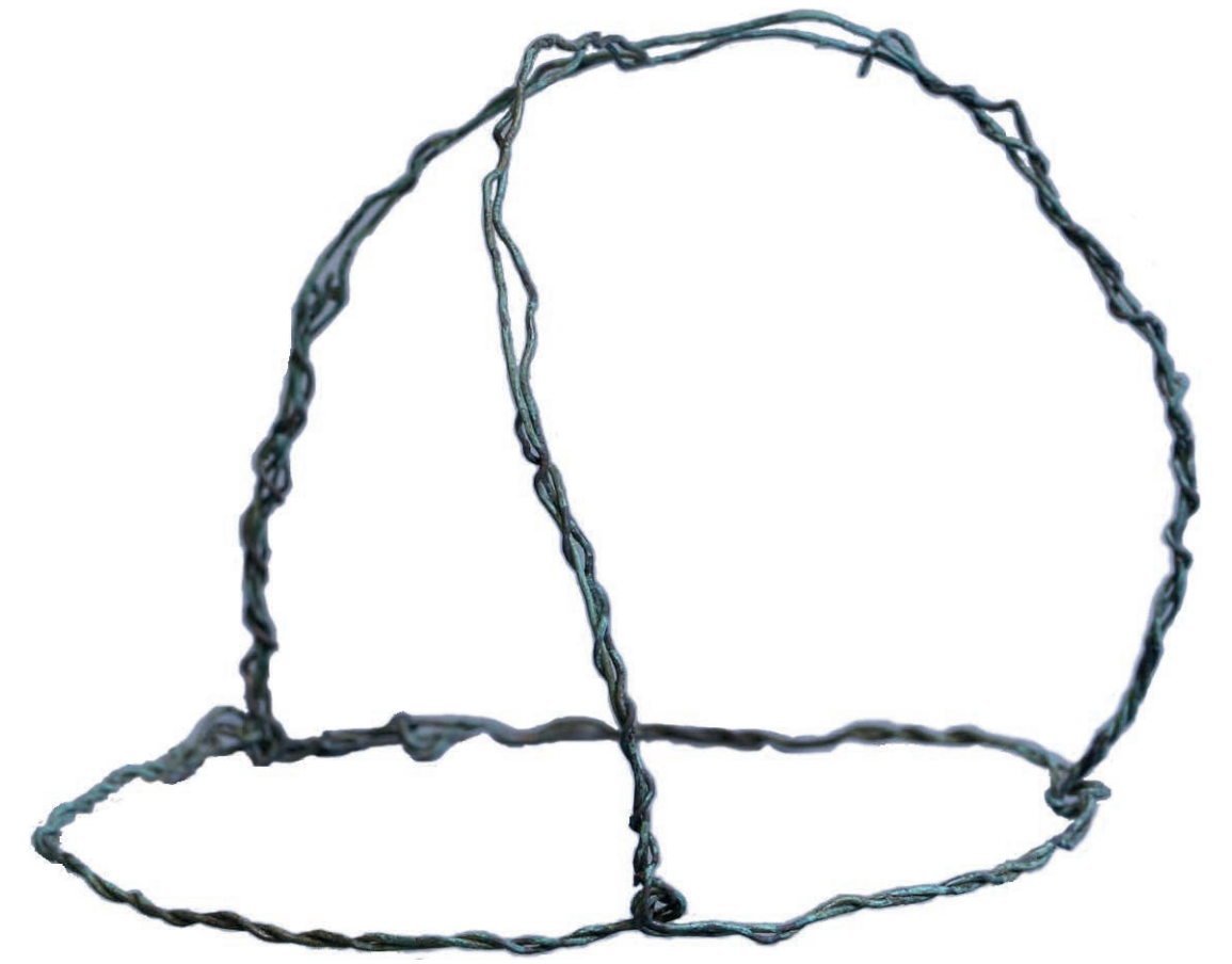
Das feine Drahtgeflecht aus Messing (Dm: 13,5 cm) trug einst Blumen für ein krönenförmiges Gesteck.

Einige Funde stammen aus dem Bereich der Bestattungen. Hier ist zum einen der Draht eines krönenförmigen Blumengestecks zu nennen. Ein weiterer Fund der aus einem Grabzusammenhang geborgen wurde, ist ein Münzhort. Er besteht aus 76 Münzen aus der Präge in Schwäbisch Hall. Wegen der für diese Münzen typischen Darstellung einer Hand auf einer Seite, werden sie Handheller genannt.