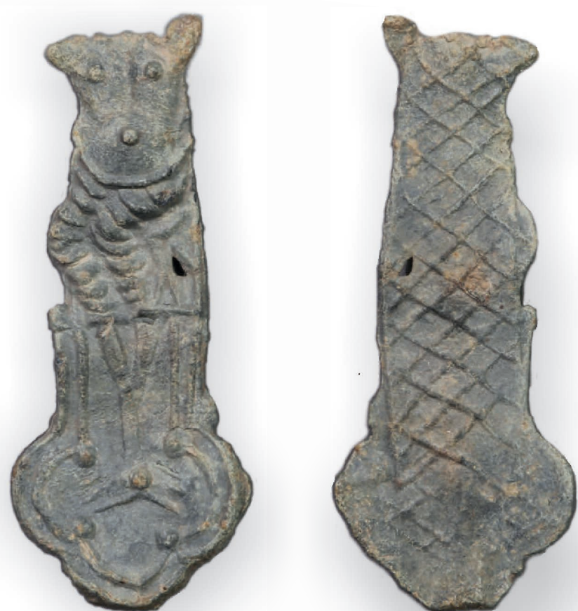
Eines von mehreren im Kloster aufgefundenen Pilgerzeichen in Form eines Gekreuzigten.

Unter den Keramikfragmenten, die sich in erster Linie Koch- und Schankgefäßen zuweisen lassen und von denen einige in Dieburg gefertigt wurden, sind die Fragmente von mehreren Aquamanilen zu nennen. Aquamanilen sind Gießgefäße, meist in Tierform, die bei der Handwaschung verwendet wurden. Die Handwaschung war ursprünglich Teil des Gottesdienstes / der Liturgie, fand aber bald auch Eingang in das höfische Leben, etwa an der Tafel.