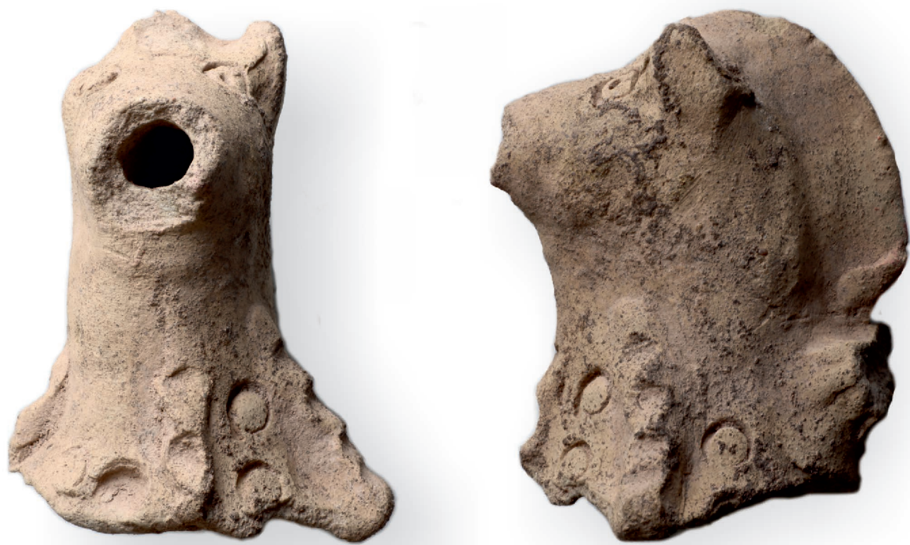
Das Fragment eines unglasierten Gefäßes zur Handwaschung (= Aquamanile)

Die archäologische Untersuchung des Klosters Elisabethzell brachte neben vielen, in dieser Art nicht erwarteten Mauerresten auch zahlreiche Funde zu Tage. Die etwa 1.400 Funde weisen ein breites Spektrum auf. Zeitlich decken sie die gesamte Besiedlungszeit von der Rodungsinsel aus dem ersten Drittel des 13. Jahrhunderts bis zur Aufgabe des Areals im Jahre 1333. Sie geben uns Auskunft über das weltliche und geistliche Leben im Kloster. Die Funde reichen von unterschiedlichen Keramiken über Eisen, Glas, Knochen, Buntmetall, Steinobjekten, Mörtel und Wandverputz bis hin zu Silbermünzen. Dank der Feuchterhaltung in den Brunnen sind auch organische Funde auf uns gekommen. Einige besondere Funde sollen hier vorgestellt werden: