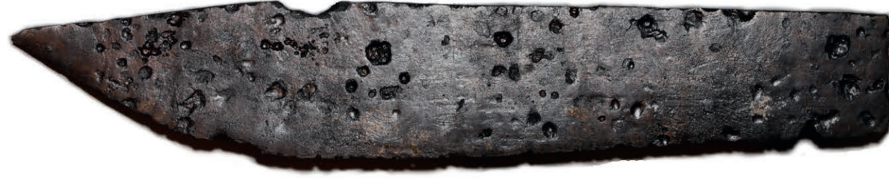
Von beachtlicher Größe, wenn auch nicht komplett erhalten: die Klinge eines Fuhrmannmessers (Höhe: 4,6 cm, Länge: 26,5 cm)

Als Metallfunde sind neben Nägeln, Haken, Bolzen und Eisenblechen vor allem die 44 Messer und Messerfragmente zu nennen. Unter diesen ist auch die abgebrochene Klinge eines Fuhrmannmessers. Diese besonders breite und lange Klinge gibt neben Achsnägeln und verschiedenen Hufeisen Zeugnis von der Anwesenheit von Fuhrleuten im Kloster.