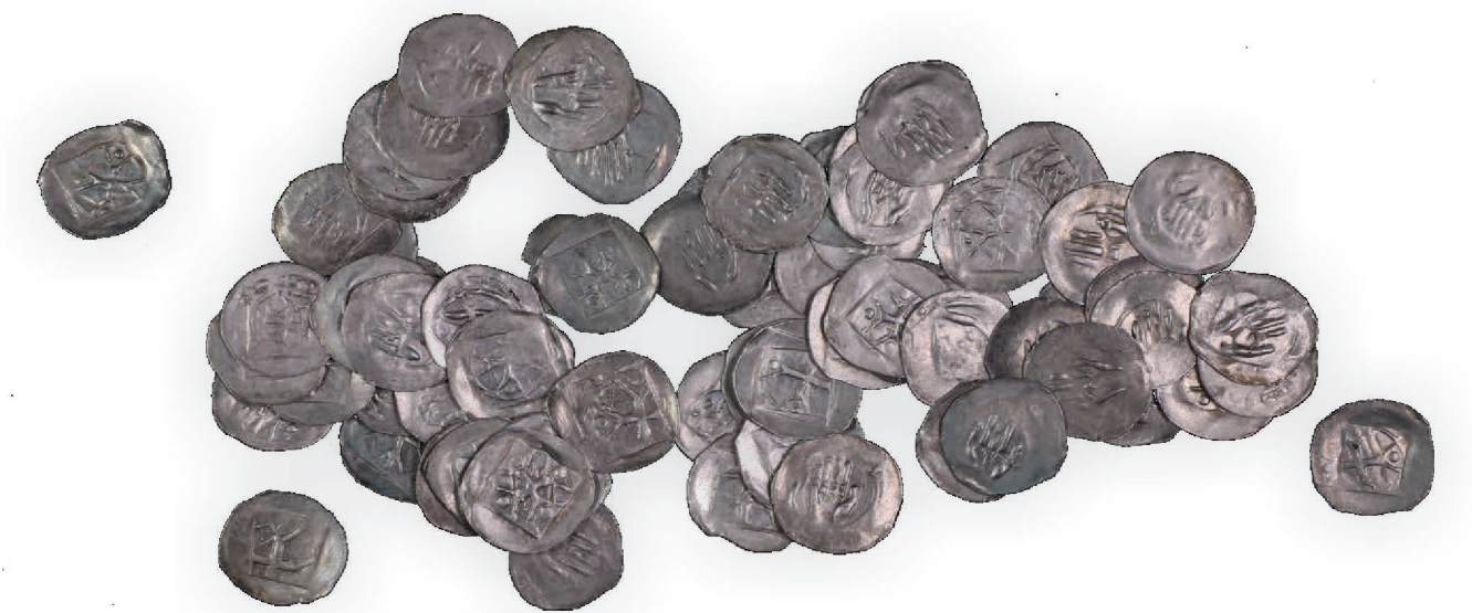
Der um 1300 angelegte Münzhort nach seiner Restaurierung

Einige Funde stammen aus dem Bereich der Bestattungen. Hier ist zum einen der Draht eines krönenförmigen Blumengestecks zu nennen. Ein weiterer Fund der aus einem Grabzusammenhang geborgen wurde, ist ein Münzhort. Er besteht aus 76 Münzen aus der Präge in Schwäbisch Hall. Wegen der für diese Münzen typischen Darstellung einer Hand auf einer Seite, werden sie Handheller genannt.