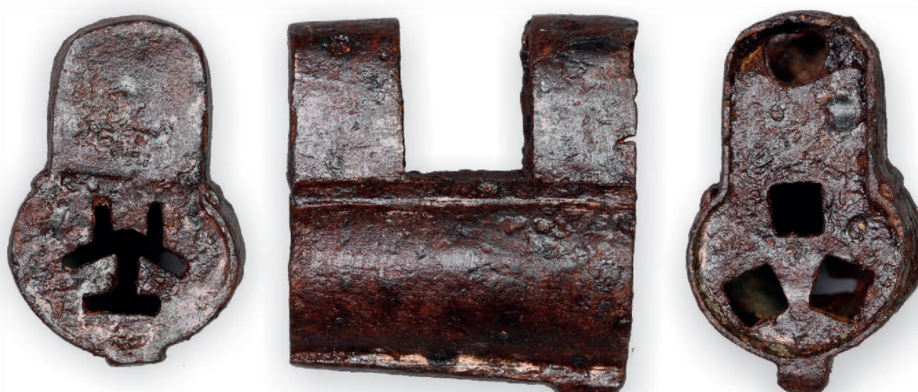
Vorhängeschloss, gefunden im Prioratsgarten, in drei Ansichten. Es versperrte hölzerne Truhen, die den wertvollsten Besitz (hier des Priors) verwahrten.

Ebenfalls ihm gehörten ein gut erhaltenes metallenes Vorhängeschloss und ein Buchschloße aus Messing. Sie bezeugen, wie auch die Kachelöfen und Aquamanilen, einen gehobenen Wohnstandard und weisen auf ein Bildungsniveau, wie es in dieser Abgeschiedenheit nicht zu erwarten ist. Dazu zählen auch mit Schwarzlot bemalte Fenster und Reste von gläsernen Öllampen. Sie sind der Kirchenausstattung zuzurechnen.