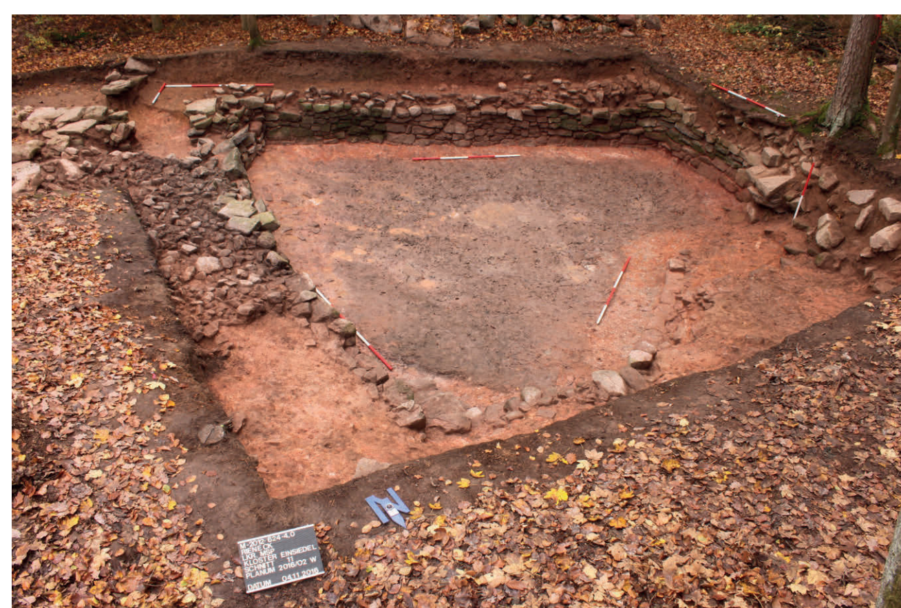
Blick auf den mittelalterlichen Teich in der Südwestecke des Klosters

In dieser Phase kamen die zwei zum Teil unterkellerten Fachwerkbauten südlich der Kirche sowie der Gebäudekomplex im Westen der Anlage hinzu. Dieser umfasste einen ausgemauerten Keller sowie ein Steinernes Haus mit ummauertem Gärtchen. Südwestlich davon