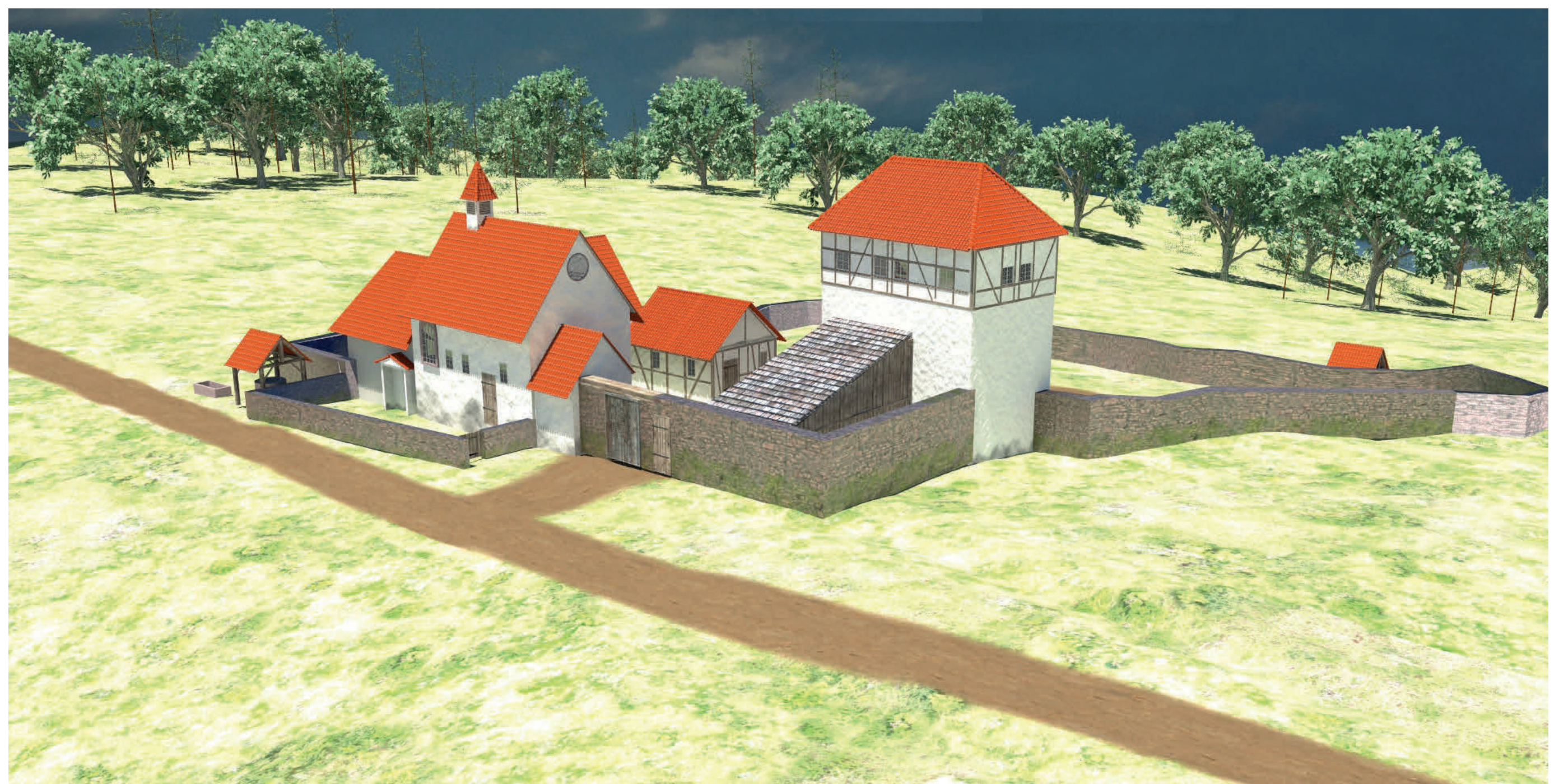
Rekonstruktionszeichnung der Klosteranlage um 1300 (© ToBo Media Production & IT Service GdB R Kroth Torsten, Prinzisky Boris, Heimbuchenthal 2018)

befindet sich im Nordosten der Anlage und war, neben Kapelle und Grubenhäusern, eines der ersten Bauwerke auf der Rodungsinsel. Mit zunehmender Frequenzierung des Fernweges wuchs die Infrastruktur, fassbar im Ausbau der Kirche, und damit einhergehend die Zahl der hier tätigen Menschen. Der Wirtschaftsstandort begann sich zu entwickeln. In diesem Zuge wurde der Friedhof mit einer steinernen Mauer neu eingefasst. Auch ist zu vermuten, dass von herrschaftlicher Seite eine Kontrolle der Straße bestand, eventuell verbunden mit der Erhebung von Wegezoll. Die Lage an einem Nadelöhr we-