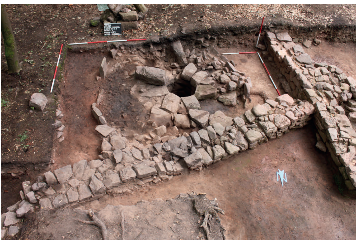
Der als eines der ersten Bauwerke errichtete Brunnen bei seiner Freilegung im Jahr 2013

Kernfunktion der Straßenstation dürfte von Beginn an die leibliche wie seelische Versorgung der Reisenden der Fernstraße dargestellt haben. Zu deren Erfüllung war ein Brunnen als ausschlaggebender Standortfaktor zwingend notwendig. Der rund sechs Meter tiefe Schacht