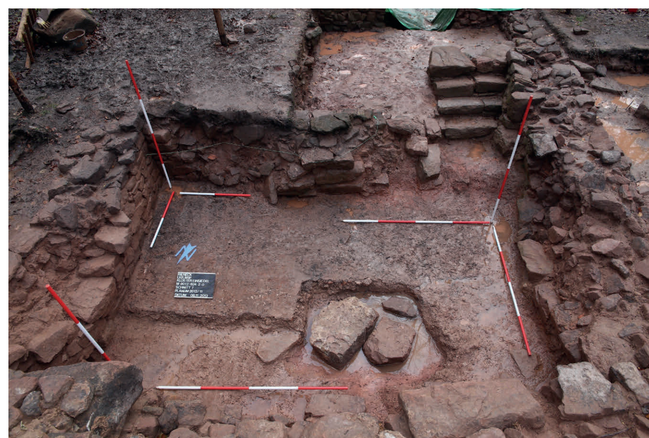
Blick in den Keller des Fachwerkhauses des Mönchstraktes im Jahr 2013

nige Kilometer vor einer wichtigen Mainfurt wäre hierfür jedenfalls prädestiniert. Schließlich wurde der Betrieb der Straßenstation offenbar so aufwändig, dass die Grafen von Rieneck ihn in fremde Hände geben mussten. Sie entschieden sich für den im Spitalwesen erfahrenen Orden der Prämonstratenser. Vermutlich begann erst mit dieser 1295 erfolgten Schenkung der groß angelegte Ausbau zu einem Kloster, in dem sich geistliches und weltliches Leben, religiöse Einker und Handel, Gottesdienst und Herrschaft auf so erstaunliche Weise trafen.