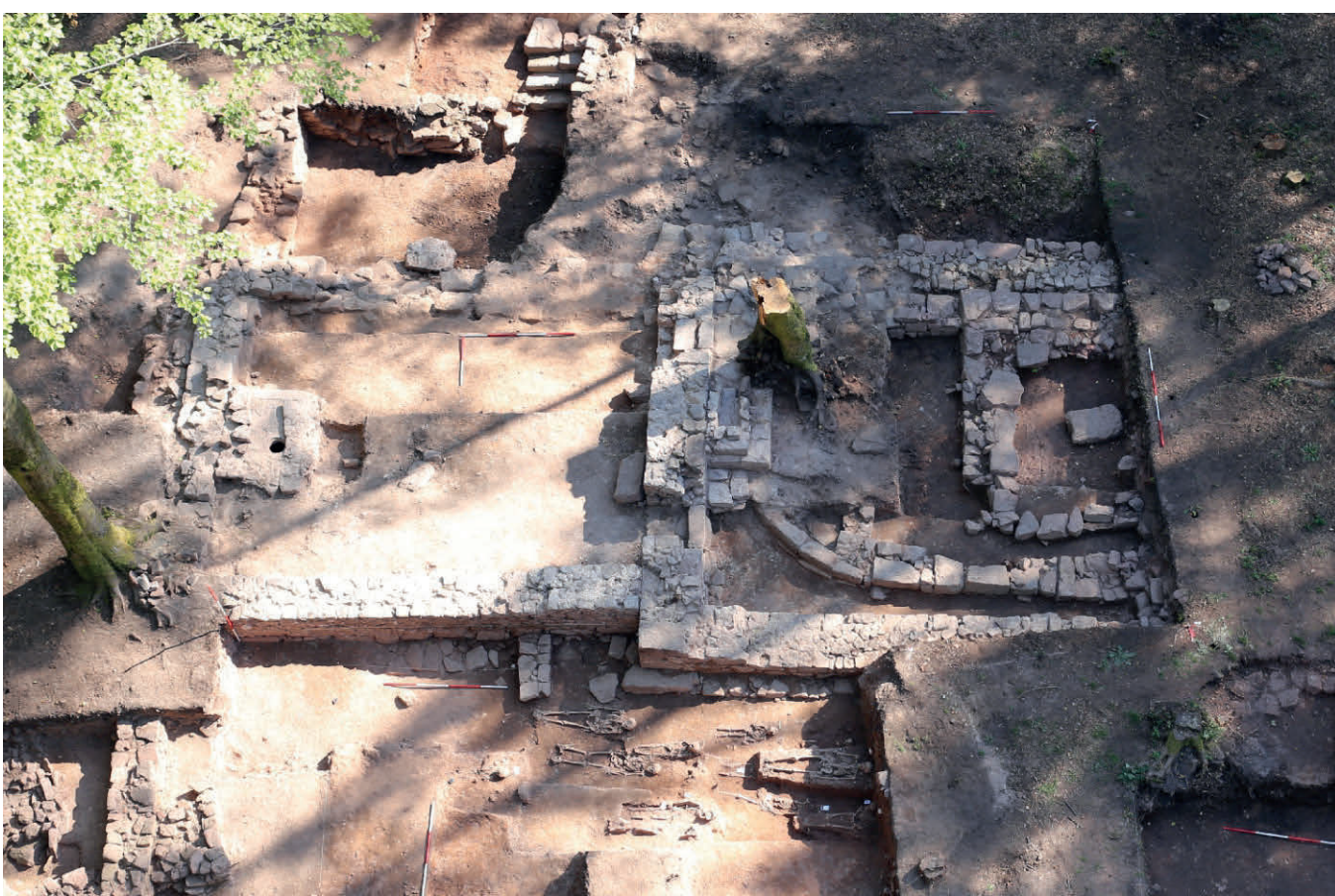
Die Kirchenfundamente nach ihrer Sichtbarmachung im Herbst 2015

Von den Grafen von Rieneck war im ersten Drittel des 13. Jahrhunderts an der Birkenhainer Straße eine Rodungsinsel angelegt worden, auf der sie eine kleine Straßenstation gründeten. Diese bestand aus einer Kapelle und mehreren Grubenhäusern in unmittelbarer Nachbarschaft. Die einfache Kapelle wurde im Laufe der Zeit zu einem etwa 24 m langen Kirchenbau mit Vorhalle, Hauptraum und separatem Rechteckchor erweitert.