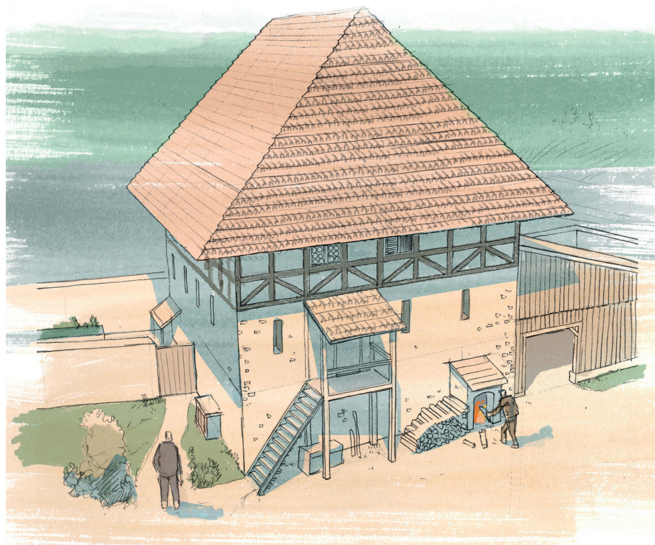
Rekonstruktion des Steinernen Hauses im Klosters Elisabethenzell, Zustand vor 1330

Steinerne Haus des Klosters Elisabethenzell war wie das in Amorbach nicht über das Erdgeschoss begehbar. Der Zugang erfolgte, ähnlich mittelalterlichen Bergfrieden, mittels einer Treppe über das erste Obergeschoss. Dadurch sollten Tiere aus dem Haus gehalten werden. Den Abschluss des Hauses bildete ein steiles, ziegelgedecktes Dach.