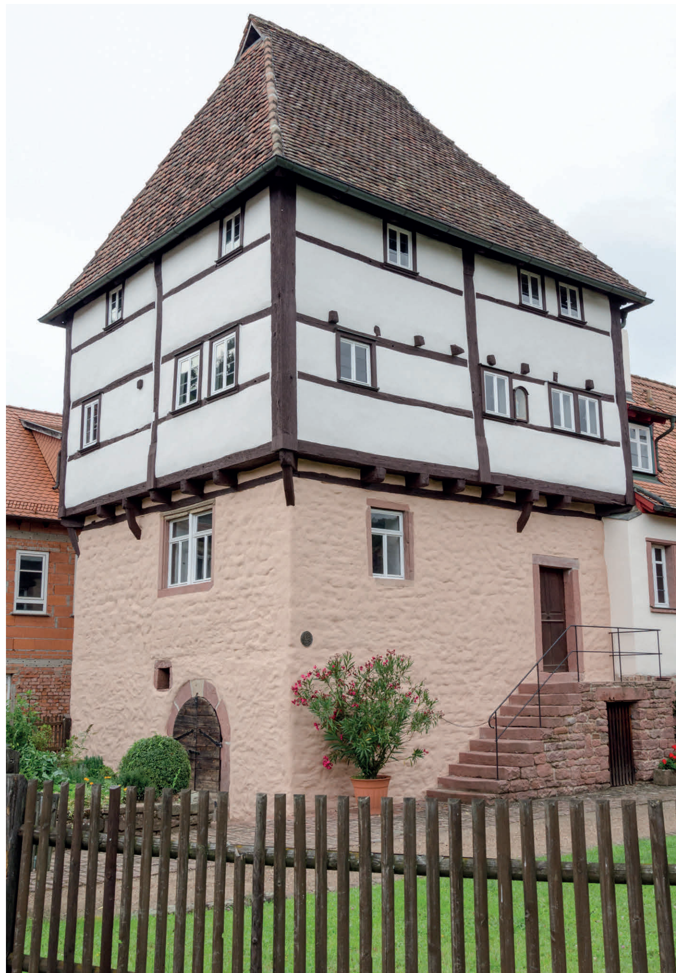
Das Templerhaus in Amorbach: ein Steinernes Haus aus dem ausgehenden 13. Jahrhundert.

Über das Aufgehende des Gebäudes lassen sich aufgrund des Erhaltungszustandes nur Vermutungen anstellen: Anhand des Befundes ist zu schließen, dass das Erdgeschoss vollständig aus massiven Steinmauern errichtet war. Die breiten Mauern sprechen dafür, dass auch das erste Obergeschoss steinerne Mauern aufwies. Das zweite Obergeschoss dürfte, ähnlich dem Templerhaus in Amorbach, in Fachwerk aufgeführt gewesen sein. Das