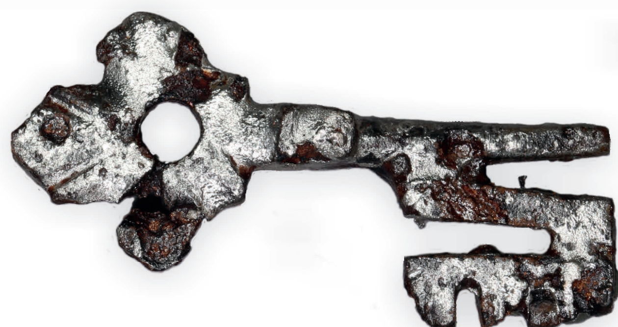
Versilberter Schlüssel, um 1330

Das Steinernes Haus entstand im letzten Drittel des 13. Jahrhunderts, also als die Kirche auf ihre letzte Form erweitert wurde. Zuvor stand an seiner Stelle ein einfaches Grubenhaus, in dem ein Bronzegießer tätig war. Die Idee, ein Steinernes Haus auf eine Rodungsinsel inmitten des Spessarts zu setzen, weist darauf hin, dass die Bewohner des Steinernen Hauses eine hohe soziale Stellung innehatten. Dies wird durch entsprechende Funde noch bekräftigt: die Warmluftheizung, der sie später ersetzende Kachelofen, ein Reitersporn sowie der versilberte Schlüssel eines eisernen Vorhängeschlosses.