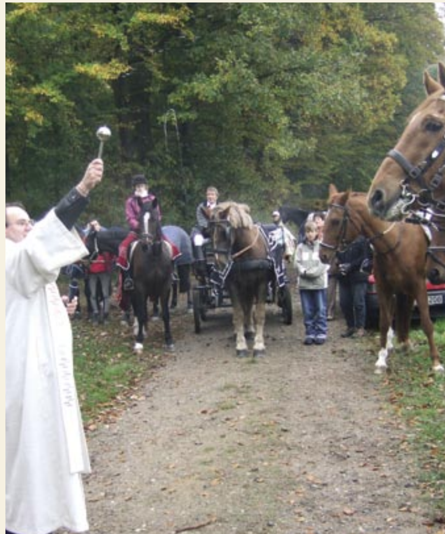
Am Wendelinustag erhalten auch Pferde und Reiter den Segen.