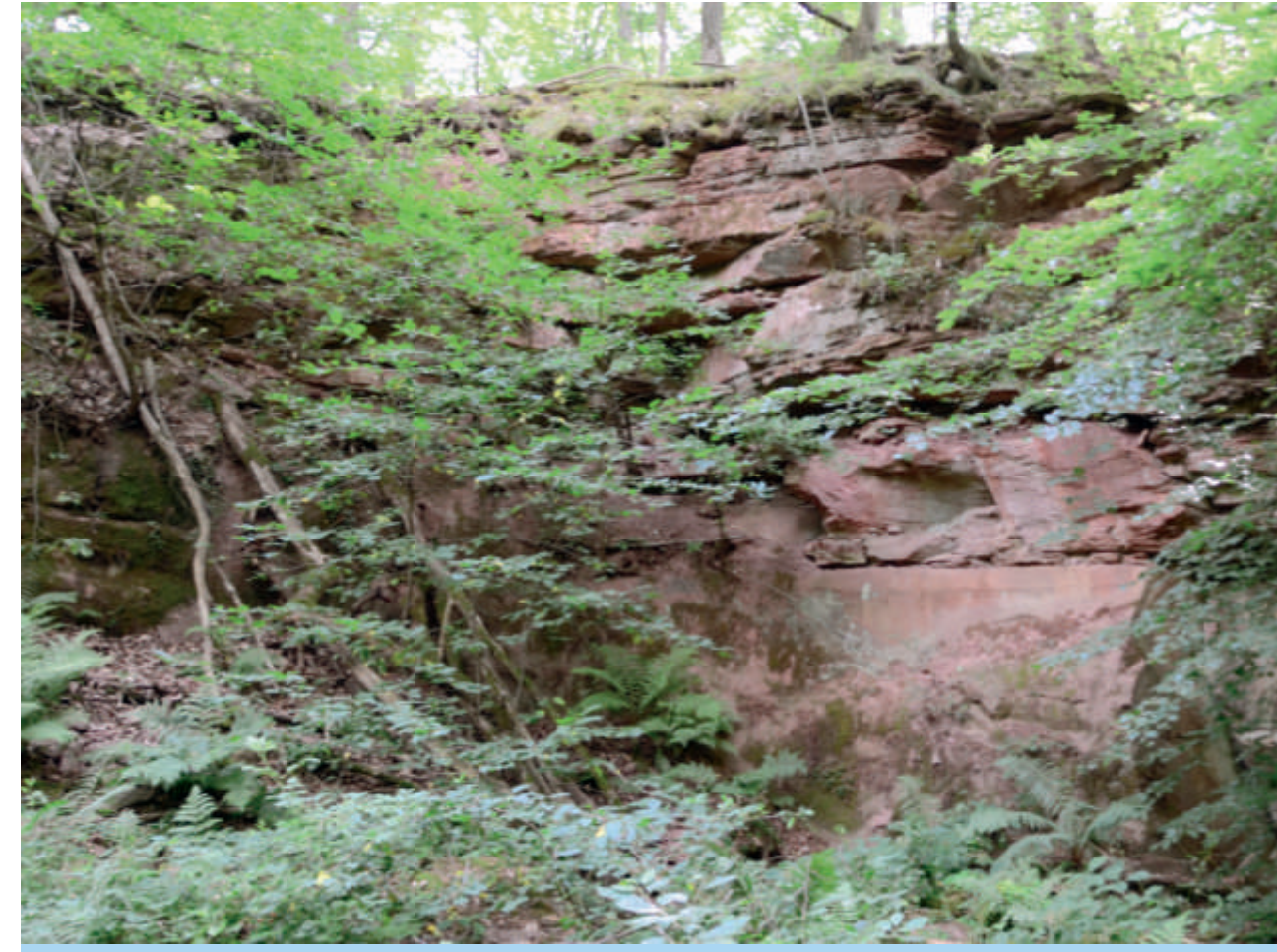
Der Leipoldsteinbruch im Wald (liegt nicht am Kulturweg)

In Zimmern steht oberhalb der Steilhänge der Sandstein nur wenige Meter unter dem Erdboden an. Daher gab es hier zahlreiche Sandsteinbrüche. 1824 wird das Dorf unter den Gemeinden aufgezählt, wo man „berühmte, rothe Sandsteine“ bricht, die „als Handelsartikel weit verführt werden.“ 1964 wurden offiziell sieben alte Steinbrüche erfasst. Die Steinbrüche