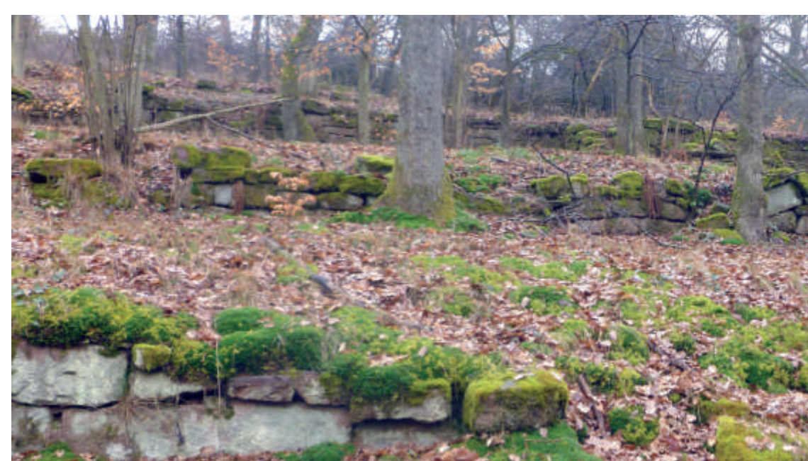
Alte Weinbergsmauer am Neuen Berg

In Zimmern folgte wie überall im westlichen Unterfranken dem Niedergang des Weinbaus der Obstanbau. Auf den ehemaligen Weinbergterrassen wurden vorwiegend Apfelbäume gepflanzt. Der Apfelwein, den man in dieser Gegend als „Moust“, d.h. Most, bezeichnet, löste bis zur Mitte des 20. Jahrhunderts den Wein als Alltagsgetränk ab. Heute sind die alten Weinberge Wohnbaugebiete oder überwuchert und verwildert.