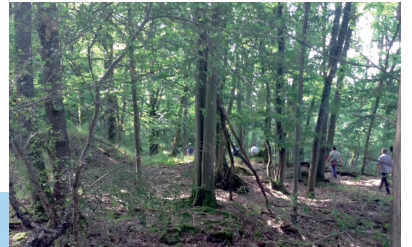
Der Becklessteinbruch, durch den der Kulturweg führt.

Aus den örtlichen Sandsteinen sind die Gebäude am Ort errichtet worden, besonders die Kirche und die ehemalige Schule, aber ebenso die an den wichtigen Wegverbindungen errichteten Bildstöcke und besondere Ziersteine an den Häusern.