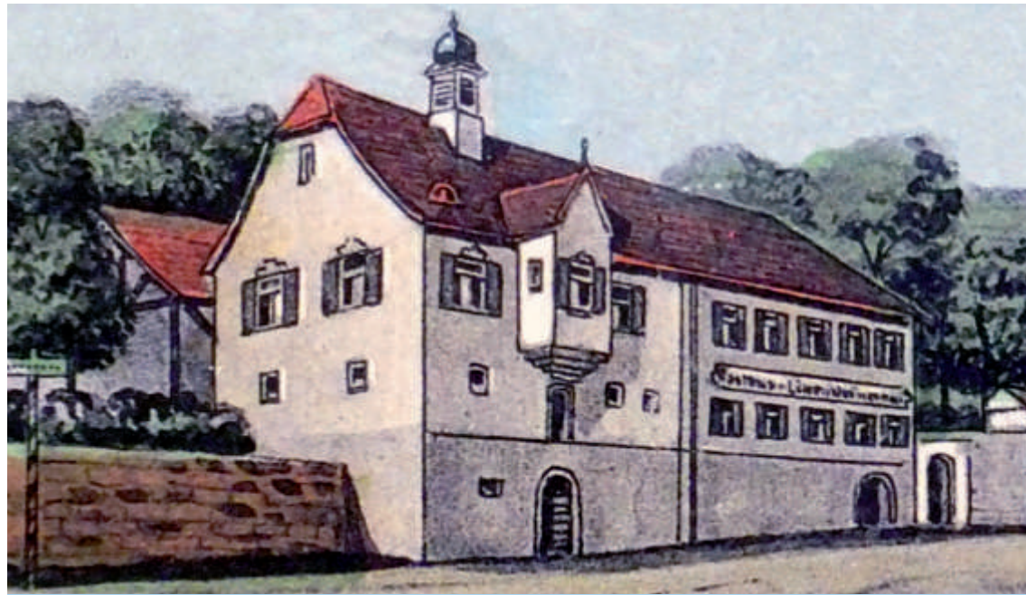
Der Löwensteiner Hof um 1910 und die „Sonne“. Ausschnitt aus einer kolorierten Postkarte, um 1910.

Von der günstigen Lage als Rothenfelser Brückenkopf profitierten die Zimmerner Gastwirte, früher der Löwensteiner Hof und bis heute die bestehende Gastwirtschaft Scheiner (Sonne).