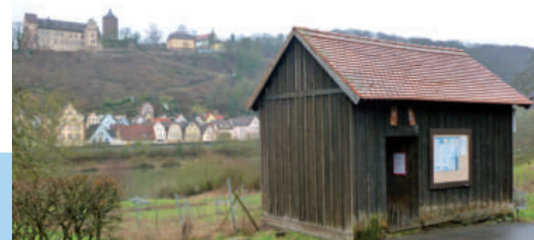
Das alte Fahrhäuschen wird heute als Bushäuschen genutzt.

auf den Fahrwiesen der Rothenfelser Dreschplatz und der Sportplatz. Die Stilllegung des schließlich defizitären Fährbetriebs zwischen Zimmern und Rothenfels 1964 kappte die letzte öffentliche Verbindung.