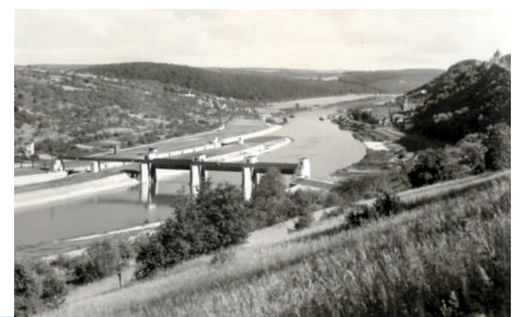
Die Veränderungen der Landschaft durch den Schleusenbau machen die beiden Ansichtskarten von ca. 1933 und ca. 1936 deutlich.