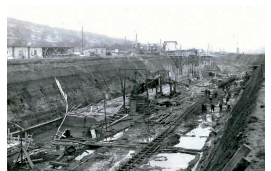
Bilder vom Schleusenbau: Von 1933 bis 1935 wurde zunächst der Freiwillige Arbeitsdienst, dann der Reichsarbeitsdienst eingesetzt.