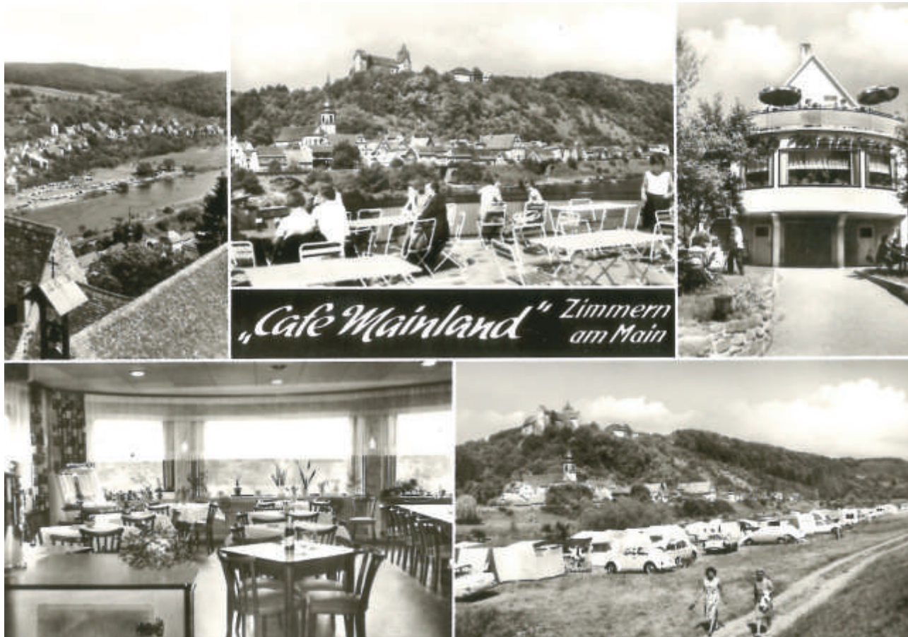
Ansichtskarte vom „Mainland“ um 1960, rechts unten der Campingplatz am Mainufer

schließlich mit den Aktivitäten auf der Burg Rothenfels, die 1919 von der katholischen Jugend- und Reformbewegung „Quickborn“ erworben wurde. Nach 1945 kamen in Zimmern Campingplatz und Ausflugsgaststätten hinzu. Das bereits in den 1960er Jahren geschlossene Restaurant Waldblick bzw. Haus Martha im Rödertal und vor allem das direkt am Main gelegene Café Mainland sind hier zu nennen. Das von der Sonne begünstigte Zimmern wurde somit, schließlich unabhängig von Rothenfels, zum Fremdenverkehrsort. Heute profitiert die Zimmerner Gastronomie vom Maintal-Radweg.