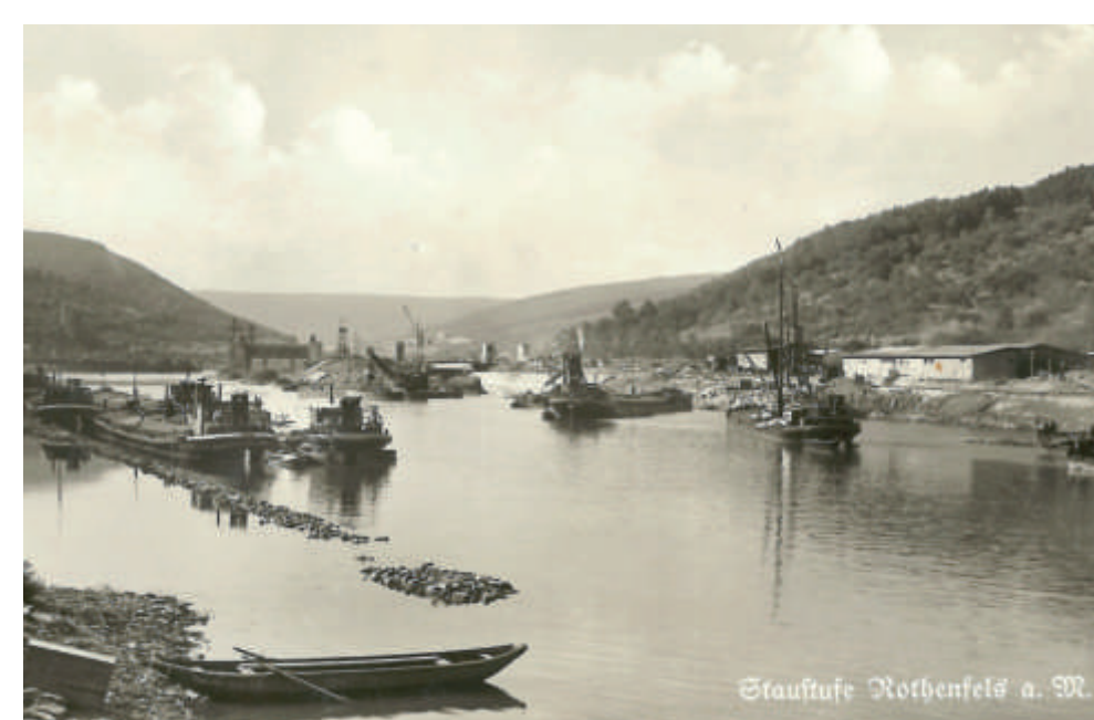
Staudamm Rothenfels a. 1932

Viele der bei der Mainregulierung im 19. Jahrhundert angelegten Leitwerke und Wasserbauten wurden zugeschüttet und verschwanden. Der Fluss wurde zu einer durch Schleusen verbundenen Kette von Stauseen.