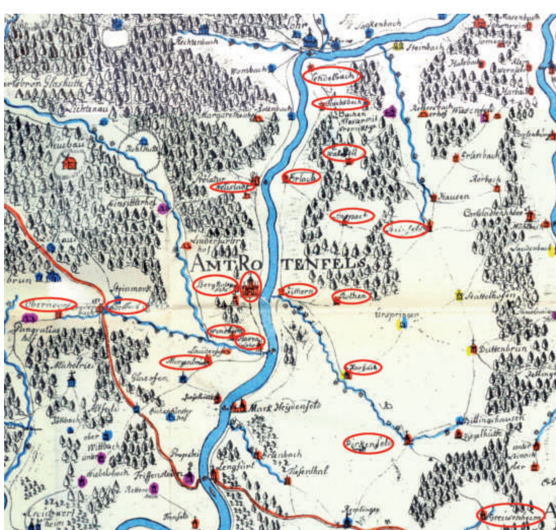
Die Fackenhofen-Karte von 1791 macht die Bedeutung von Zimmern als Brückenkopf von Rothenfels auf der östlichen Mainseite deutlich. Einkreist sind die Orte des Amtes Rothenfels.

Die Fähre verband Rothenfels und Zimmern. Wer mit dem Herrschafts- und Landgericht in Rothenfels zu tun hatte, reiste bis 1862 aus den Amtsorten auf der Marktheidenfelder Platte überwiegend über Zimmern und die dortige Fähre an. Rothenfels verlor von der Mitte des 19. Jahrhunderts an immer mehr an Bedeutung und die Fähre wurde nach Auflösung des Amtes für den lokalen Austausch von Menschen und Waren genutzt.