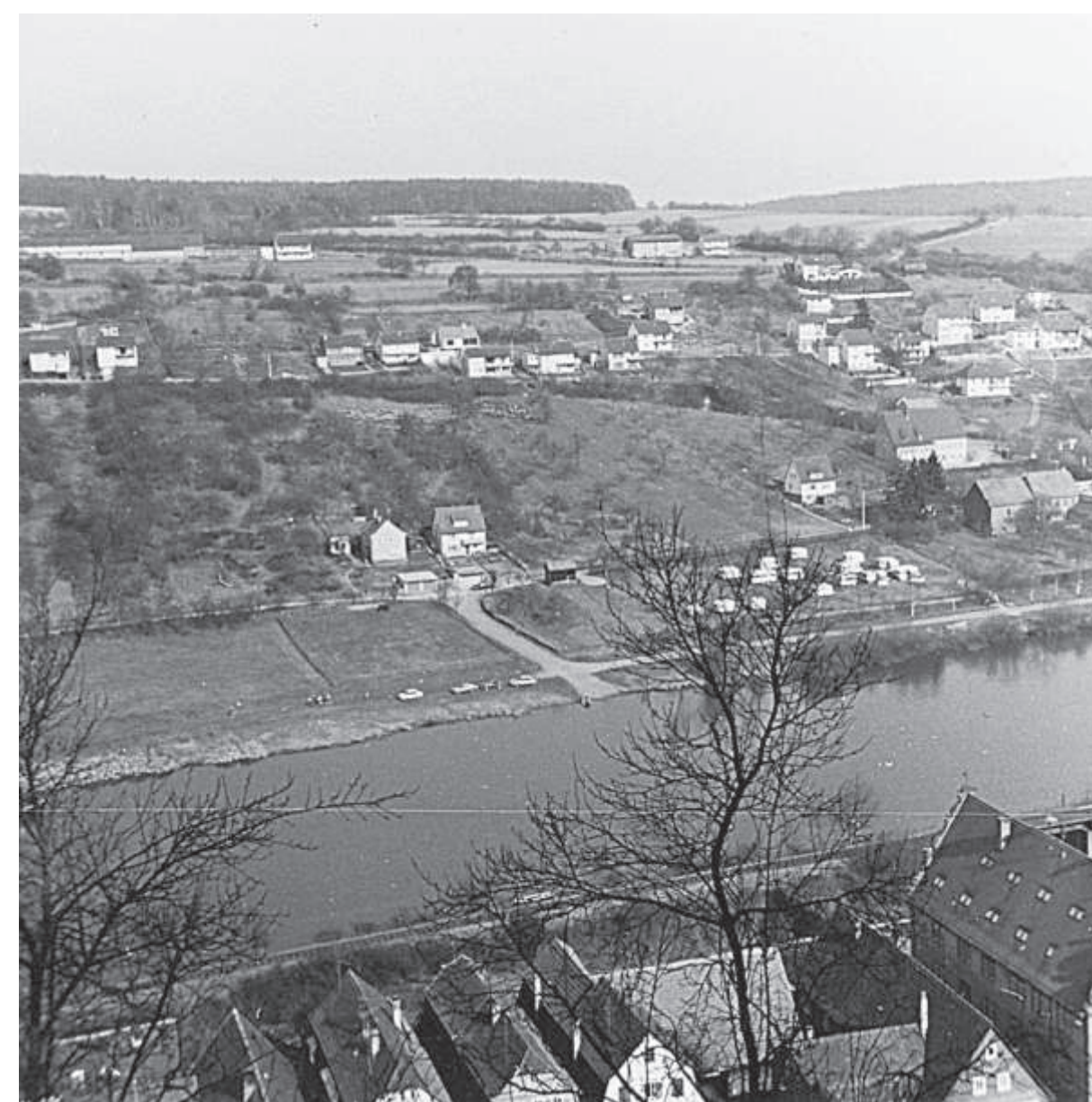
Blick von der Burg Rothenfels auf das Zimmerner Fahr, 1960er Jahre. Rechts die zum Schutz vor Hochwasser auf die Fahrgärten hochgezogenen Wohnwagen, links vom Fahr der Rothenfelser Dreschplatz und der Rothenfelser Sportplatz.

Bedingt durch die Lage am Main erlebte Zimmern die Entwicklung der Mainschifffahrt mit. Bis um 1900 waren Schiffe in Zimmern beheimatet. Miterlebt wurden die Phasen der Mainschifffahrt vom bergan getreidelten Segelschiff – der dafür genutzte Leinritt oder Treidelpfad verlief auf der Zimmerner Seite und ist weitgehend mit dem heutigen Radweg identisch – über die Kettenschleppschifffahrt von 1890 bis 1935 und die Motorschleppschifffahrt ab 1935 bis zum selbstfahrenden Motorschiff. Erhalten hat sich die für den Leinritt erbaute Brücke über den Karbach im Süden der Gemeinde.