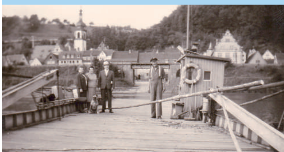
Rechts: Ein Rothenfelser Bauer wartet auf die Fähre, um mit dem Mistfuhrwerk seine Grundstücke auf der Zimmerner Seite zu bewirtschaften (beide Fotos unten von ca. 1960).