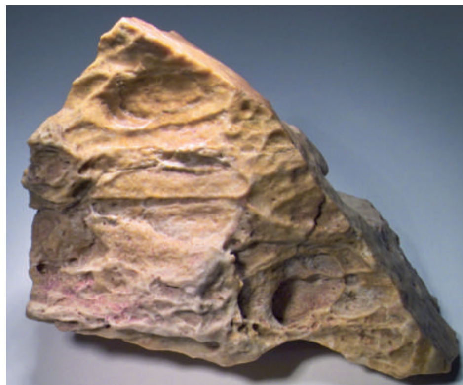
Quarzitische Zechstein-Sedimente aus dem „gelben Steinbruch“, wenige Meter nördlich des Schluchthofes

In der Rückersbacher Schlucht sind auf einer kurzen Distanz sehr unterschiedliche Gesteine angeschnitten. Die Felsen beiderseits der Schlucht bestehen aus Gneisen und Glimmerschiefern der etwa 330 Millionen Jahre