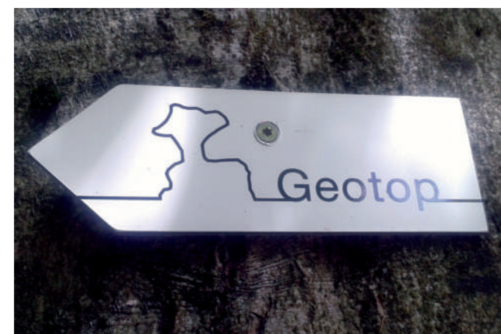
Oben: Infotafel zum Phonolith, am Kulturweg ca. 1 km vom Schluchthof entfernt; daneben liegt ein Phonolith, dessen Oberseite glattgeschliffen wurde. Mit der Markierung rechts erreichen Sie auf einem Stichweg den Steinbruch, wo der Phonolith abgebaut wurde. Sie benötigen gutes Schuhwerk - nicht für Kinderwagen geeignet. Unten: links ein angeschliffenes Phonolith-Handstück (Bildbreite 14 cm); rechts ein Dünnschliff (Bildbreite 5 mm)