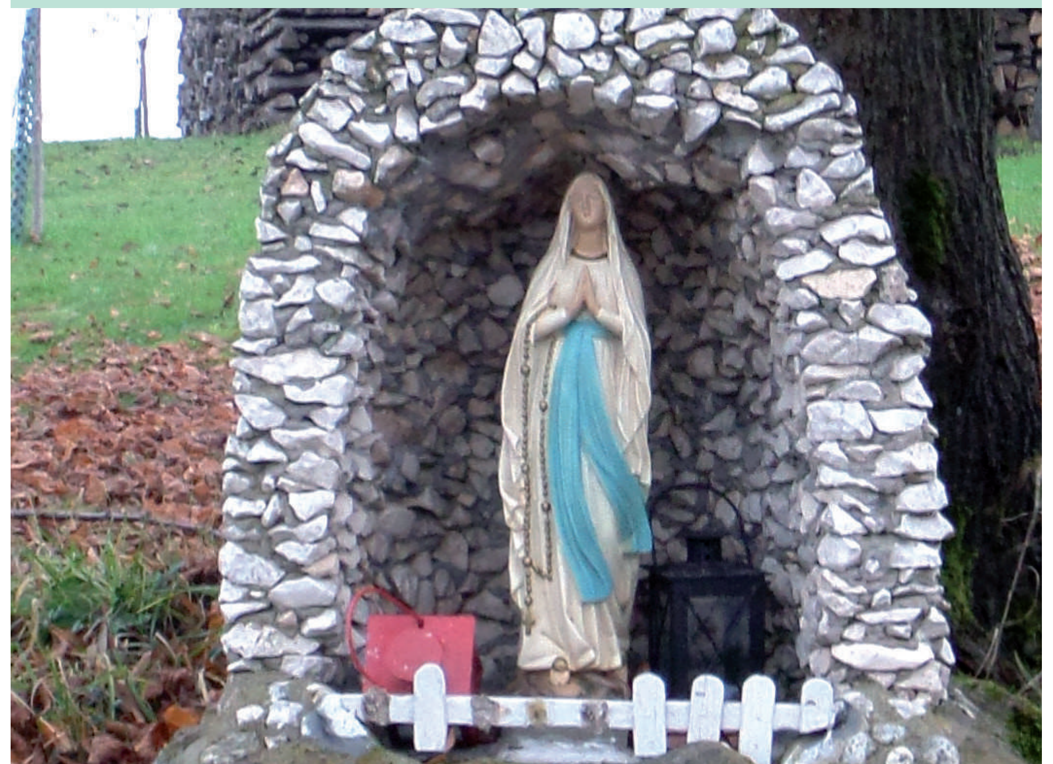
Bildstock am Ortsrand Ruppertshütten