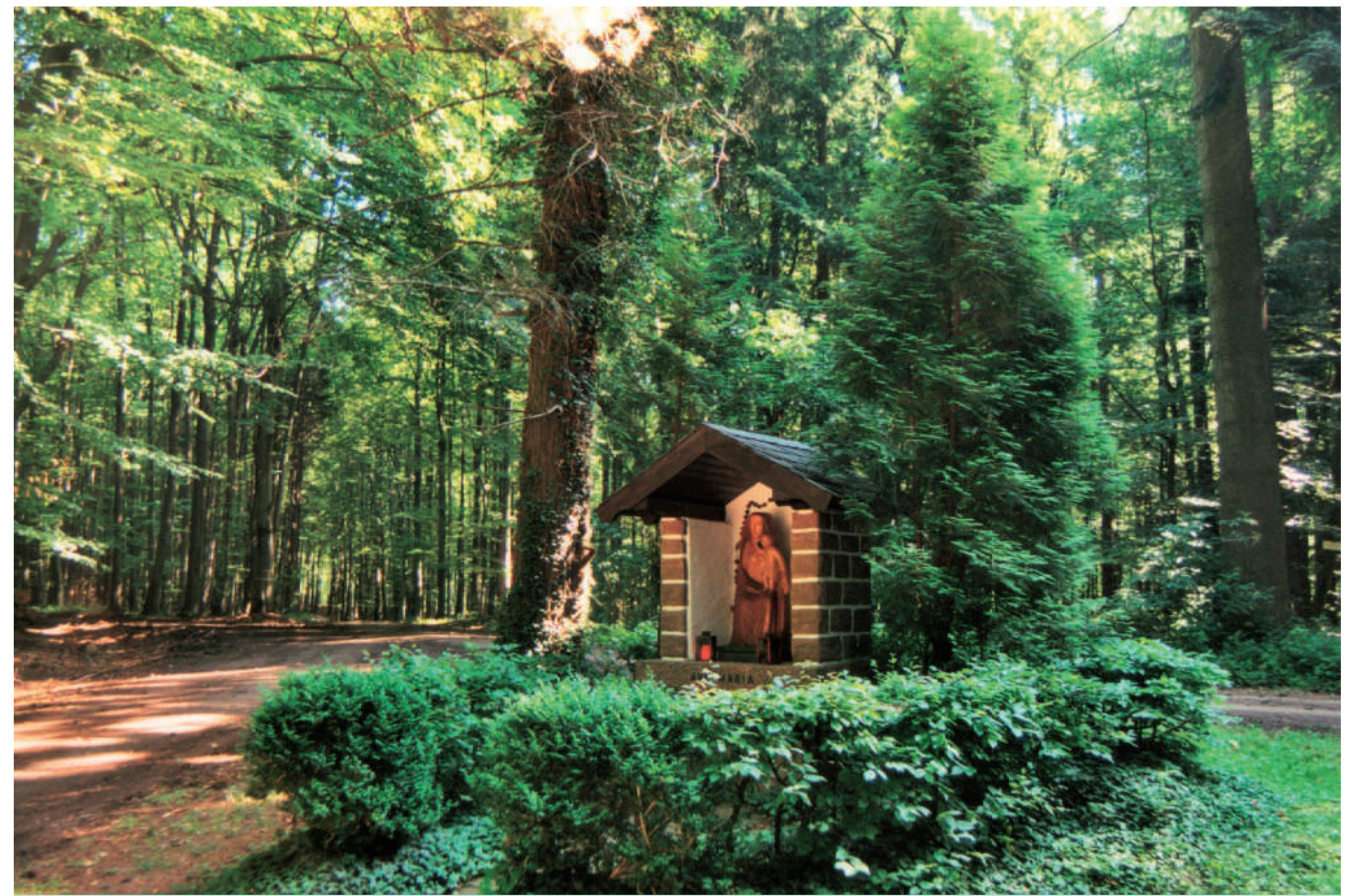
Der „Ave-Maria“-Bildstock wurde im Revier eines Försters errichtet, der selbst evangelisch war, aber die Errichtung (und Finanzierung) durch die Waldarbeiter unterstützte.

Um Ruppertshütten fällt besonders auf, dass die Bildstöcke jüngeren Datums sind. Dies ist um so interessanter, da sich in anderen Gebieten Frankens im 20. Jahrhundert Bildstockverluste von einem Viertel des Bestandes nachweisen lassen.