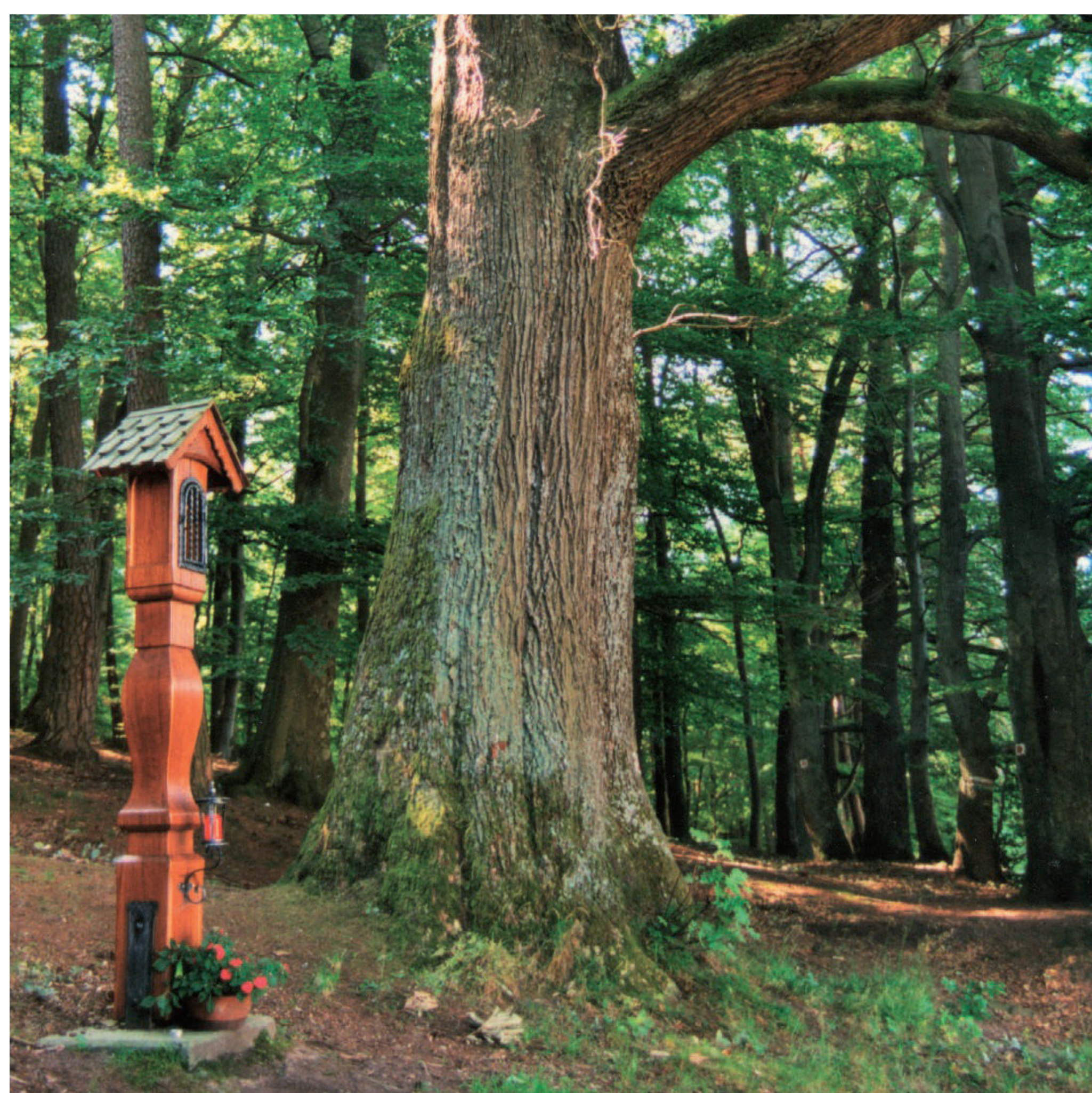
Die Josefseiche am Beginn des Kulturweges sollte - der Legende nach - Leute unter ihrem Schirm besonders gegen Blitzschlag schützen.

Auf dem nahegelegenen Kulturweg um Flörsbachtal-Lohrhaupten werden Sie keinem Bildstock begegnen - Lohrhaupten war hanauisch und ist damit evangelisch. Ein Zeugnis der Reformationszeit von 1524 beschreibt: „Gleich darnach fieng man an alle bilder und bildstock, so hin und her uff den strassen, under den bommen, in den huseren uffgericht und angenagelt, zerrissen, abbrechen und zerstören.“