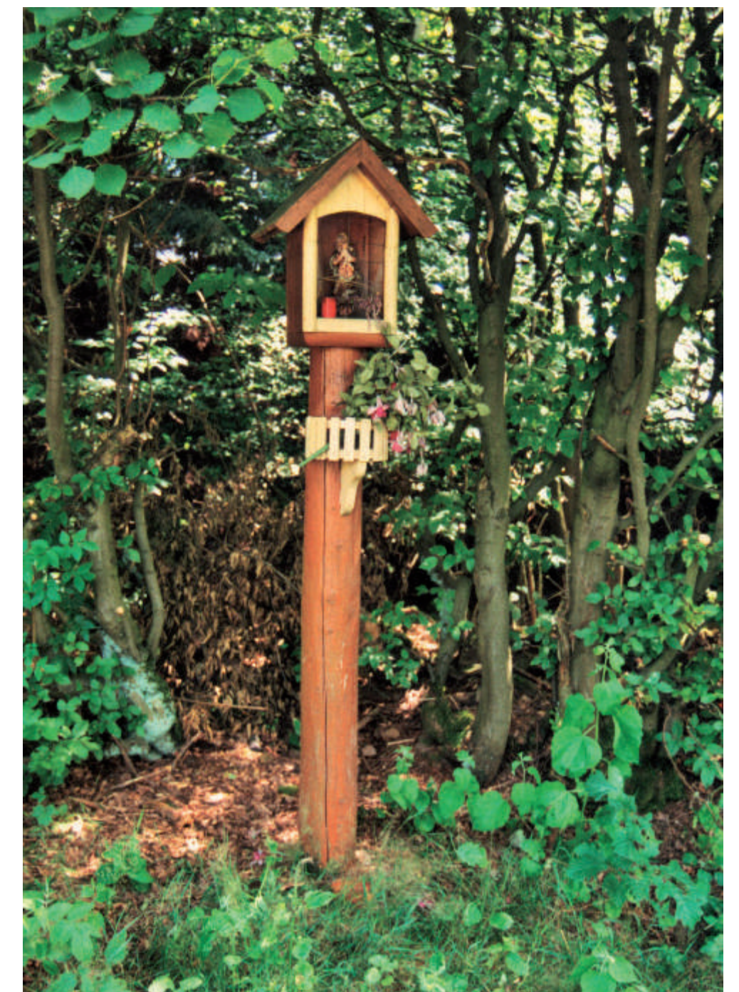
Bildstöcke an der Birkenhainer Straße und auf dem Märzenrück