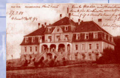
Die Küppelsmühle um 1910