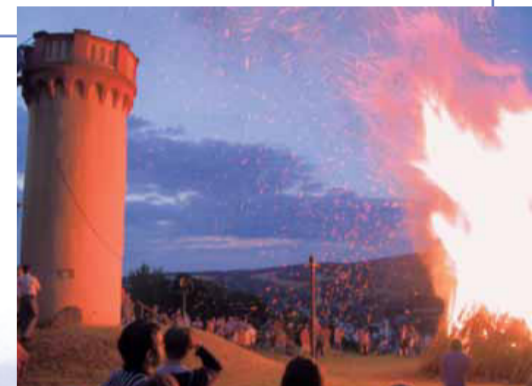
Der Wartturm beim alljährlichen Johannisfeuer