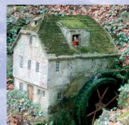
1928 wurde das Wohn- und Gasthaus der Küppelsmühle abgerissen und an gleicher Stelle der heutige Mühlenhof errichtet. In wehmütigem Gedenken wurde das kleine Mühlchen als Modell gebaut. Alle paar Minuten schaut der Müller aus dem Fenster und nickt.