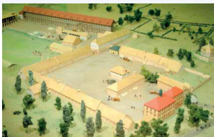
Das Modell der Orber Saline im Museum zeigt das Gelände, auf dem später der Kurpark entstand. Die farbigen Gebäude sind bis heute erhalten.