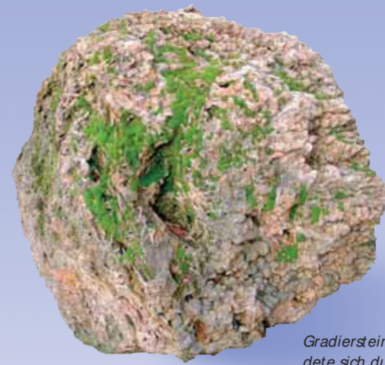
Gradierstein bildete sich durch das Absetzen von Ablagerungen in mit Sole gefüllten Holzkästen (mehrere Blöcke vor dem Museum).

Ob als historische Salzmetropole oder als moderne Kurstadt – in Bad Orb dreht sich alles um seine salzhaltigen Quellen. Der Kulturweg präsentiert Ihnen die Stadt und das Orbtal zwischen Burg und Wildpark.