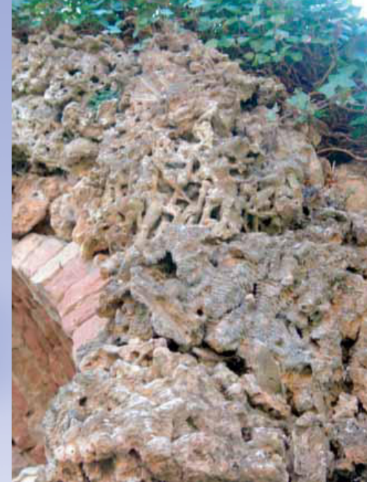
Dornstein entstand im Gradierwerk durch Ablagerungen der tropfenden Sole am Schwarzdorn (Mariengrotte, wenige Meter oberhalb von Burg und Kirche)