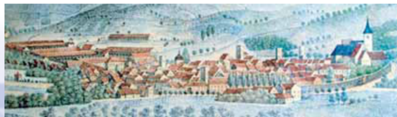
Die Mächtigkeit der Salinenanlage wird auf dieser Abbildung aus dem 19. Jahrhundert deutlich.