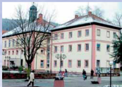
Heute befindet sich die Tourist-Information im Gebäude der ehemaligen Salinenverwaltung.

Mit dem Orber Apotheker Franz Leopold Koch begann 1837 die Orber Badetradition. Der Aufstieg zum bedeutenden Badeort erfolgte ab 1899 mit dem Verkauf der gesamten Salinenanlage an eine Gruppe von Frankfurter Investoren, hervorgegangen aus einer Jagdgesellschaft. Seit 1909 durfte sich die Stadt dann stolz »Bad Orb« nennen. Das Kurwesen sorgte für einen stetig steigenden Wohlstand. Nach der Reform des Gesundheitswesens hat sich Bad Orb dieser Herausforderung gestellt und verfolgt neue Wege hin zu einem modernen Gesundheitszentrum des 21. Jahrhunderts.