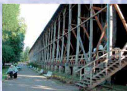
Der Verein der Freunde des Bad Orber Gradierwerks e.V. sorgt für die Erhaltung des letzten Bad Orber Gradierwerkes.