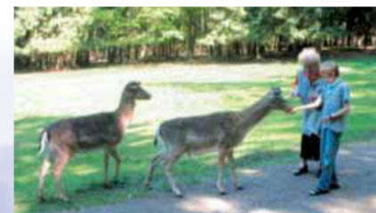
Heute füttern Kinder die Tiere im Wildpark.