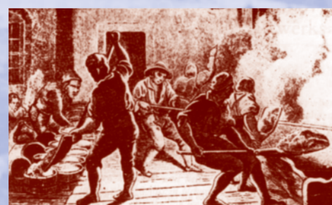
Die Abbildung vermittelt einen Eindruck von der harten und schweißtreibenden Arbeit der Salzsieder im 19. Jahrhundert.

Bad Orb kann auf eine mehr als 900-jährige überlieferte Geschichte der Salzgewinnung und des Salzhandels zurückblicken. Ende des 18. Jahrhunderts erreichte die Produktion mit 40.000 Zentnern Salz pro Jahr ihren Höhepunkt. Unter bayerischer Herrschaft ab 1814 und ab 1867 unter preußischer Regierung ging der Salzbetrieb stetig zurück, bis die Saline 1899 endgültig geschlossen wurde. Das Salz wurde durch Versieden der Sole oder durch Verdunsten im Gradierwerk gewonnen. Durch die Verdunstung und den verminderten Wassergehalt verflüchtigt sich die Kohlensäure und es kommt zur Ausfällung von gelöstem Kalk, Gips und Eisen, was zur Versteinerung des Schwarzdornreisigs führt (»Dornstein«). Dadurch entsteht in den Gradierwerken eine künstliche »Seeluft«, die für den Kurbetrieb zur Inhalation genutzt wurde und wird.