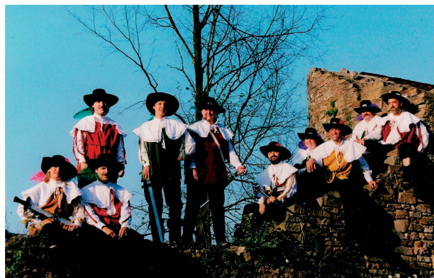
Die Theatergruppe „Peter von Orb“ gibt es seit Herbst 1999, nachdem ihr erstes Stück „Peter von Orb“ mit großem Erfolg auf der Bühne des Holzhofes gespielt worden war. Da die meisten Mitspieler weiter Theater spielen wollten, wurde die Theatergruppe gegründet. Sie gehört als selbständige Abteilung seit Januar 2000 dem Kulturkreis Bad Orb an und veranstaltet jährlich im Sommer die Holzhof-Festspiele.

Im 13. Jahrhundert waren die Orber Erphen Vögte des Amtes Geiselbach, das zur Abtei Seligenstadt gehörte. Über Jahrzehnte hinweg stritten sie mit den Seligenstädter Äbten um die Belastung der Bauern, die sich mehrfach über das harte Joch der Vögte beklagt hatten. Diese Bauern trugen den Namen „Peterlynge“, weil sie dem Kloster St. Peter unterstellt waren. Hier könnte ein Anhaltspunkt für die Entstehung der Sage liegen, in der vielleicht ein Körnchen Wahrheit steckt. So könnte der legendäre Peter von Orb eine historische Wurzel haben, die zu den „Peterlyngen“ führt.