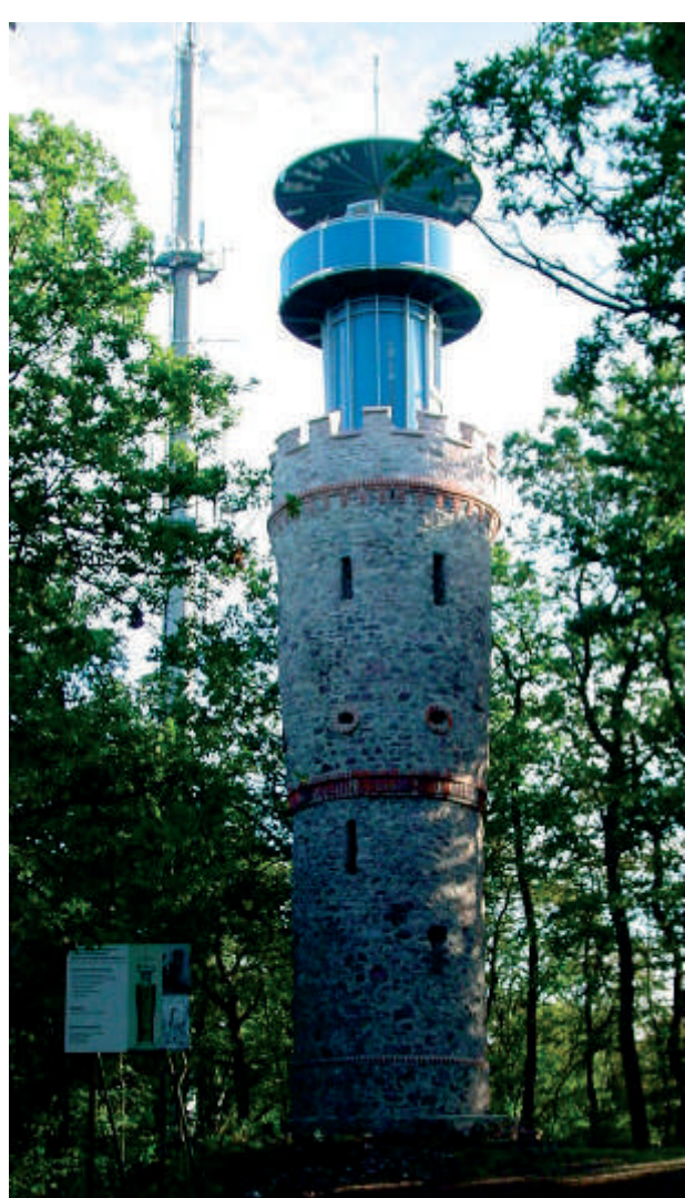
Links: Der 2004 renovierte Ludwigsturm auf dem Hahnenkamm bei Alzenau.