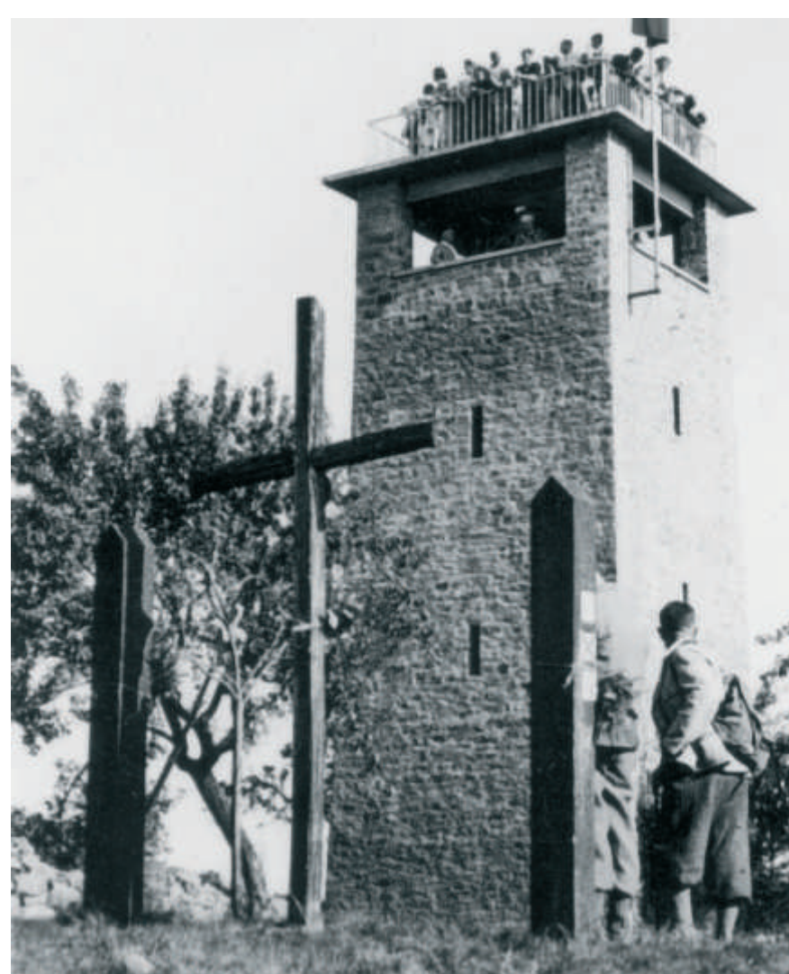
Rechts: Der Kellerturm auf der Geishöhe bei Dammbach (bei der Eröffnungsfeier im Jahr 1937) erlaubt einen Blick über den Südspessart.