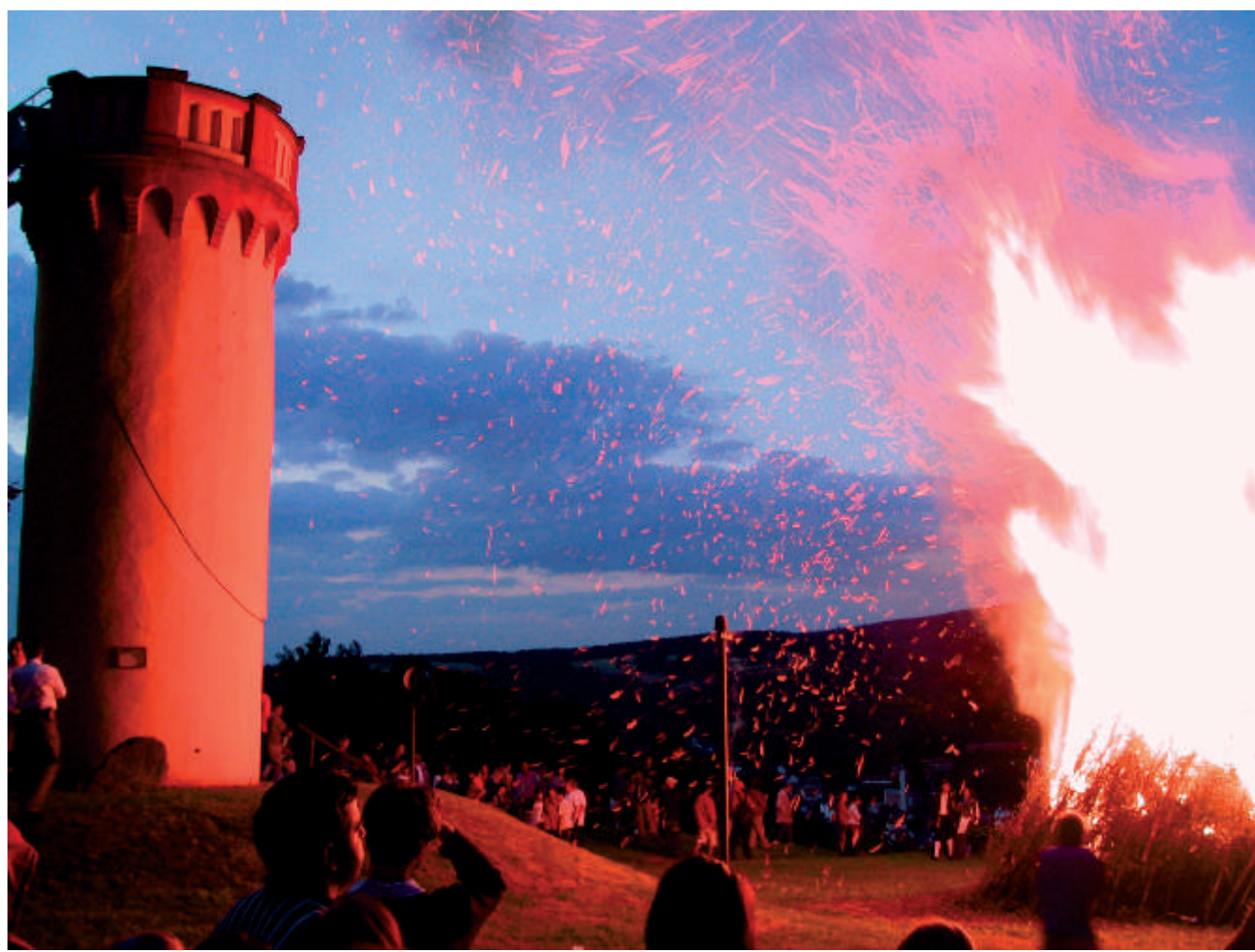
Das sommerliche Johannisfeuer ist alljährlich ein besonderes Ereignis auf dem Orber Hausberg.

Der Orber Turm gestattet einen der wenigen Fernblicke im Spessart. Der Spessart, im wesentlichen eine Hochfläche aus Buntsandstein, die nur durch ihre Täler strukturiert wird, hat wenige Erhebungen, ist dafür aber heute wieder weitgehend bewaldet. Damit ergeben sich nur wenige natürliche Ausblicke. Neben dem Wartturm bieten unter anderen der Ludwigsturm auf dem Hahnenkamm bei Alzenau, der Kellerturm auf der Geishöhe bei Dammbach sowie die Bellingerturme bei Steinau an der Straße interessante Weitsichten. Genießen Sie also hier vom Wartturm den Rundblick über die Spessarthöhen.