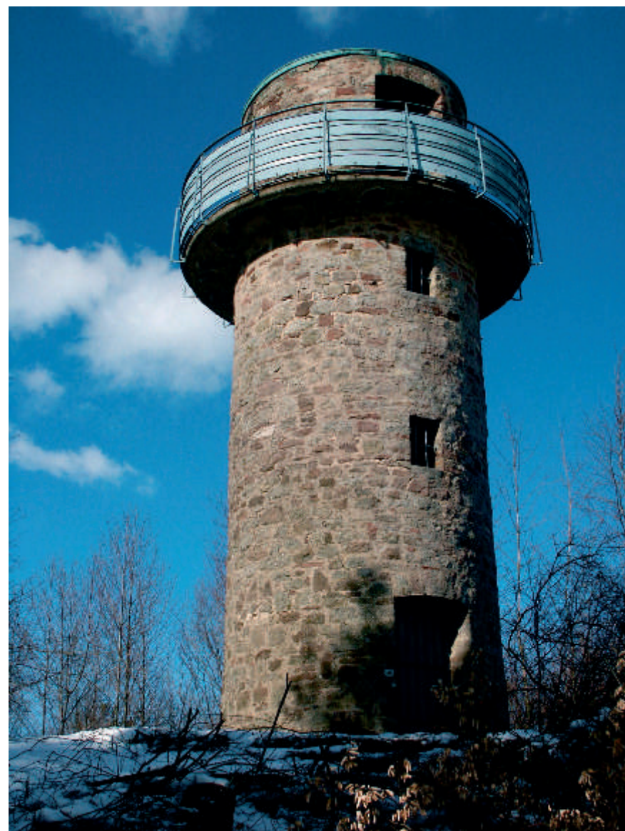
Von der Bellingerturme richtet sich der Blick auf Kinzigtal und Vogelsberg.

Um den Wartturm auf dem Molkenberg rankt sich die Sage um Peter von Orb, die sich in einer Sammlung „Spessartsagen“ aus dem 19. Jahrhundert als „Die Sage vom Fuchsstein“ findet. Peter von Orb soll als Räuber die Gegend um Orb heimgesucht haben, wurde jedoch von der einheimischen Bevölkerung mit scheuem Respekt betrachtet. Schließlich wurde er von der Obrigkeit gefasst und zum Hungertod verurteilt. Zu diesem Zweck mauerte man ihn in den Wartturm auf dem Molkenberg ein. Peter habe jedoch einen zahmen Fuchs gehabt, der einen schmalen Durchgang zu dem Gefangenen gegraben habe. Daraufhin konnte Peter diese enge Röhre erweitern und in die Freiheit gelangen.