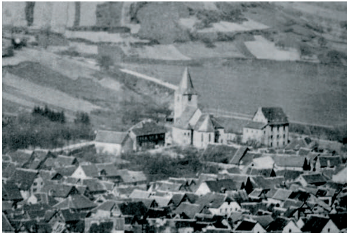
Burg und Kirche dominieren die Orber Altstadt auf diesem Foto aus dem frühen 20. Jahrhundert.

Die Geschichte Bad Orbs steht im Zeichen seiner Salzquellen. Sie zogen die ersten Siedler ins Tal der Orb und sie sorgten für den Wohlstand der mittelalterlichen Stadt und für den Aufschwung durch den Kurbetrieb im 20. Jahrhundert. Die stattlichen Fachwerkhäuser Orbs im ersten Teil der Kulturweges vermitteln einen Eindruck des wirtschaftlichen Potenzials der Salzproduktion. Siedlungsgebiet und Salinenbetrieb waren ab 1767 räumlich getrennt. Das weitreichende Gelände südlich der Stadt mit rund ein Dutzend Gradierwerken lässt sich heute nur noch erahnen. Dem wirtschaftlichen Niedergang im 19. Jahrhundert versuchte man durch die Anfänge des Kurwesens entgegen zu wirken. Seit Beginn des 20. Jahrhunderts war die Kur das wirtschaftliche Standbein von Bad Orb. Die Strukturveränderungen seit den 90er Jahren haben wieder zu fundamentalen Veränderungen geführt: Die klassische Kur gibt es nicht mehr. Heute ist Bad Orb auf dem Weg zu einem modernen Gesundheitszentrum.