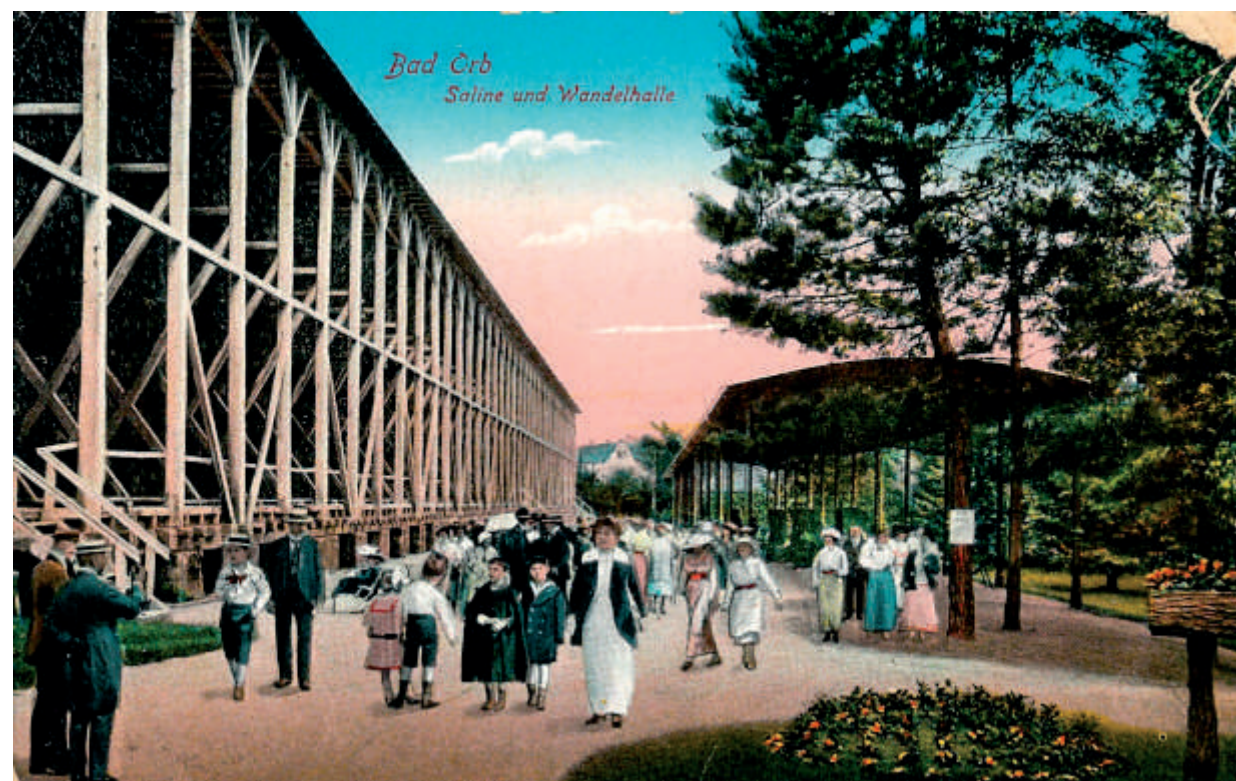
Mondänes Bummeln am Gradierwerk um 1900.