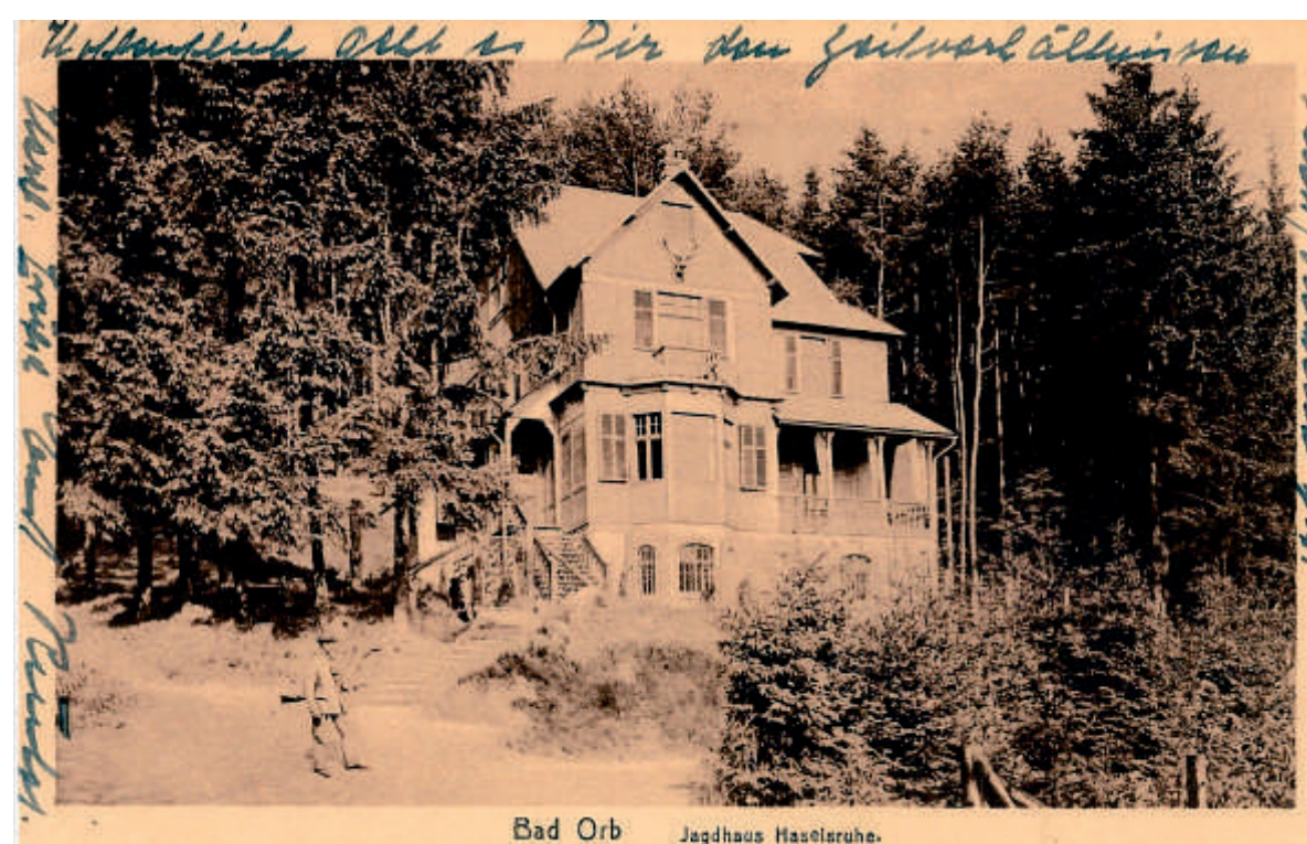
Um 1907 wurde für die Frankfurter Jagdgesellschaft das Jagdhaus Haselruhe erbaut.