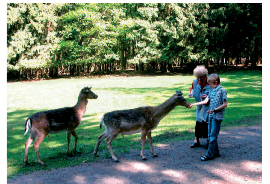
Heute füttern Kinder das Wild im Park.

Im Jahre 1934 wurde im Orbtal der erste Wildpark mit Damwild eingerichtet, der 1937 an den heutigen Standort verlegt und im Jahre 2002 neu gestaltet wurde. Derzeit besuchen jährlich etwa 35.000 Gäste den Bad Orber „Spessart-Wildpark“. Dort kann man Rotwild, Damwild, Muffelwild, Sikawild und Wisente beobachten.