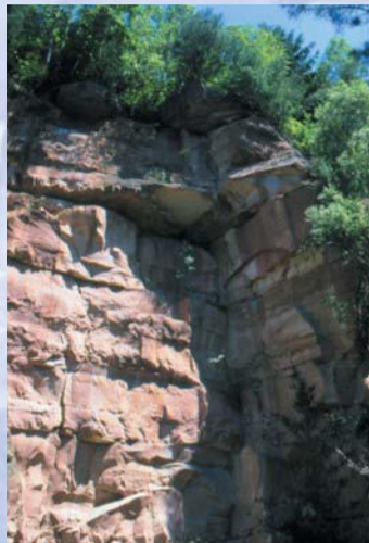
»Heigenbrückener Buntsandstein« in der Nähe des Bahnhofs