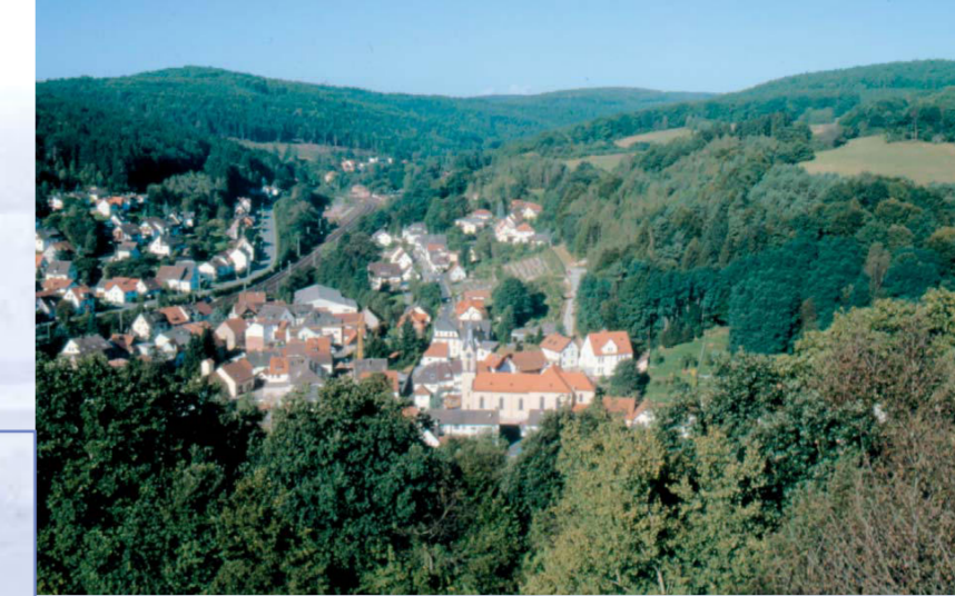
Blick auf Heigenbrücken

Glasmacher, Buntsandstein und Touristen haben die Geschichte Heigenbrückens geprägt. Wie durchdrungen der Spessart um Heigenbrücken von historischen Ereignissen ist, zeigt der Kulturrundweg mit sechs Stationen.