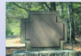
Ein Steinkreuz erinnert an einen Zwischenfall in den Franzosenkriegen 1796