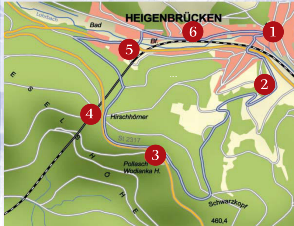
Weglänge ca. 6 km