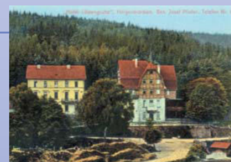
Im Hotel »Löwengrube« gründeten sich 1880 die »Spessartfreunde«. Das Gebäude wurde bei der Straßenverbreiterung abgerissen.

Mit dem Eisenbahnschluss und dem damit verbundenen Tunnelbau veränderte sich die Verkehrslage für Heigenbrücken erheblich zum Besseren. Es entstanden nicht nur mehr Arbeitsmöglichkeiten, es hatten nun auch viel mehr Menschen Gelegenheit, Heigenbrücken zu besuchen. Die Heigenbrückener erkannten ihre Chance und begannen, den Bau von Hotels und Tourismuseinrichtungen zu fördern. Um den Tunnelleingang gruppieren sich einige Gebäude, die erst durch den Bahnbau entstehen konnten, darunter das heutige Forstamt, das einst die Villa eines reichen Steinbruchbesitzers war.