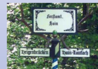
Der Wegweiser »Hirschhörner«