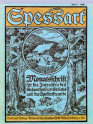
Die Zeitschrift der Kulturlandschaft Spessart, links der »Spessart« 1906, rechts 2015