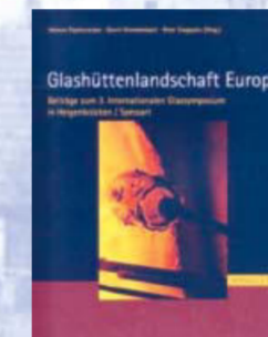
Im Jahre 2006 veranstaltete das Archäologische Spessart-Projekt/Institut an der Universität Würzburg in Heigenbrücken ein internationales Glassymposium.

Für die Herstellung von Glas waren im Spessart alle wichtigen Rohstoffe vorhanden: Holz als Brennmaterial und Grundstoff für Pottasche, Quarzsand sowie die verkehrs- und absatzgünstige Lage am Rhein-Main-Raum. Der nahe bei Heigenbrücken liegende Bächlesgrund war für den Bund der gleser (Glasmacher) uff umb den Speßhart von 1406 ein ganz besonderer Ort. Hier sollen bis in das erste Viertel des 16. Jahrhunderts die Pfingstversammlungen der Glasmacher stattgefunden haben, bei denen Verstöße gegen die Bundesordnung gerügt und andere Anliegen der Glasmacher geregelt wurden.