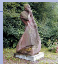
Die Skulptur des Glasbläfers wurde im Zuge der Straßenverbreiterung geschaffen.