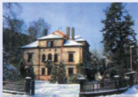
Das Gebäude des Forstamtes Heigenbrücken