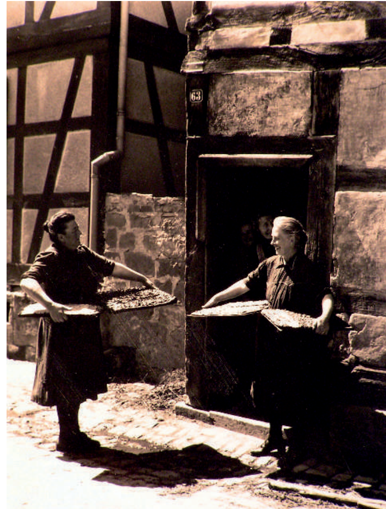
Dörfliches Leben: Das Foto entstand um 1950. Am Backhaus wird nach dem Brot noch der „Kratzkuche“ eingeschossen.

seit dem 11. Jahrhundert zum Machtbereich der Grafen von Selbold-Gelnhausen, die um 1150 ausstarben. Als weltliche Herrscher setzten sich im Kirchspiel Niedermittlau die Grafen von Ysenburg durch, die hier auch die Reformation einführten. 1566 trennten die Ysenburger das Gebiet links der Kinzig vom Gericht Selbold ab und schufen das neue Gericht Meerholz.