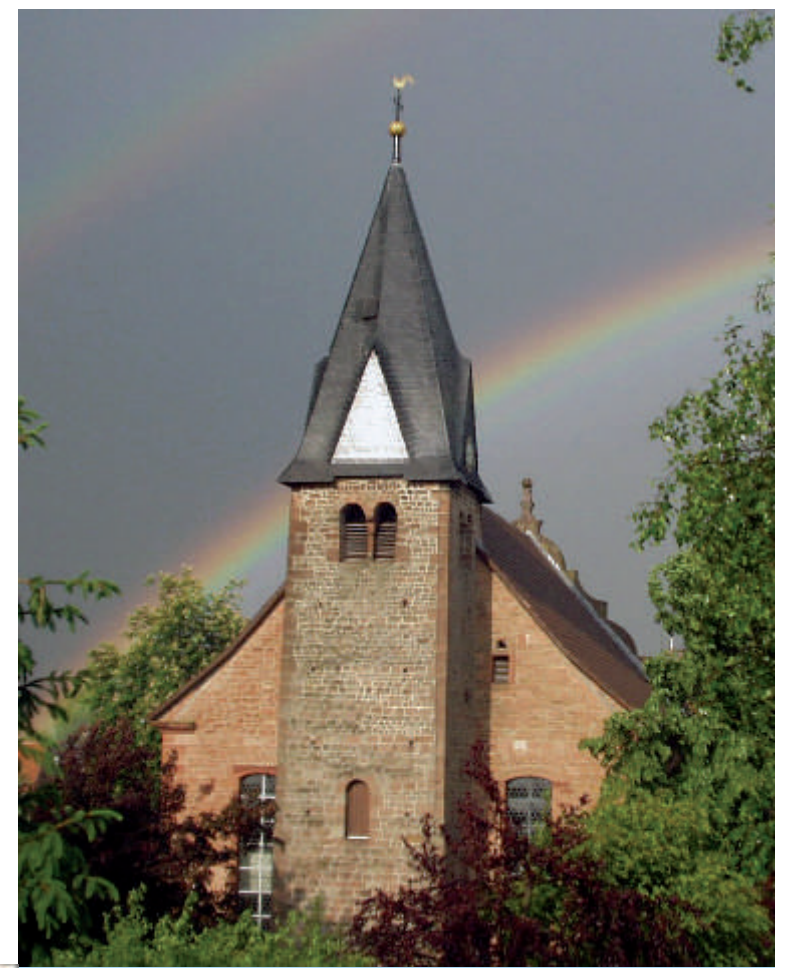
Den alten Turm der Laurentiuskirche kann man erst vom Kirchgarten aus richtig bewundern. Der romanische Löwe, der innen im Turm eingemauert (und nicht zu sehen) ist, dürfte zu Beginn des 12. Jahrhunderts entstanden sein. An der Außenmauer ist unterhalb der Turmuhr die Steinplastik eines Gesichts zu entdecken (links).

Die 1454 (Inscriptenstein neben der Seitentür) umgebaute Kirche wurde im 30-jährigen Krieg schwer beschädigt. An deren Stelle errichtete der Ysenburgische Landesherr 1780 das spätbarocke Kirchenschiff.