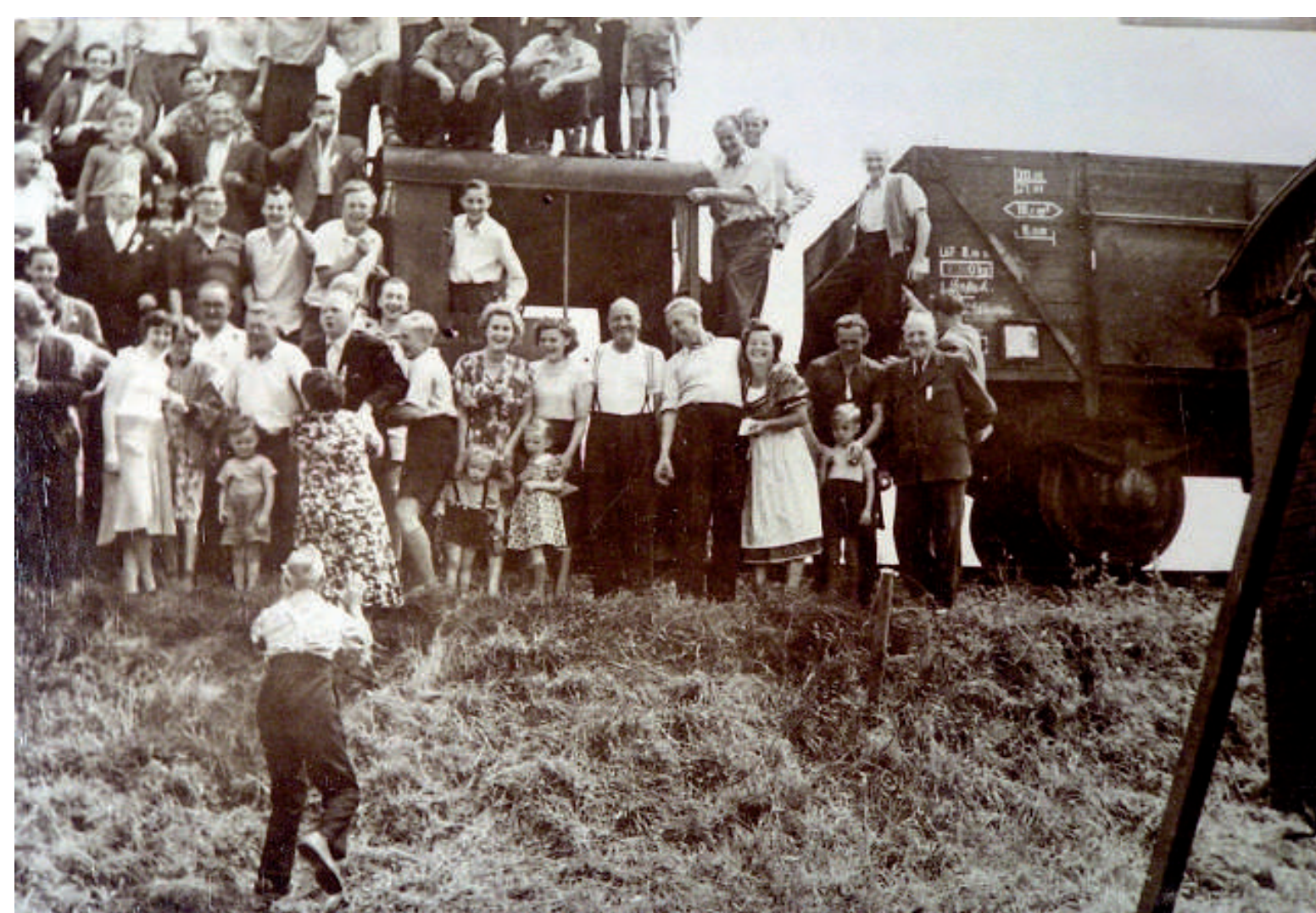
Die Bahn wird anlässlich des Karussellfestes für ein Gruppenfoto angehalten.

Im Heimatmuseum Freigericht in Somborn ist eine sehenswerte Modellanlage dieser Kleinbahn ausgestellt.