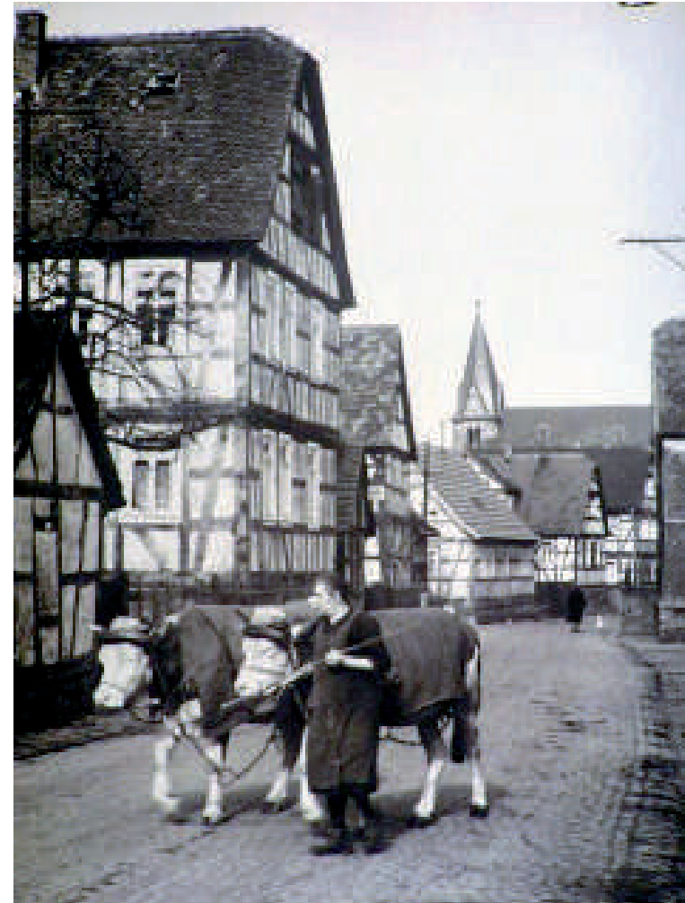
Aus der gleichen Zeit stammt dieses Foto, das eine Bäuerin auf der Hauptstraße mit einem Kuhgespann im Joch zeigt.