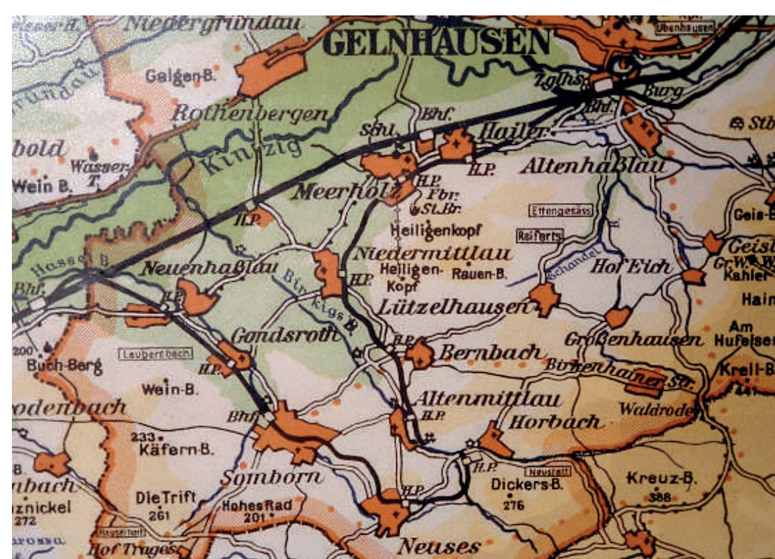
Die Freigerichter Kleinbahn führte vom Kinzigtal in einer Runde nach Gelnhausen.

Die Freigerichter Kleinbahn war zu Beginn des 20. Jahrhunderts eine wichtige verkehrstechnische Errungenschaft. Sie wurde 1904 in Betrieb genommen. Finanziert wurde das Projekt durch die Gründung einer Aktiengesellschaft, deren Anteile zu zwei Dritteln an den preußischen Staat und zu einem Drittel an den Kreis Gelnhausen übergingen, der 1937 Eigentümer der Bahn wurde. Diese verband nun auf einer Länge von 20 km die Bahnhöfe Langenselbold und Gelnhausen. Die in Hanau und Offenbach beschäftigten Arbeiter konnten ihre Arbeitsplätze nun schneller erreichen. Indirekt wirkte sich die Kleinbahn auch auf die Arbeitsplatzsituation aus, da Stückgut wie Kunststoffe oder Kohle einfacher in den Ort gebracht werden konnte. 1955 wurde der Personenverkehr eingestellt. Die Verbindungsfunktion zwischen Gelnhausen und Langenselbold übernahmen Busse.