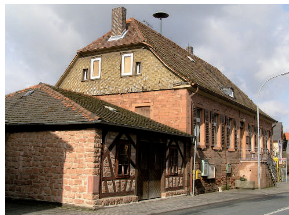
Die volkskundliche Sammlung und die historischen landwirtschaftlichen Geräte in der Remise können in der Hauptstraße nach Voranmeldung besichtigt werden: Tel. 06055 2900