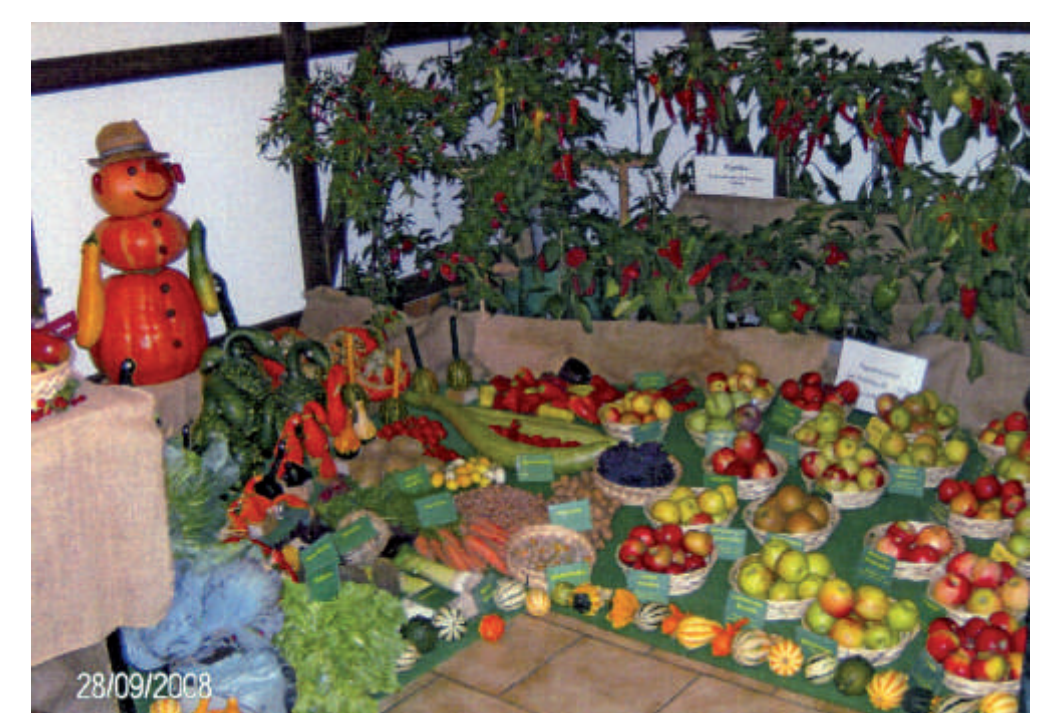
Die Hasselrother Gartenschau wird gemeinsam mit den OGVs von Gondsroth und Neuenhaßlau veranstaltet (Fotos von 2008).