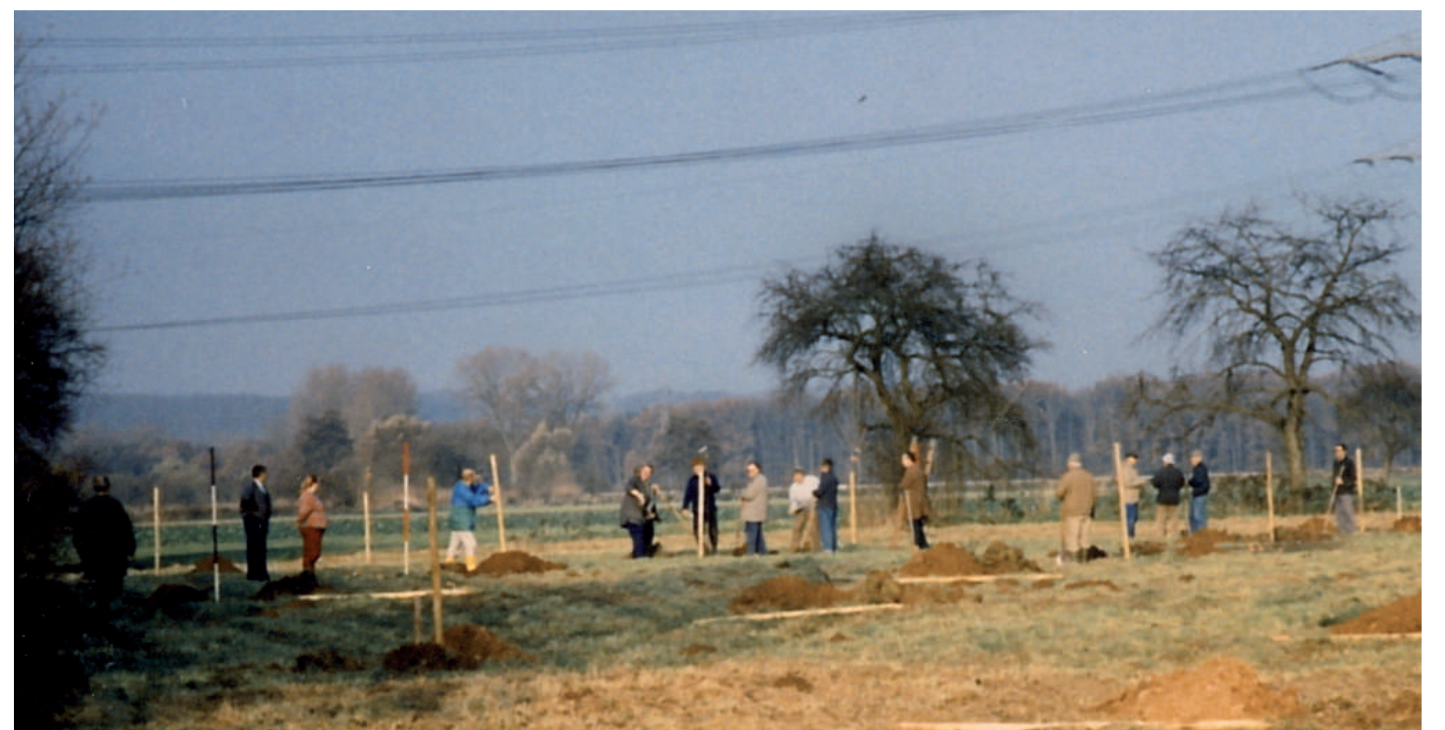
Pflanzaktion im November 1995: Der Start für die Gestaltung eines neuen Stücks Kulturlandschaft