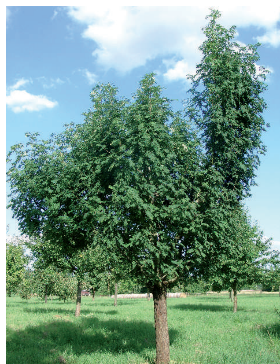
Suchen Sie die beiden Speierlingsbäume hinten links auf dem Gelände! Der Speierling ist nicht essbar, wird aber dem „Äbbelwoi“ als Aromastoff zugesetzt.

Die Streuobstwiese auf dem Grundstück an der Info-Tafel wurde im November 1995 begonnen.