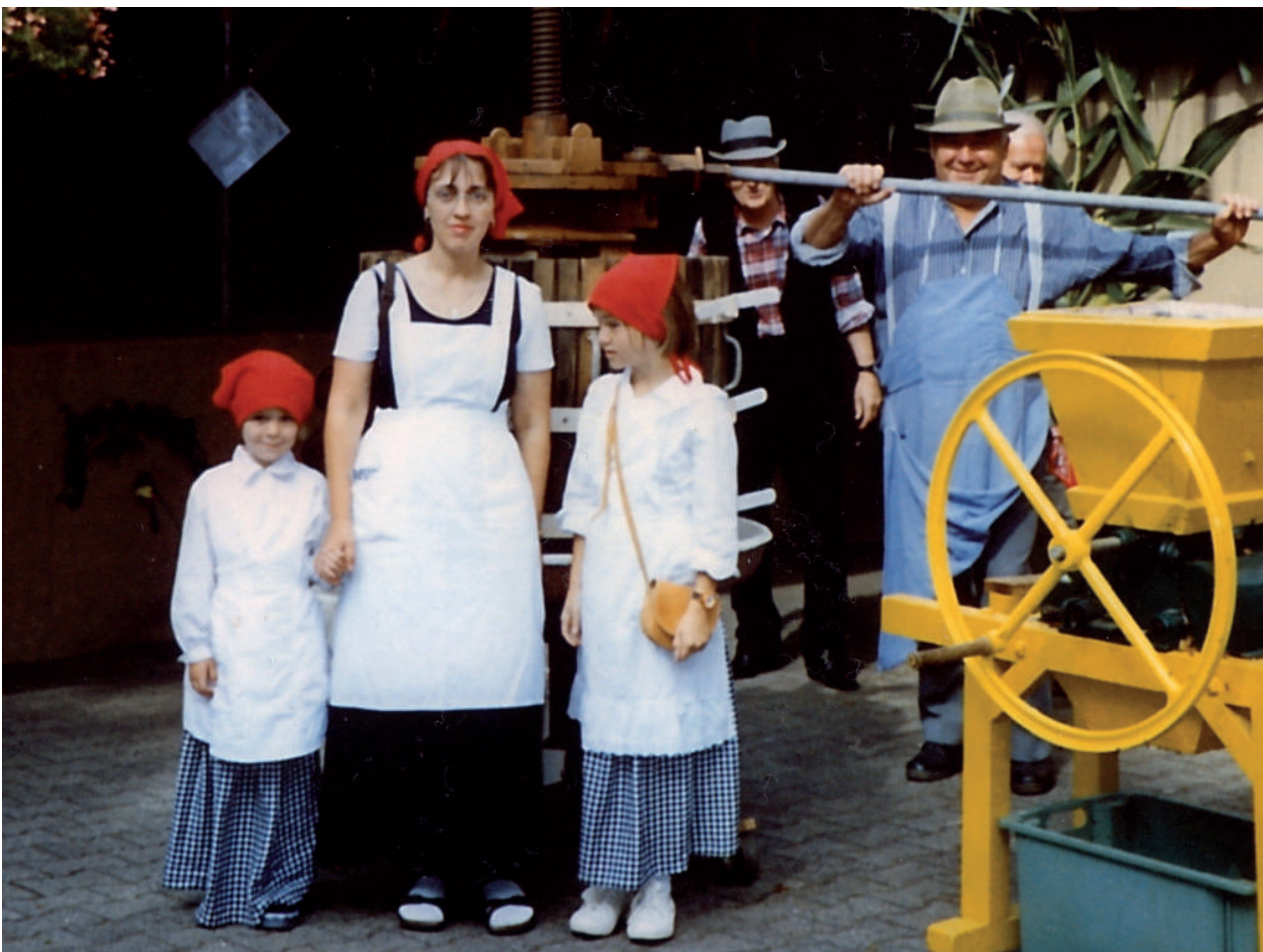
Die historische Kelter anlässlich des 850-Jahre-Jubiläums von Niedermittlau im Jahre 2001.

jeder gegen eine geringe Gebühr seinen eigenen Apfelsaft herstellen konnte.