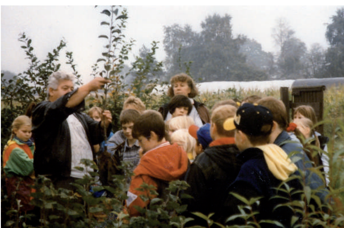
Alljährlich werden die Niedermittlauer Grundschulkinder vom OGV im Lehrgarten unterrichtet.

jeder gegen eine geringe Gebühr seinen eigenen Apfelsaft herstellen konnte.